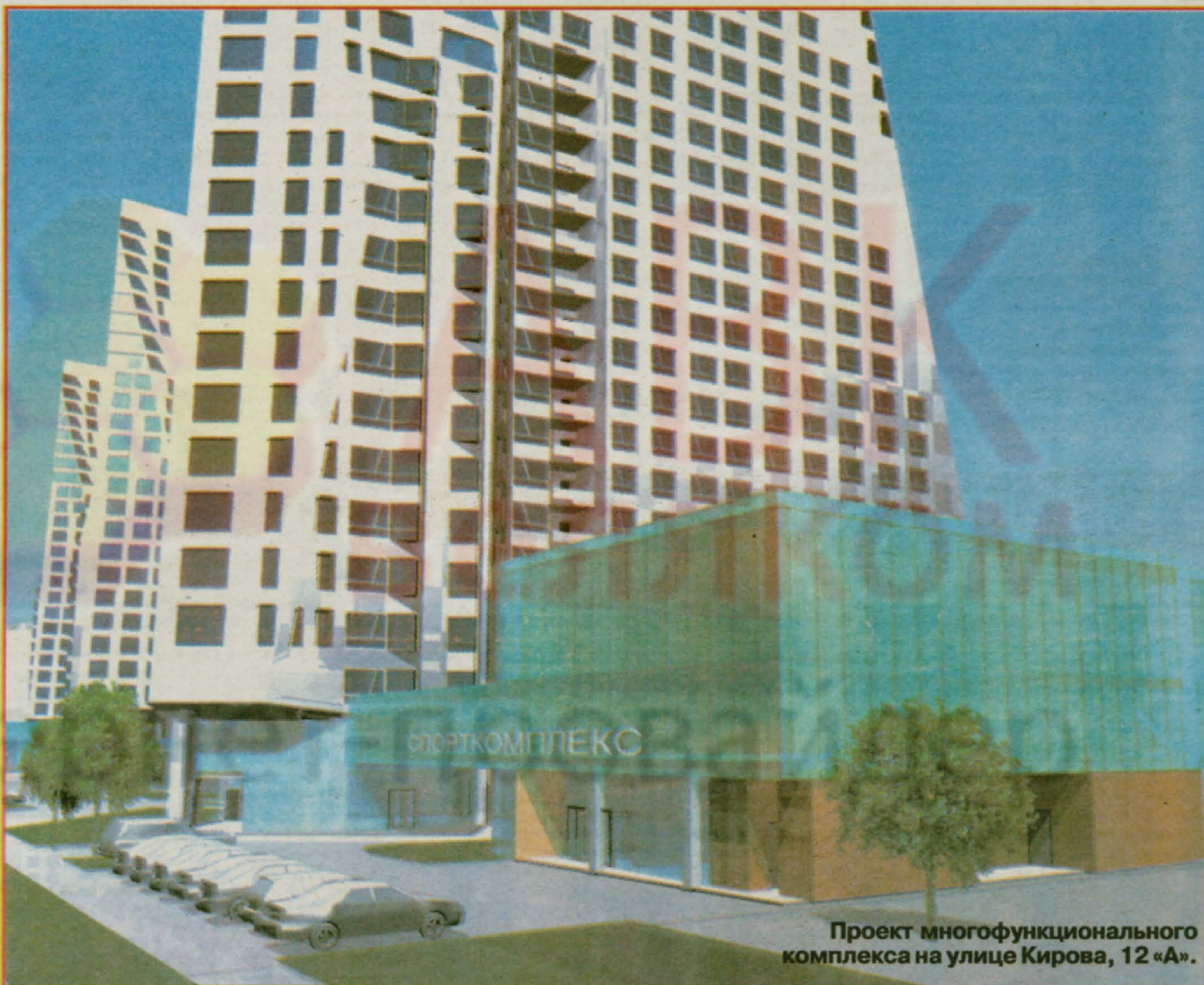
Проект многофункционального комплекса на улице Кирова, 12 «А».