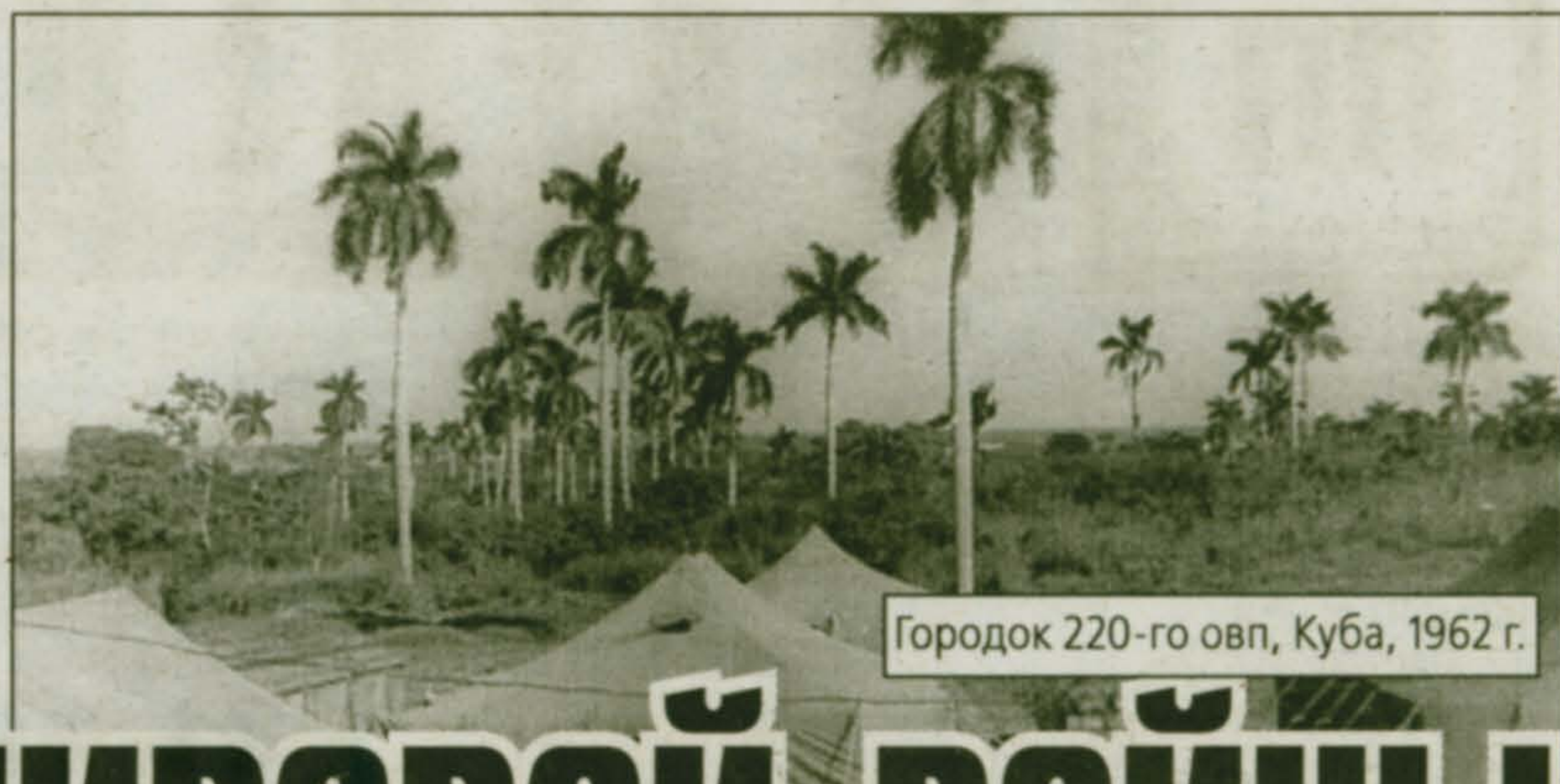
Городок 220-го овп, Куба, 1962 г.