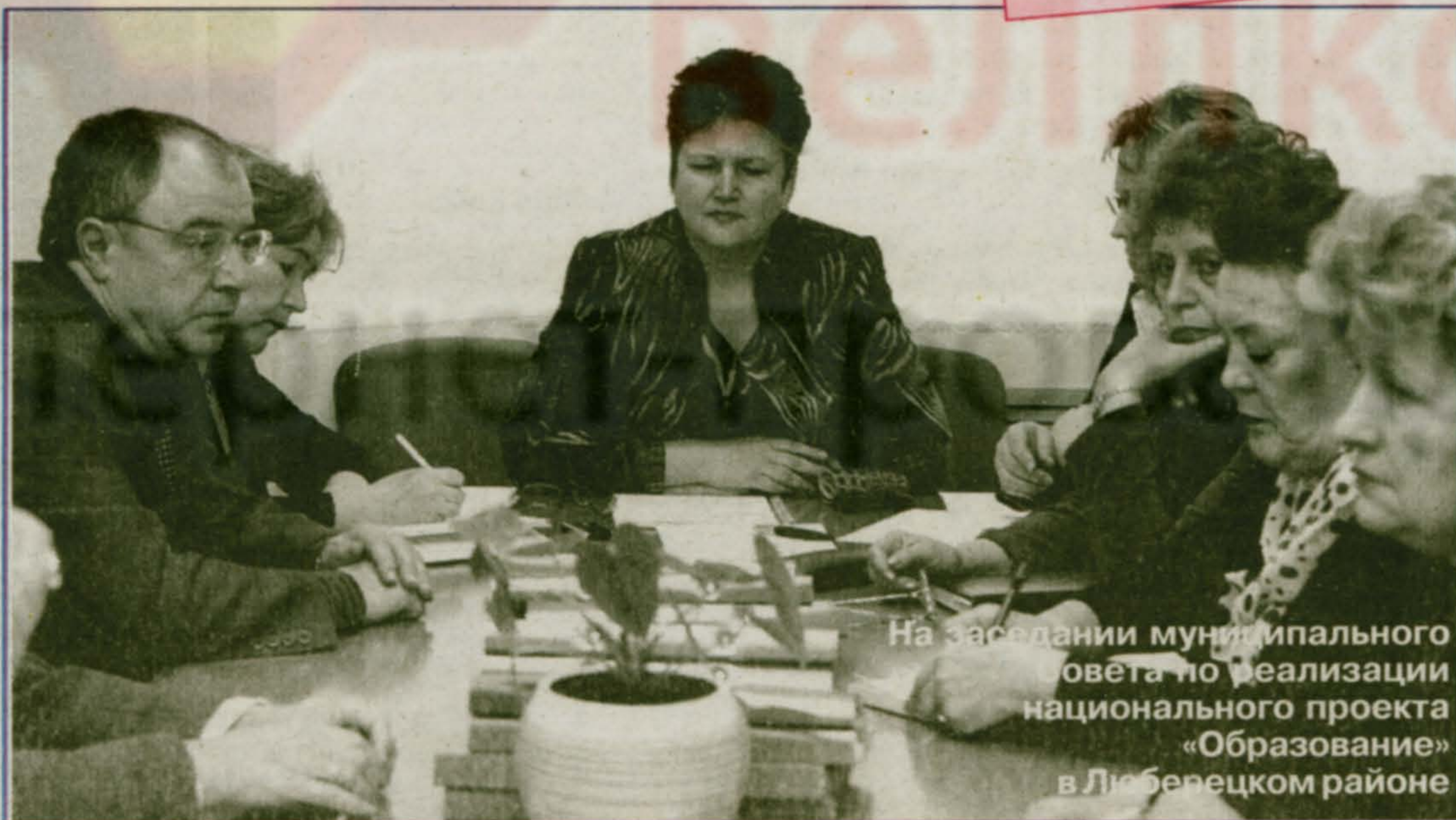
На заседании муниципального совета по реализации национального проекта «Образование» в Люберецком районе

Администрация Люберецкого района Совет депутатов Люберецкого района