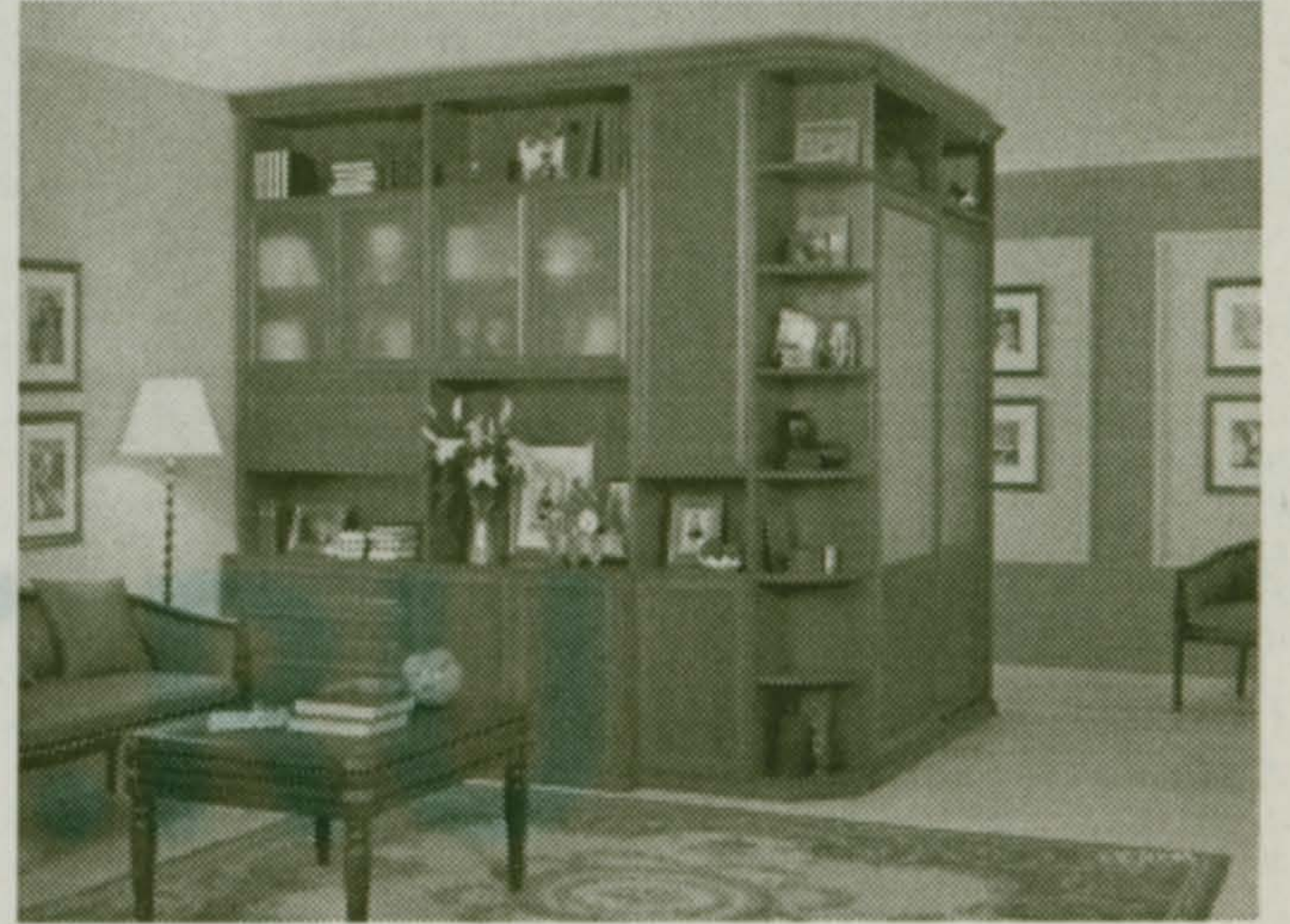
службу по телефонам : 101-22-11 или 733- 93 – 77 и к Вам приедут опытные специалисты (конструкторы и дизайнеры) и помогут это сделать. На снимках: один из производственных цехов и фрагмент интерьера гостиной.