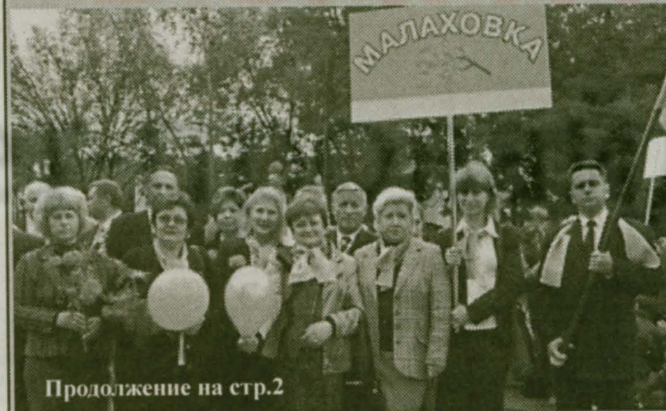
Продолжение на стр.2

По парку разгуливали скоморохи и самый настоящий верблюд. Духовой оркестр играл мелодии 30-40х годов, с эстрадных площадок доносились веселые песни и танцевальная музыка. Звучи праздника забавно перемешивались - в какой-то момент оказалось, что наши российские десантники демонстрируют мастерство рукопашного боя под немецкий «Рамштайн». Но даже при таком, казалось бы, всеобщем веселье отдельные гости были весьма недовольны. Их очень огорчало распоряжение В.П.Ружицкого прекратить торговлю спиртными напитками в городе в день проведения праздника, а также большое количество сотрудников милиции, бдительно наблюдавших за всем происходящим.