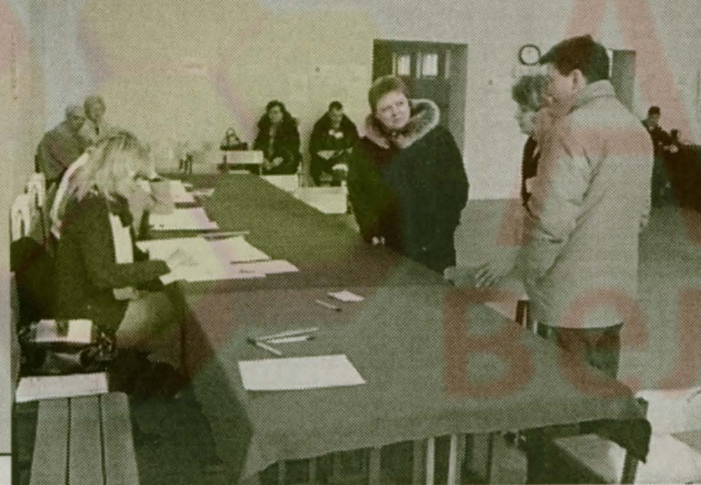
До обеда на всех участках было малоллюдно

Выборы состоялись, и Малаховка традиционно показала завидную явку (на одном из избирательных участков, в Овражках, зарегистрировано аж 44,5% от списочного состава). Но до самого обеда на всех участках почти не было еще желаемых 20%. Только к вечеру «проснувшаяся» молодежь исправила этот недостаток. Могут же ведь, когда захотят!