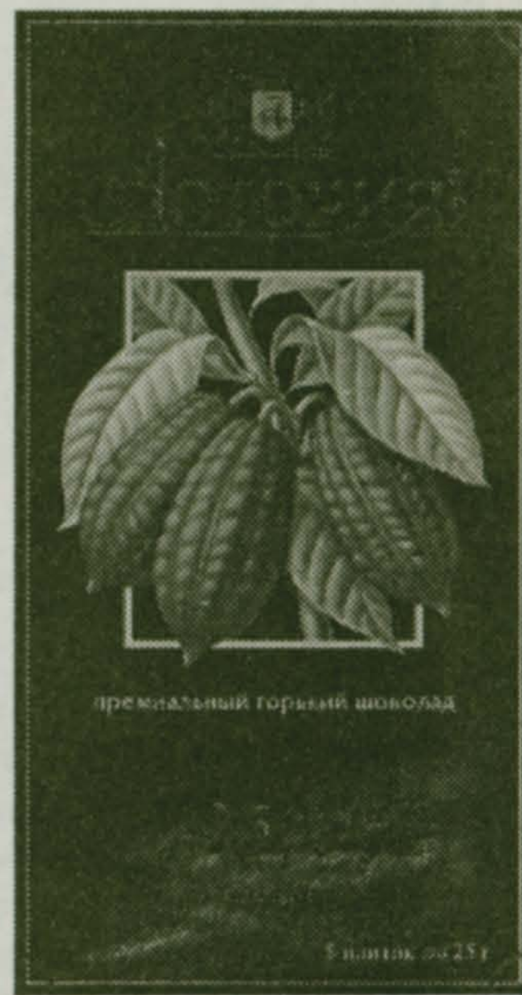
прекрасный горький шоколад

В том числе в благотворительной деятельности. Вот некоторые примеры. Шоколадная продукция фабрики в составе гуманитарного груза от Люберецкого района была направлена военнослужащим 351-го отдельного батальона оперативного назначения, участвующего в контртеррористической операции в Чеченской республике.