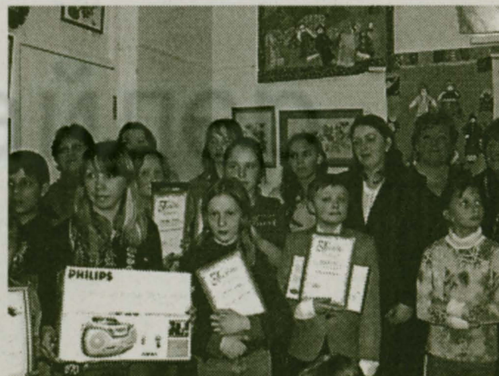
Коллектив ДДиО благодарит ООО «Фабула» за предоставление транспорта для участников выставки и артистов.

Приятно, что в нашем поселке так много талантливых детей. И вдвойне приятно, что остались еще неравнодушные взрослые, помогающие этим талантам расти и развиваться. Ведь, что бы там ни говорили, не победа на отдельном взятом конкурсе — цель творческих поисков, а возрождение былой духовности. Это кропотливый повседневный труд. С.Кудрявцева