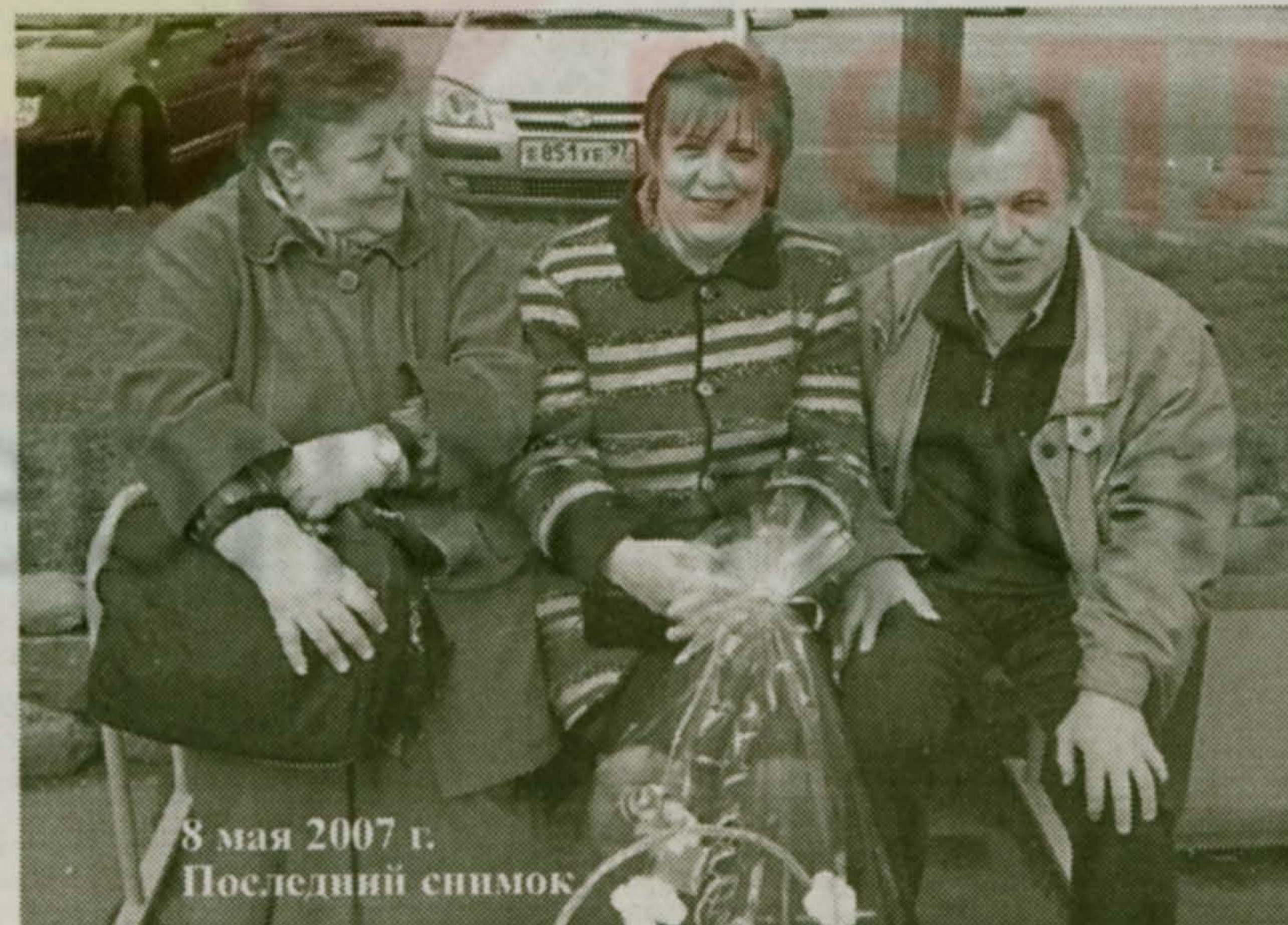
8 мая 2007 г. Последний снимок