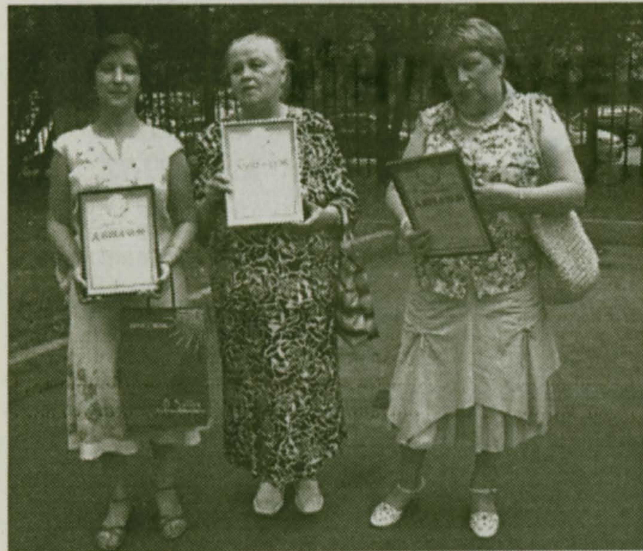
Лауреаты «Последней мили»