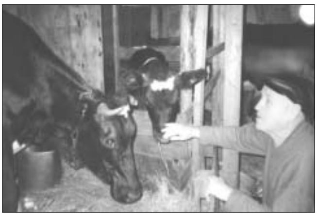
На снимке: фермер со своими питомцами Малышкой и Волгой.