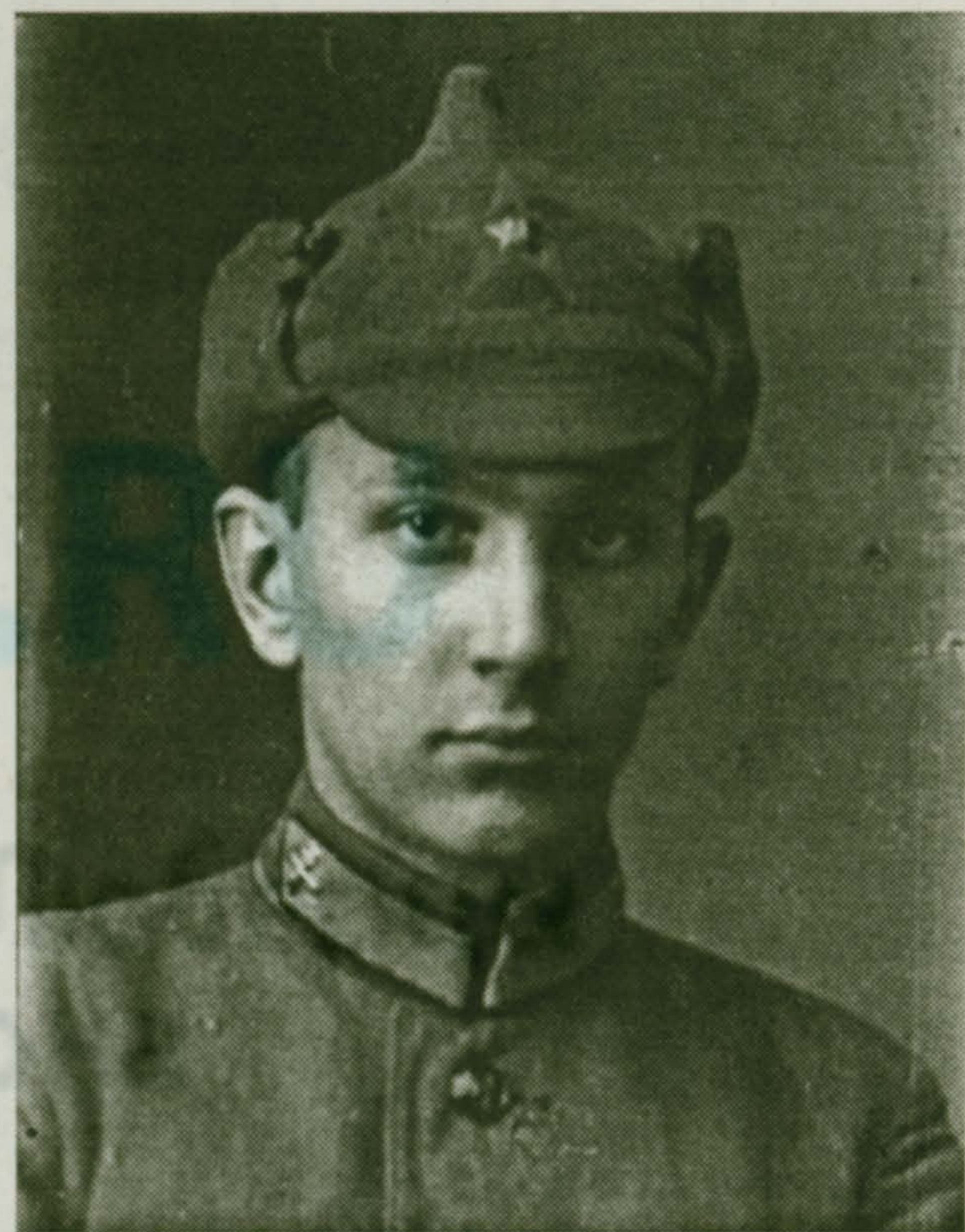
Материалы подготовлены Музеем истории и культуры поселка Малаховка по фондам музея и различным публикациям. (Продолжение следует)

Из радиопередачи, подготовленной Татьяной Лихоталь