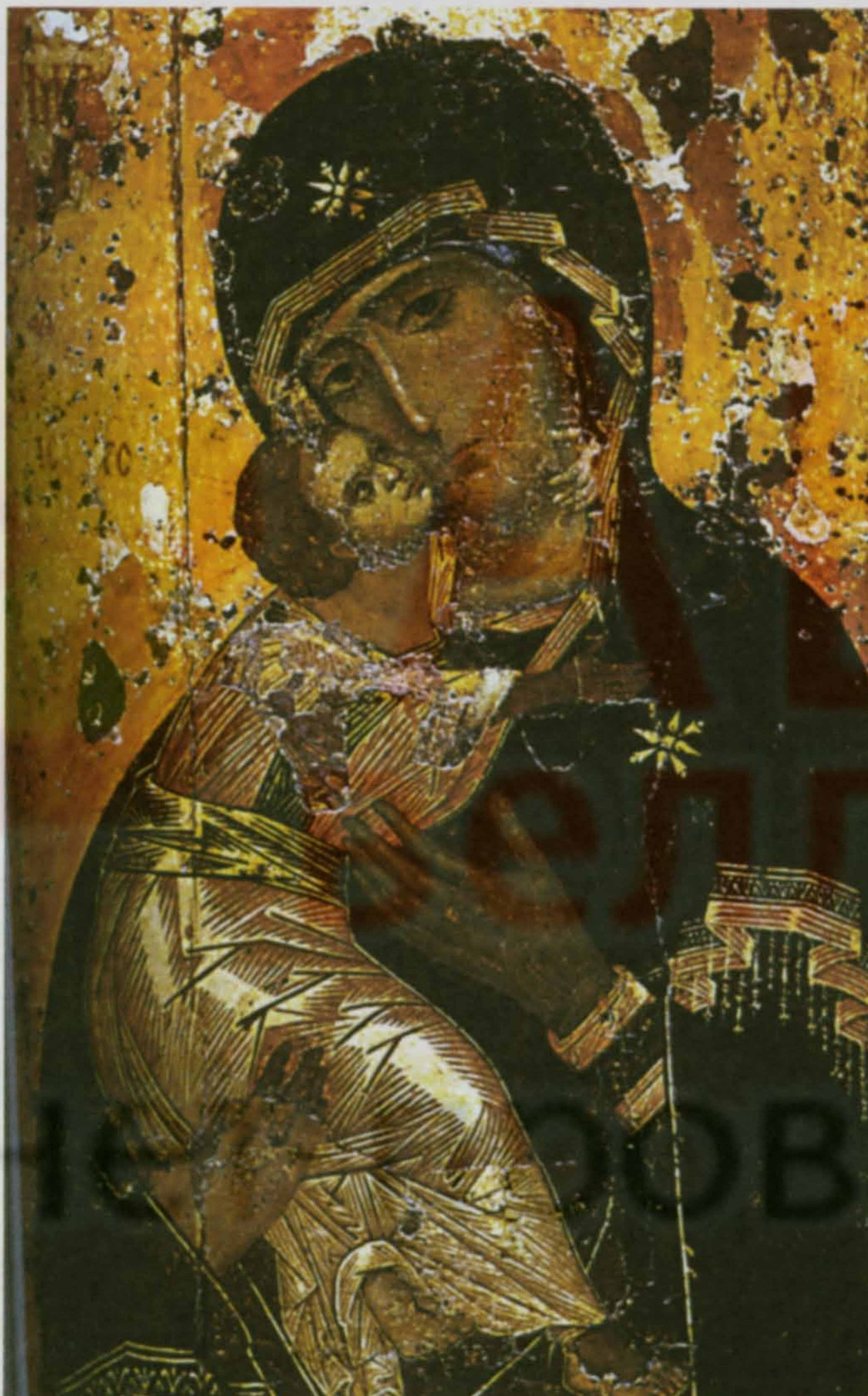
Богоматерь Владимирская не раз спасала Россию

Исход любой войны решают Дух народа и Божий промысел. В Великую Отечественную нам помогли воевать Святые Заступники земли русской – Богоматерь и Св.Георгий Победоносец.