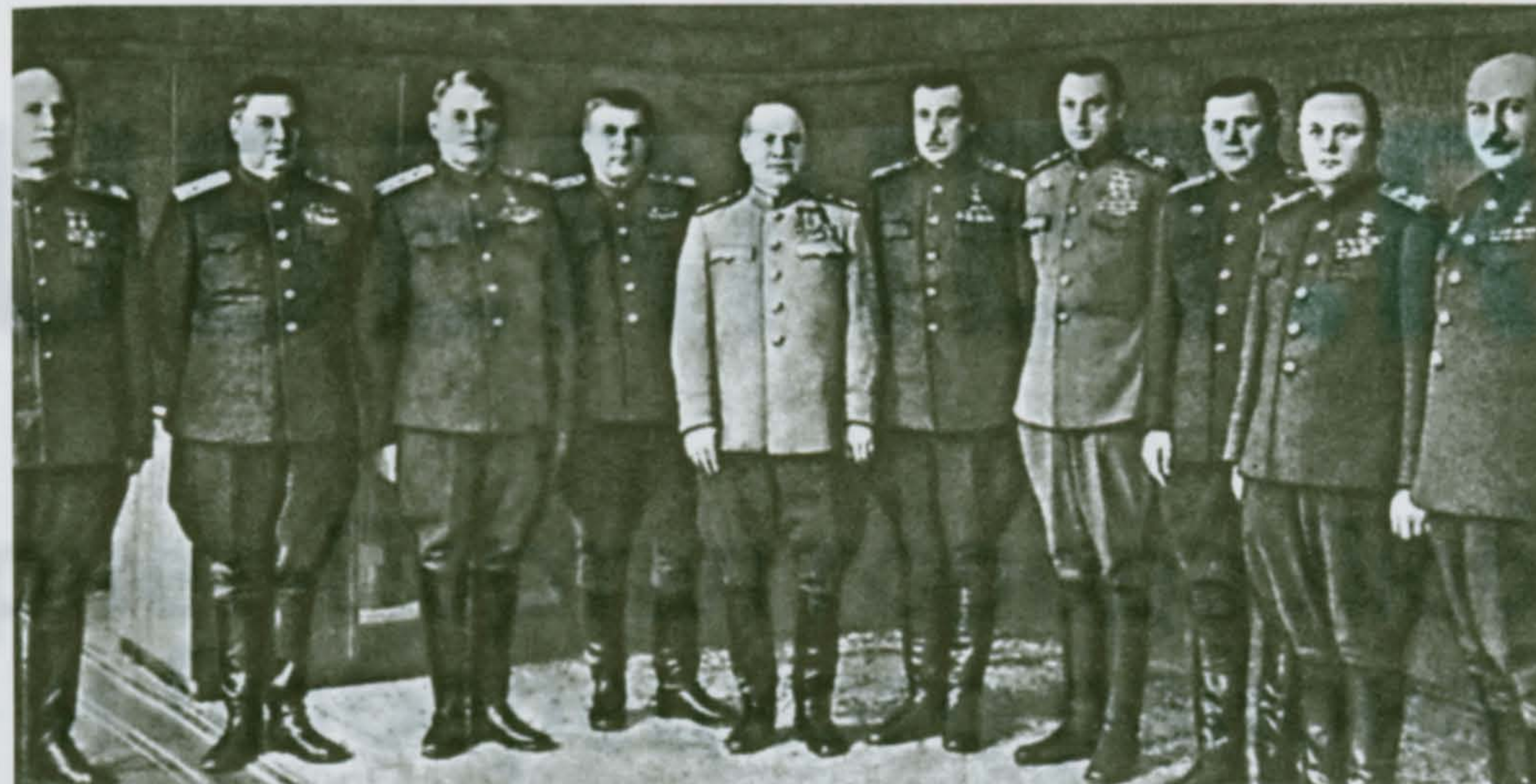
Командующие фронтами на заключительном этапе войны (слева направо): маршалы Советского Союза И.С.Конов, Ф.И.Толбухин, А.М.Василевский, Р.Я.Малиновский, Г.К.Жуков, Л.А.Говоров, К.К.Рокоссовский, А.И.Еременко, К.А.Мерецков, И.Х.Баграмян