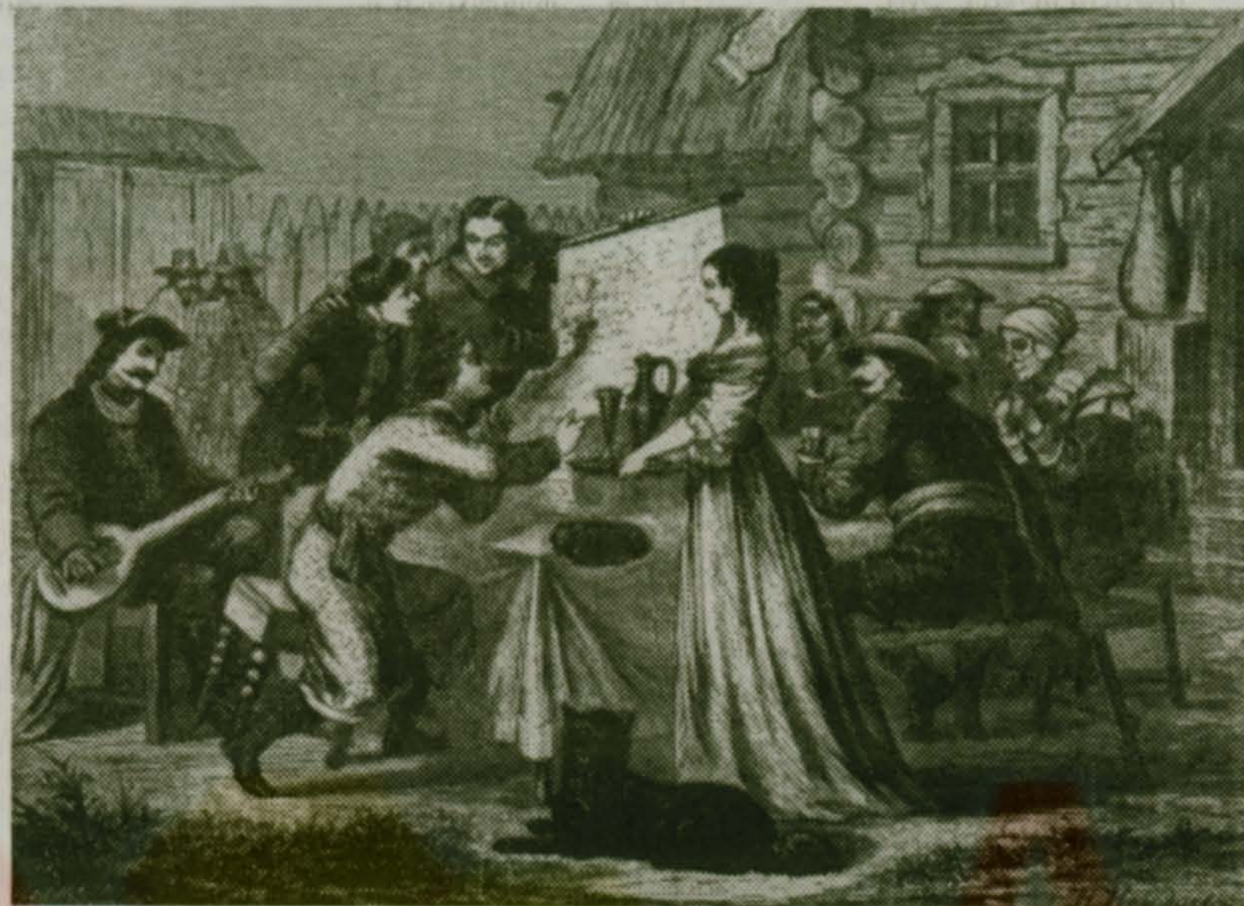
Петр I в гостях у Лефорта в Немецкой слободе