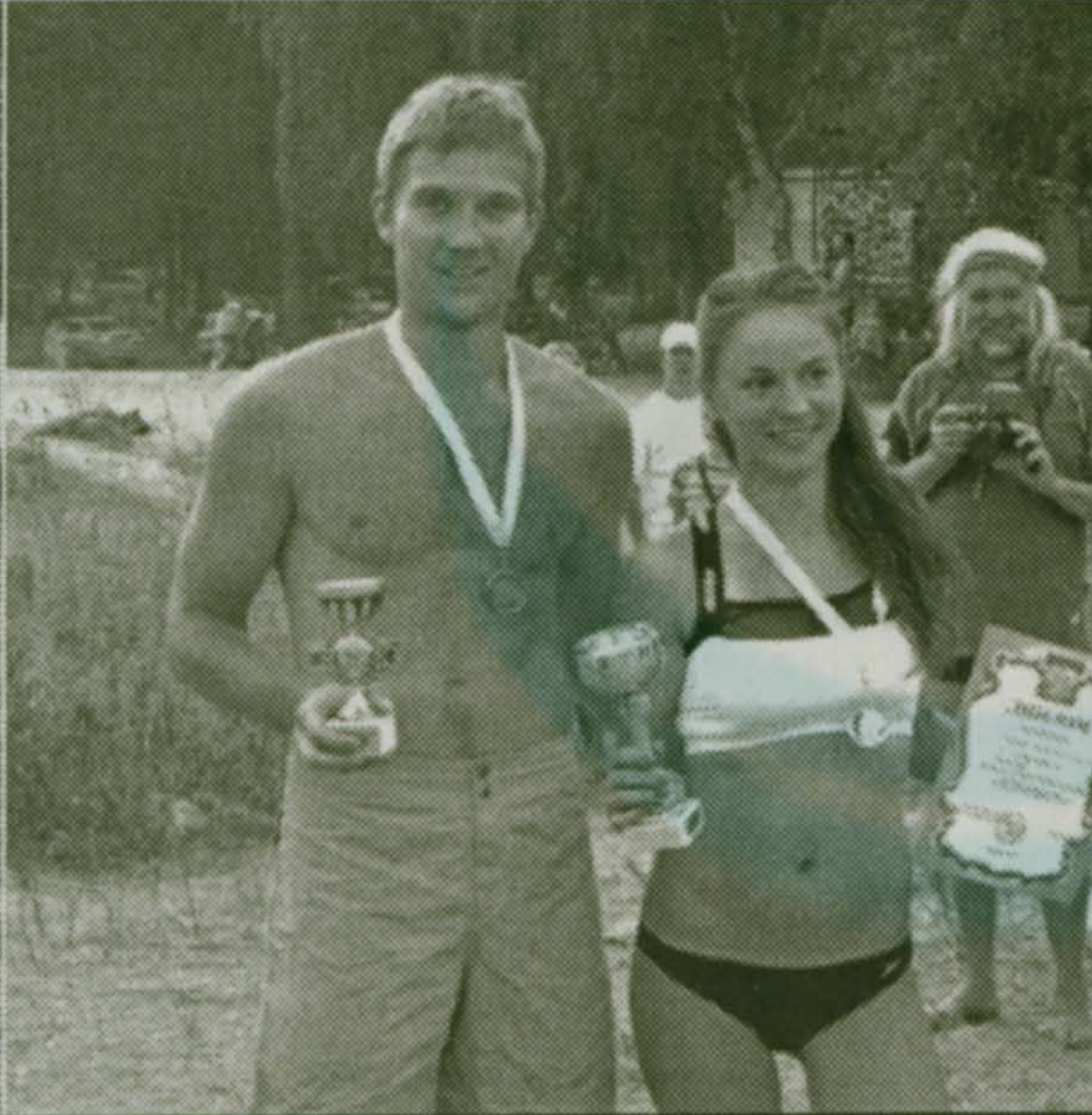
«Золотые» мальчики. «Серебро» высшей пробы