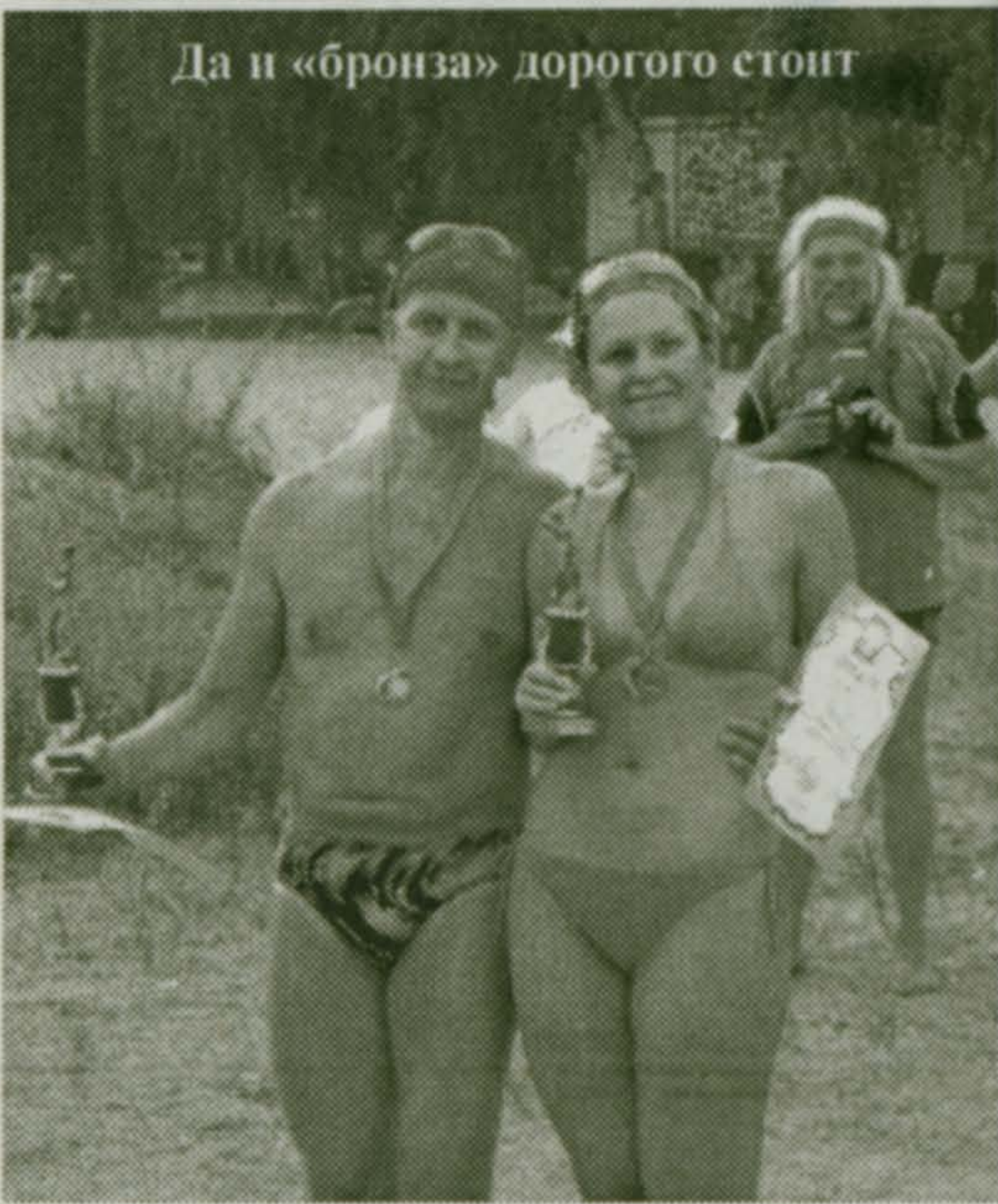
Да и «бронза» дорогого стоит