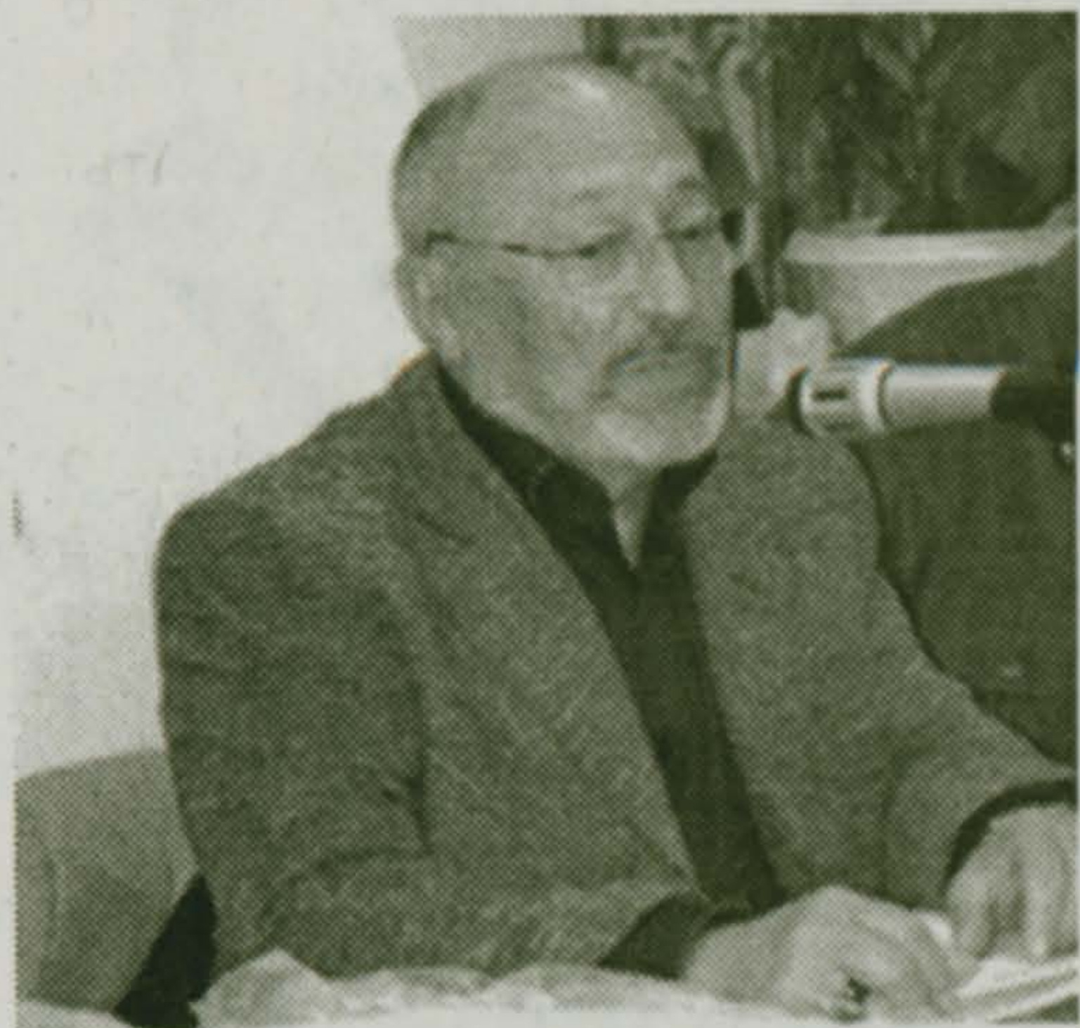
Лев Новоженев , известный телеведущий и журналист.