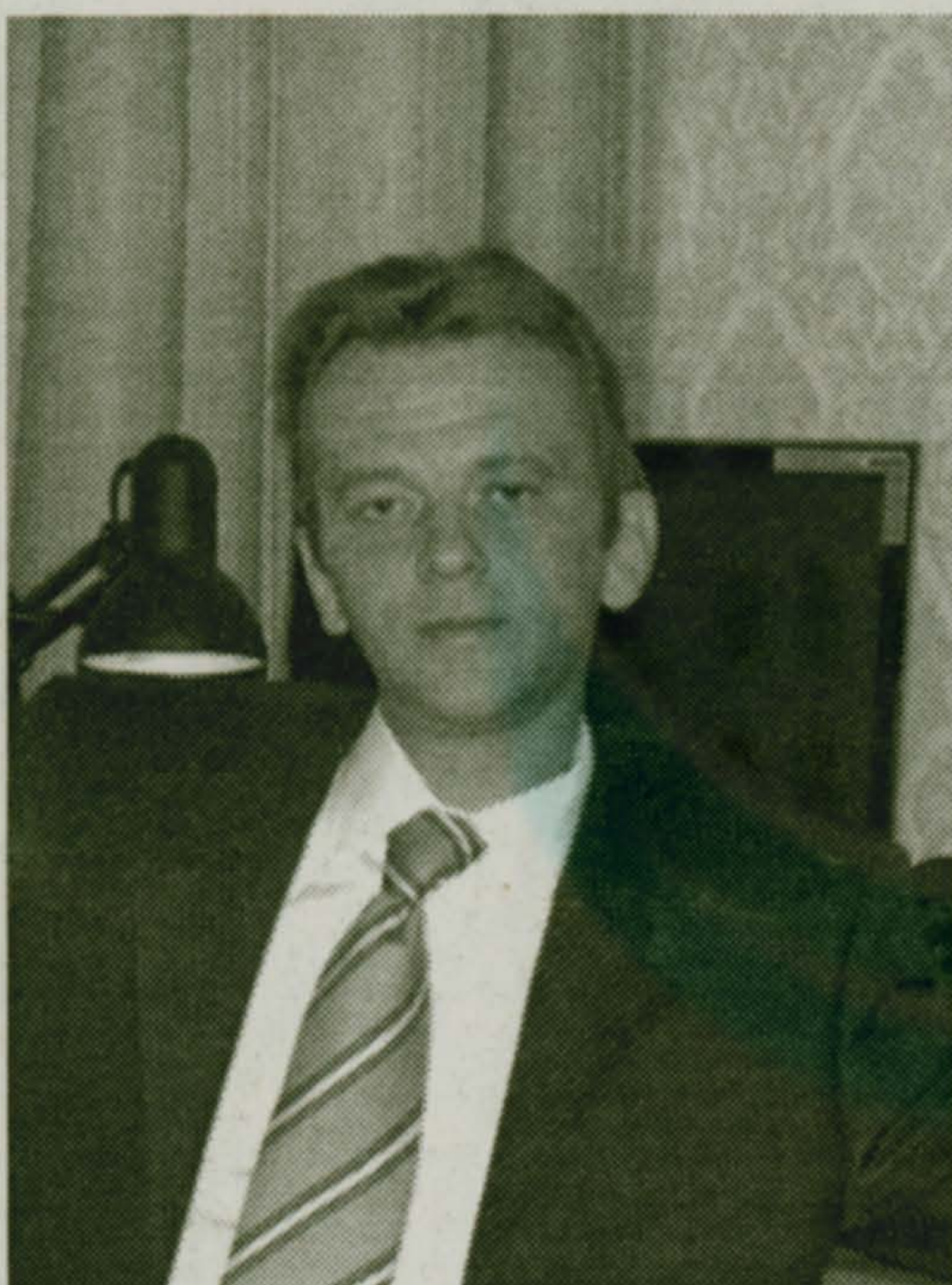
Публикуется бесплатно, согласно закону о выборах Московской области

Женат, воспитывает двоих сыновей в возрасте 15 и 13 лет. В настоящее время проживает в городском поселении Малаховка.