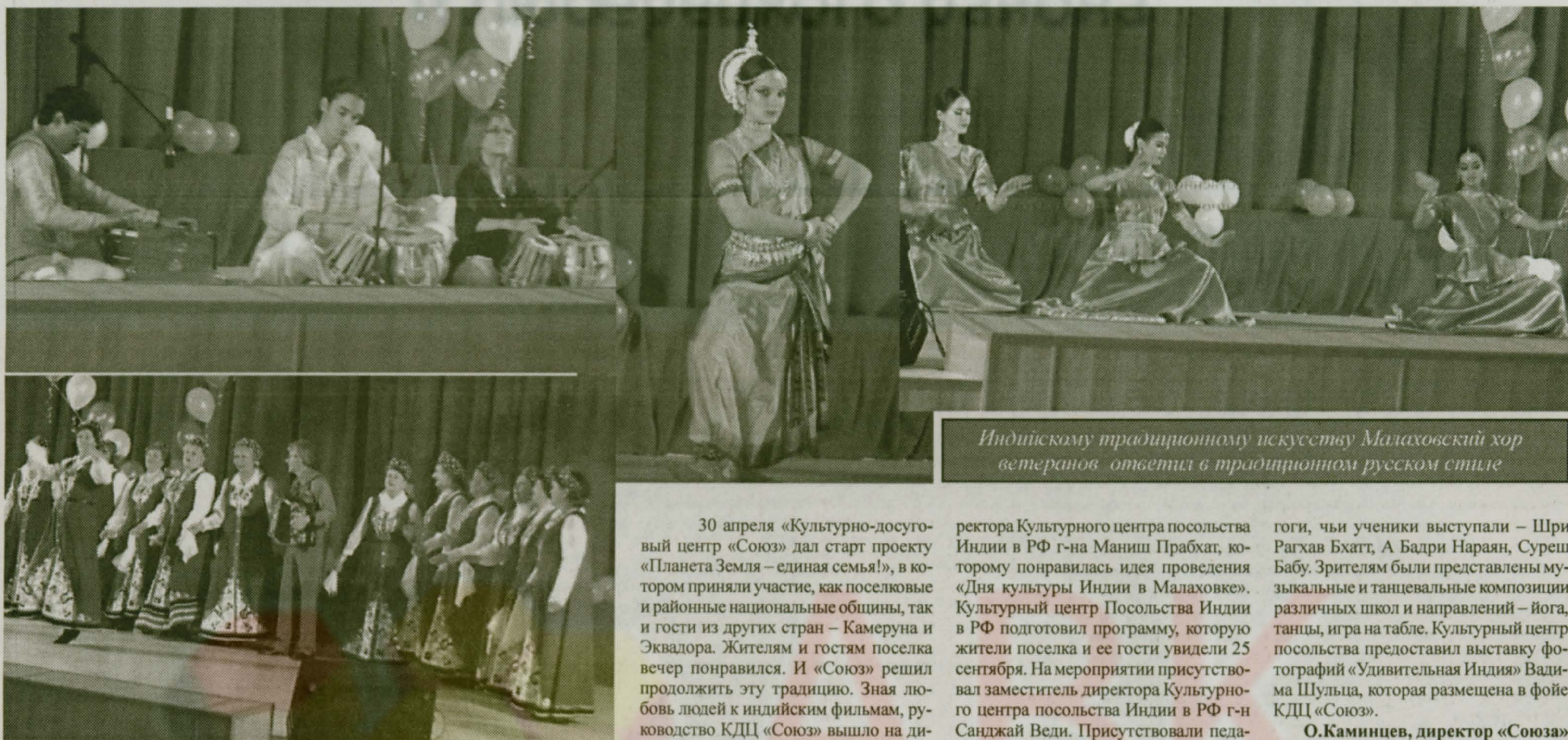
Индийскому традиционному искусству Малаховский хор ветеранов ответил в традиционном русском стиле

30 апреля «Культурно-досуговый центр «Союз» дал старт проекту «Планета Земля – единая семья!», в котором приняли участие, как поселковые и районные национальные общины, так и гости из других стран – Камеруна и Экватора. Жителям и гостям поселка вечер понравился. И «Союз» решил продолжить эту традицию. Зная любовь людей к индийским фильмам, руководство КДЦ «Союз» вышло на ди-