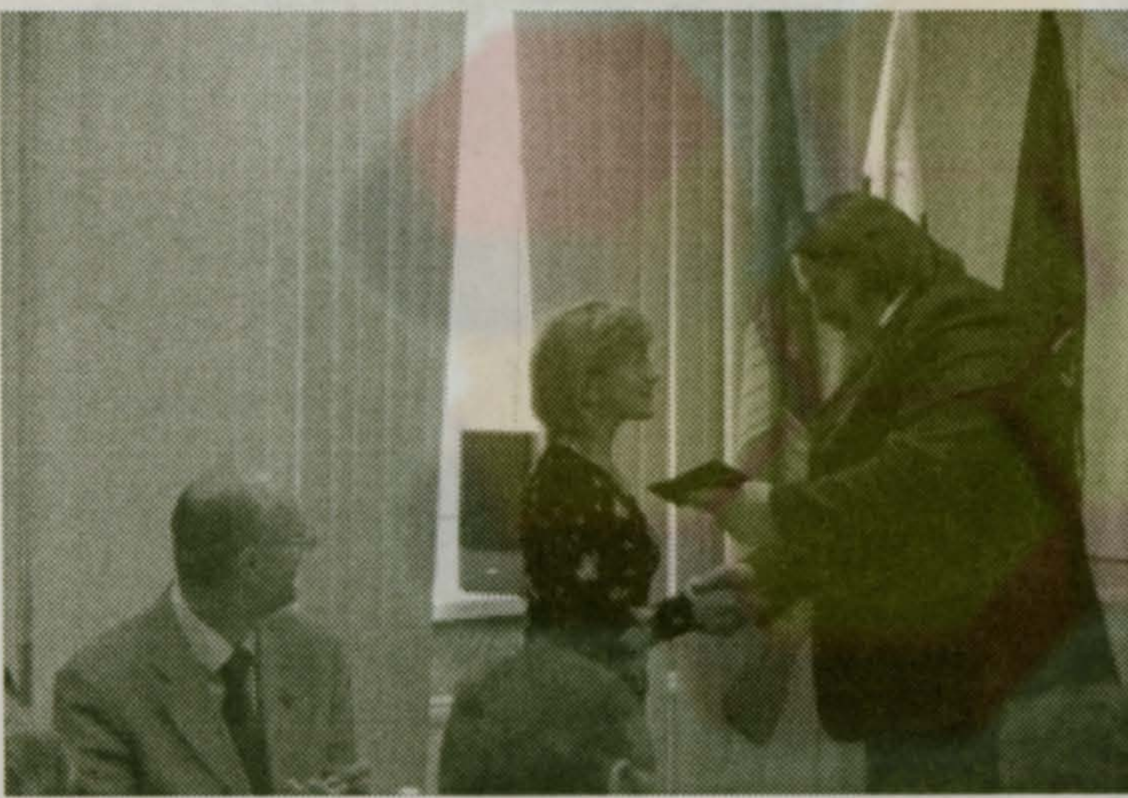
Вручение удостоверений новым членам депутатского корпуса