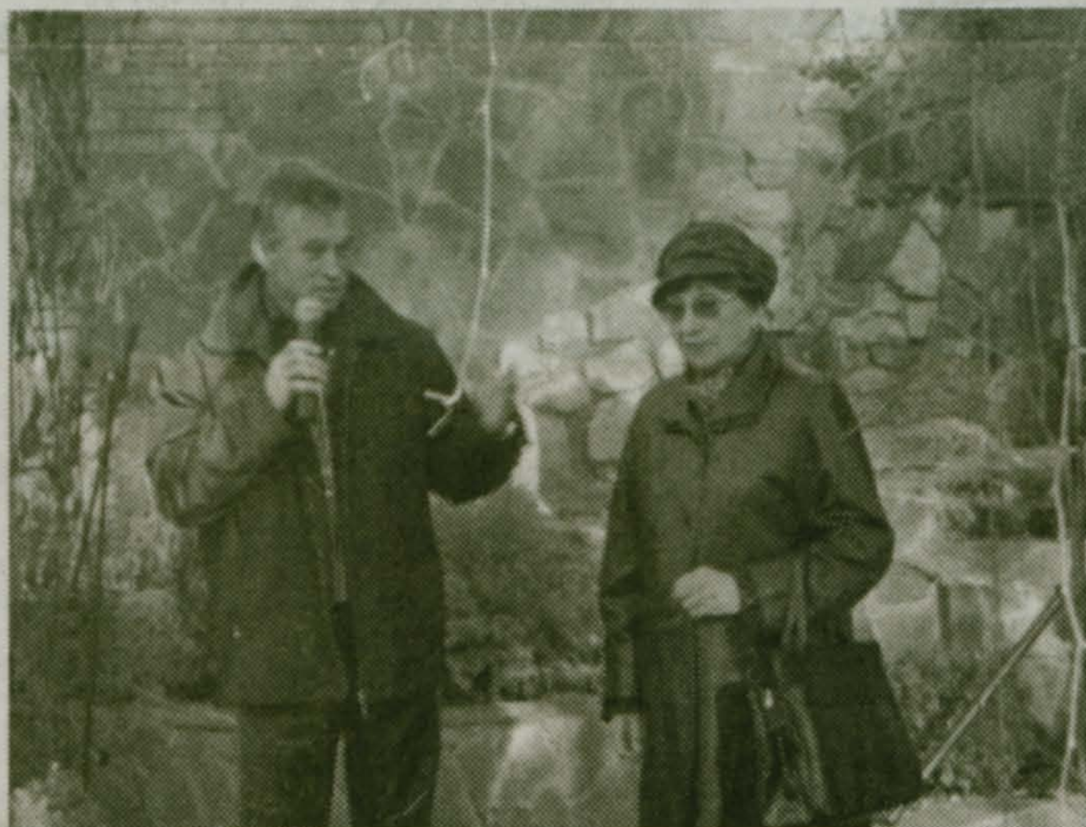
(Подробнее об этой студии мы еще расскажем – она того стоит!)