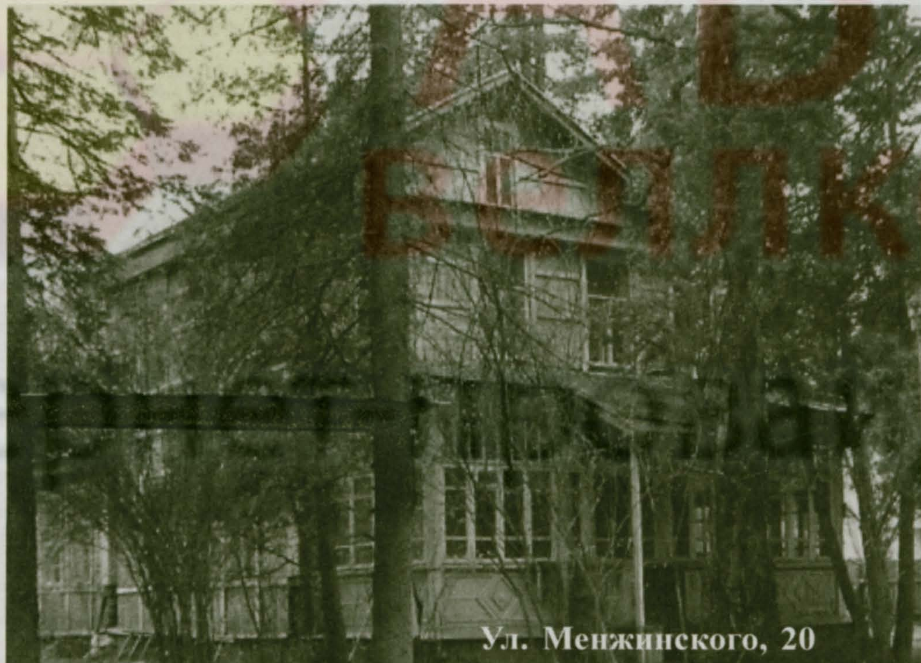
Ул. Менжинского, 20

P.S. На самом деле убийцу Троцкого звали Рамон Меркадер (Ред.)