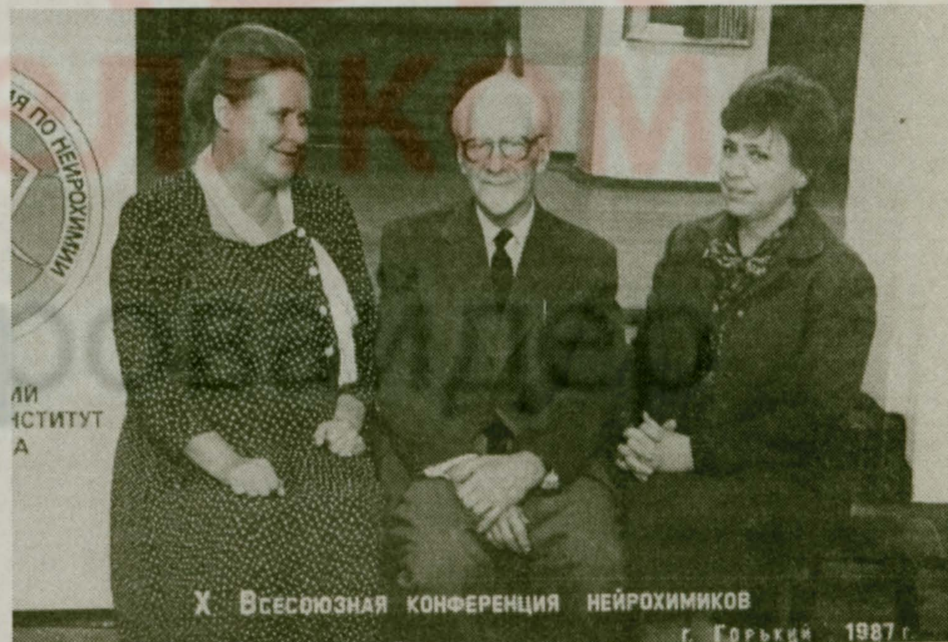
Х. Всесоюзная конференция нейрохимиков