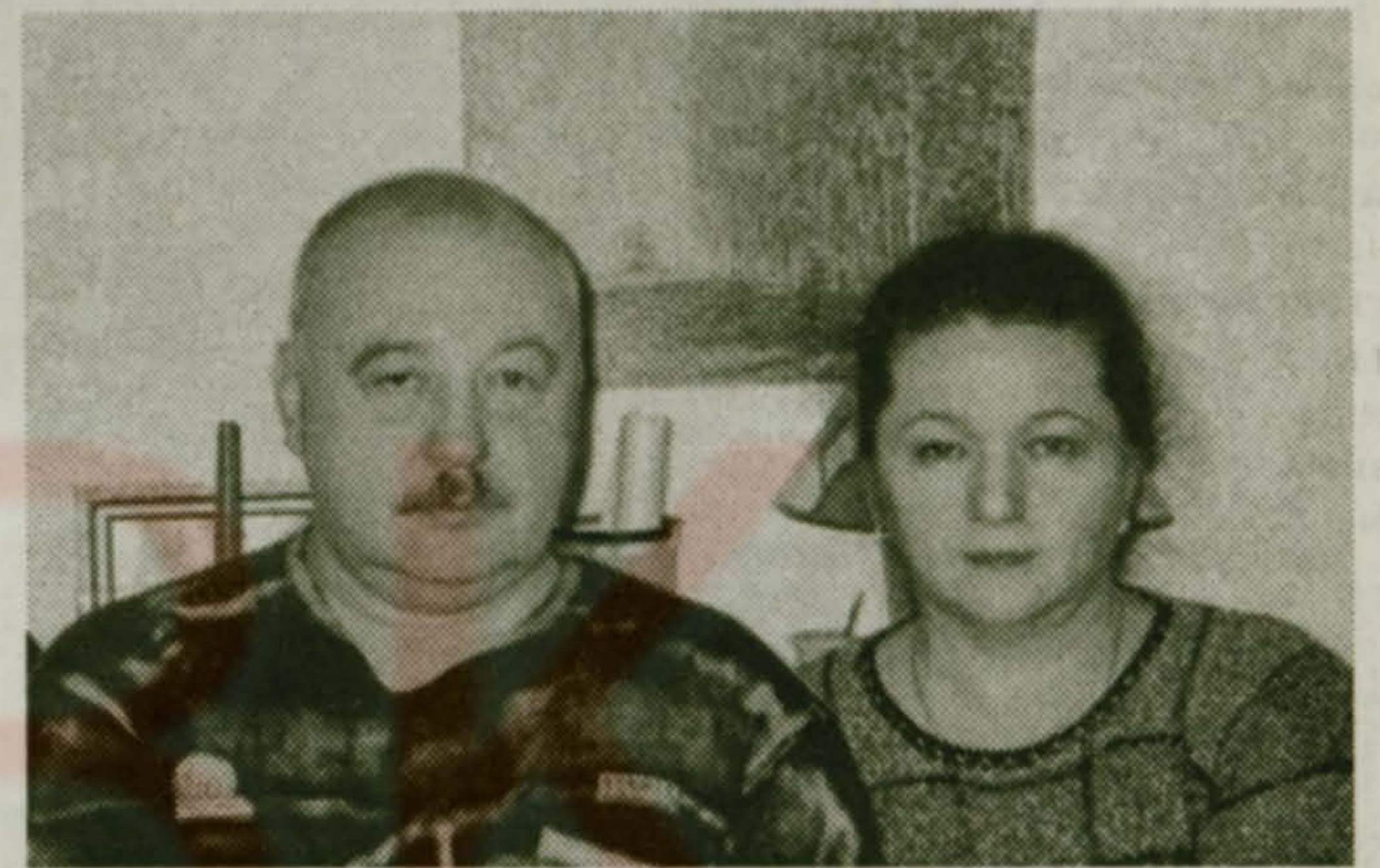
Дети и внук

Пусть принесет радость дни, И судьба не пожалеет Счастья, смеха и любви! Пусть сбываются надежды, Пусть на все хватает сил, Чтобы каждый день успешным, Ярким и красивым был!