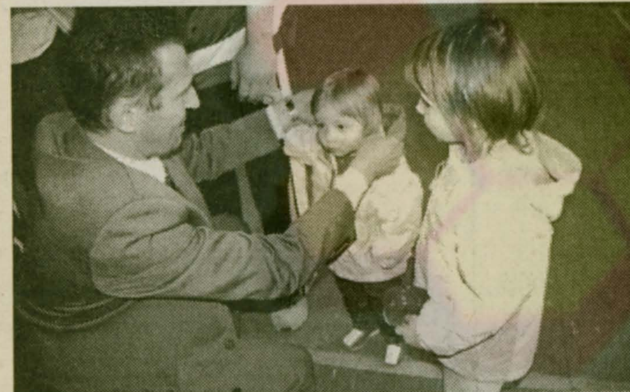
Понеси-ка папину медаль, пока не заработаешь свою

И вот настала главная игра турнира – поединок гигантов за 1-е место, где команде МГАФК противостояла крепкая команда «Мастера». Последней, кстати, многие наблюдатели и прочили победу в турнире. И сами мастера из «Мастера» вышли на поле с надеждой на победу. Но – недооценили противника (видно, расслабившись от прошлых побед). Игра была по-настоящему напряженной, застав-