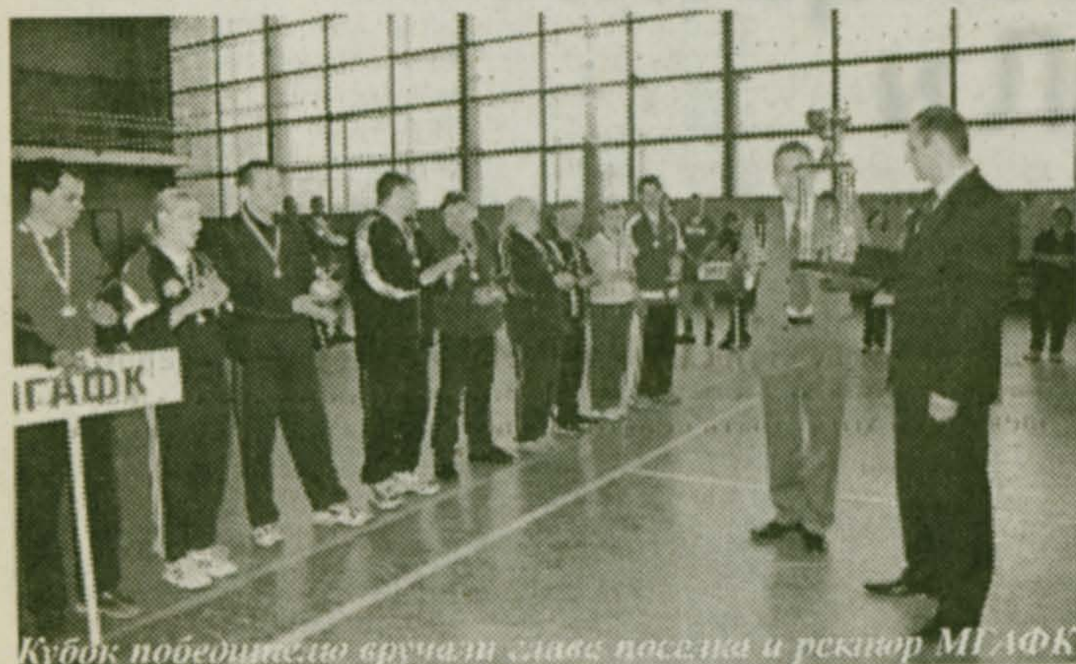
Кубок победителя вручат глава поселка и ректор МГАФК

В полуфинале Школа № 47 проиграла МГАФКу, а Школа № 52 – Мастеру. Обе встречи были по-своему интересными, но – вполне предсказуемыми. Все болельщики ждали финала.