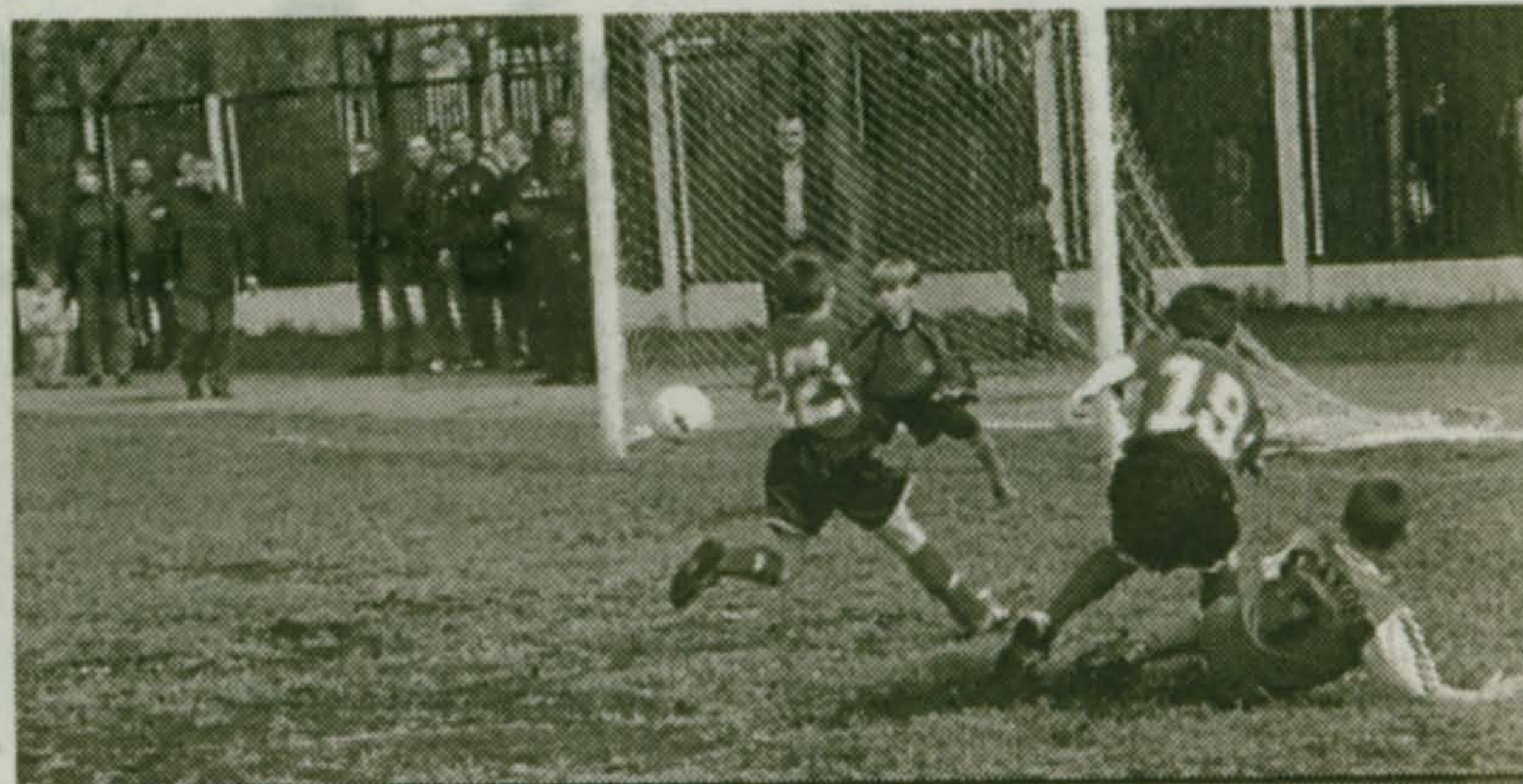
29 мая в полдень на стадионе «Труд» - очередной турнир с участием «Надежды». Следите за нашими объявлениями и - приходите болеть за наших ребят.