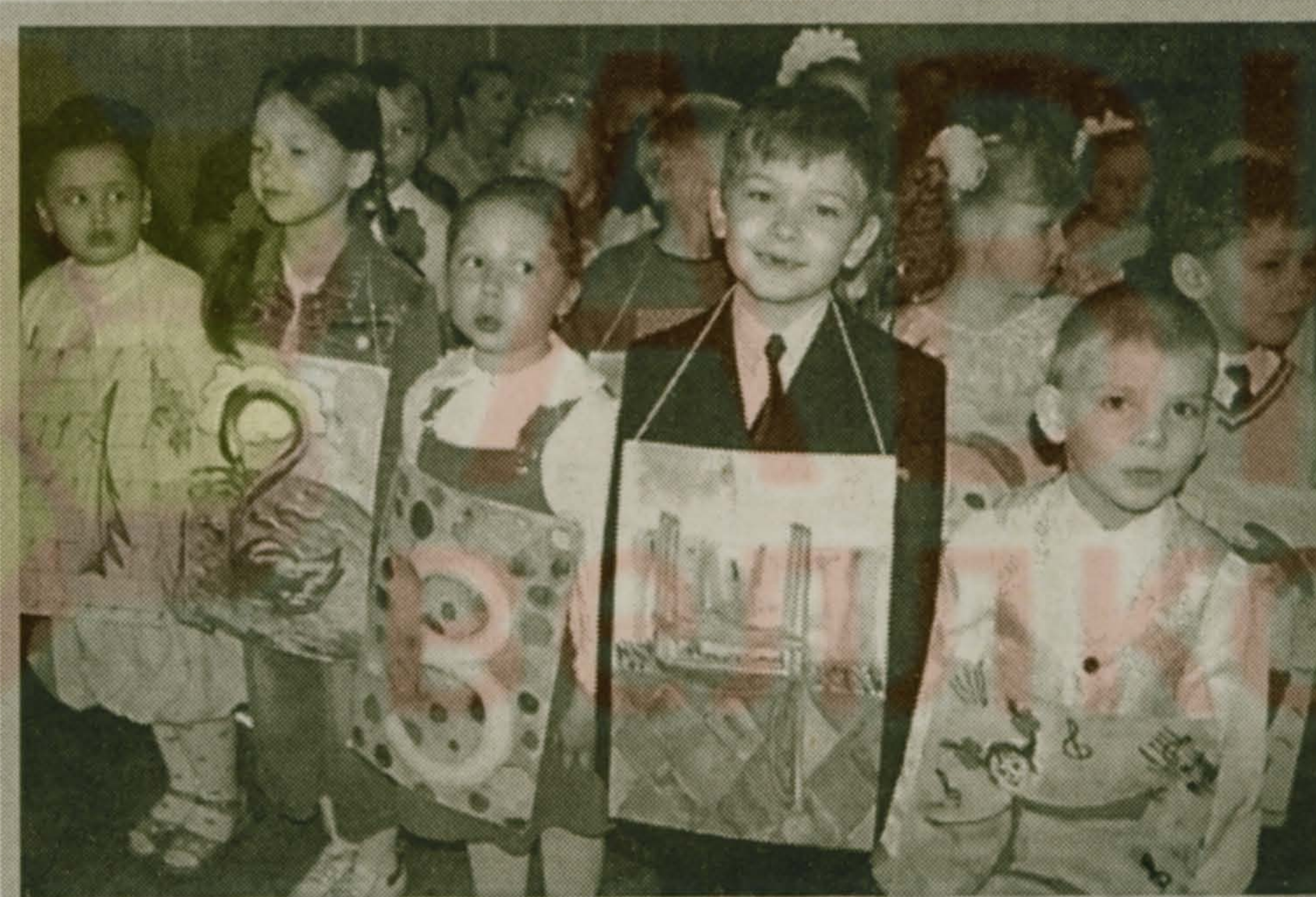
А незадолго перед тем состоялся выпускной утренник «нулевого» подготовительного класса «Сказки». Репортаж об этом событии - на стр.3.