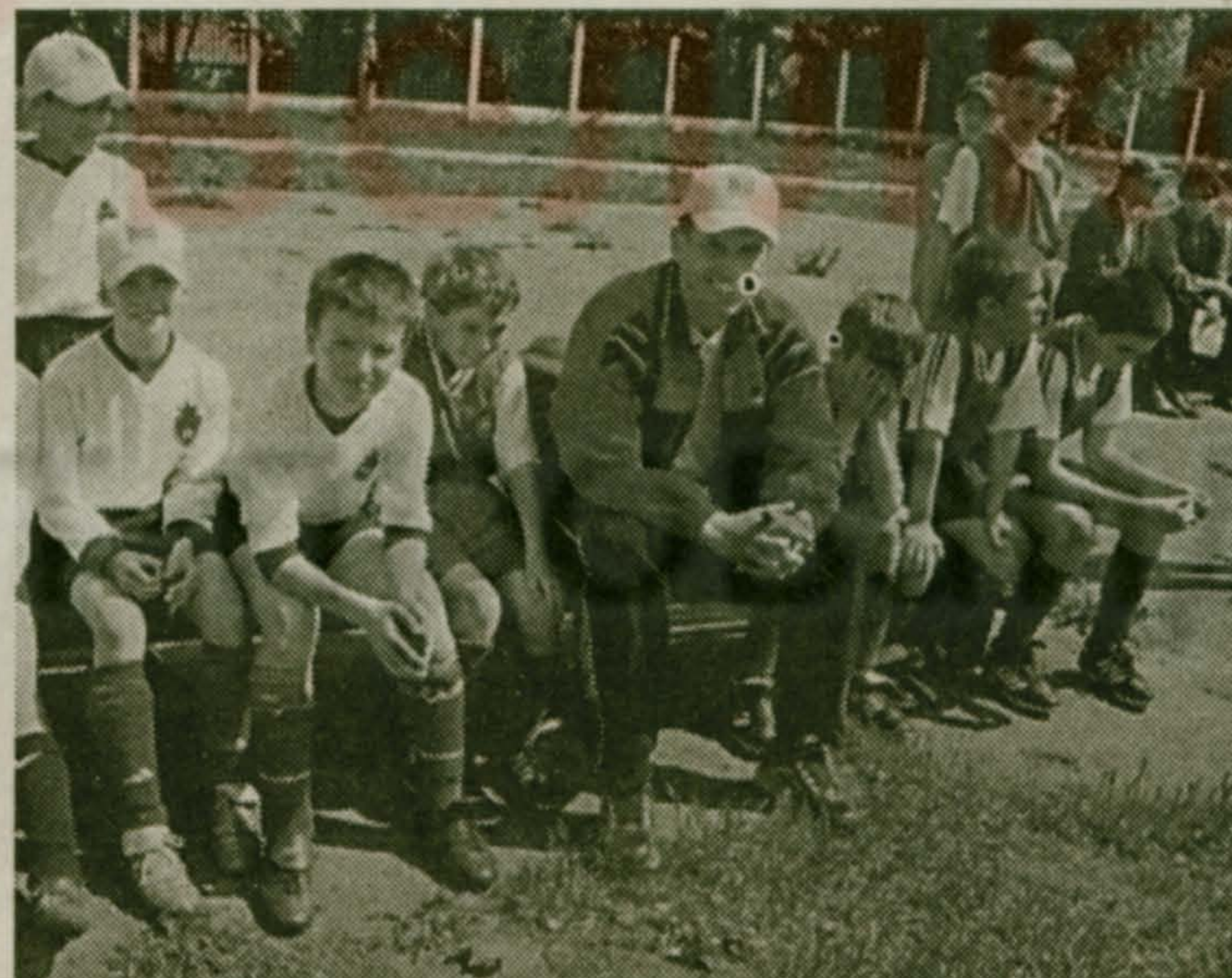
Материал на стр. 3