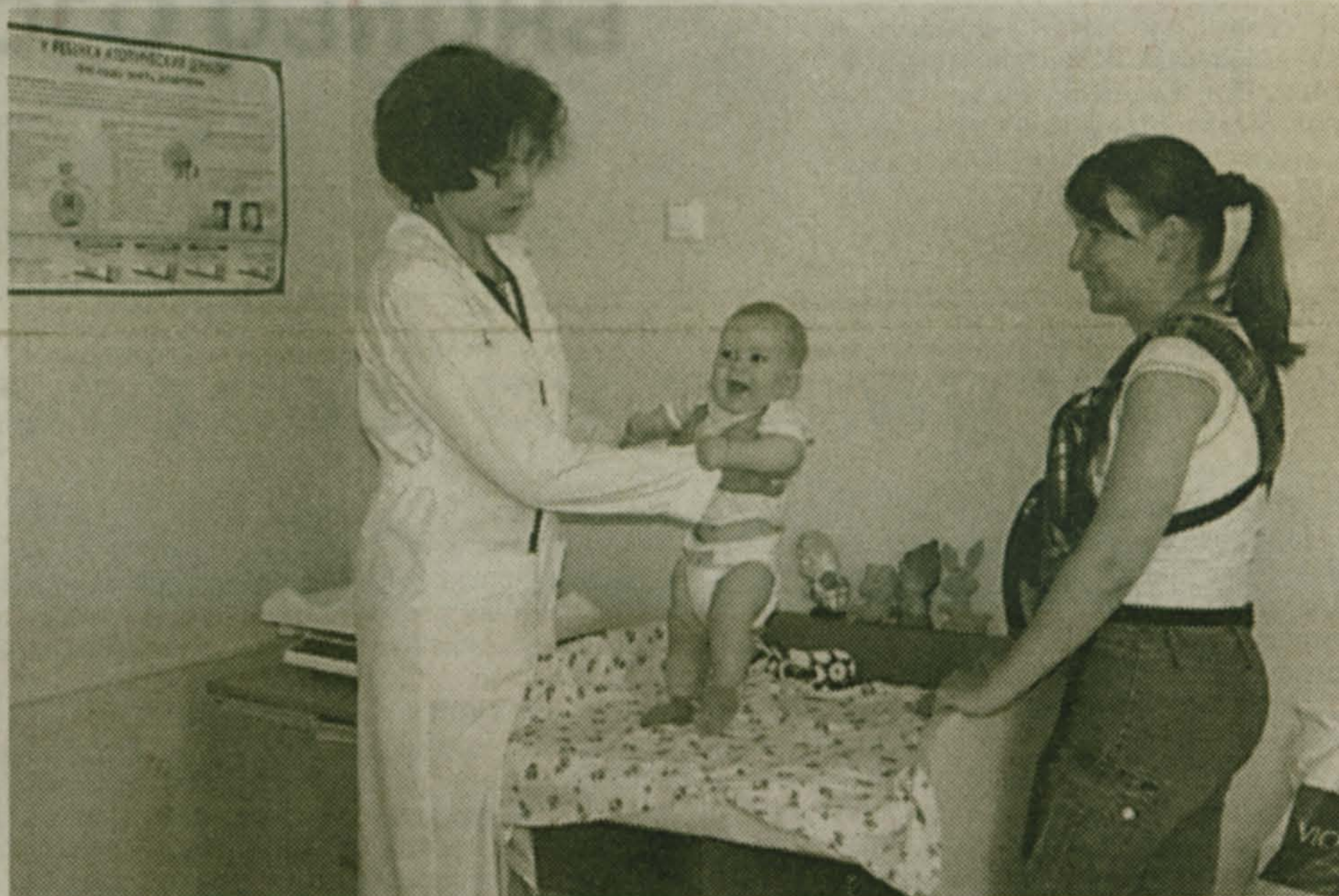
трудники отделения. А также родители, дети которых лечились или лечатся здесь. И многие молодые родители (или, напротив, бабушки маленьких пациентов), особенно те, кто мог сравнить с прошлыми годами, не могли сдержать слов благодарности на этой стихийной «презентации» в адрес медиков, строителей и поселковой администрации.

Детское население Малаховки по статистике составляет 4531 человек (от самых маленьких до школьников-старшеклассников). Почти 1/5 жителей поселка. И рождаемость, судя по всему, увеличивается. На первую половину этого года почти вдвое в сравнении с тем же периодом прошлого. Кажется, Россия проходит пик неблагоприятия в этом отношении. И Малаховка в том числе. Дай-то Бог!