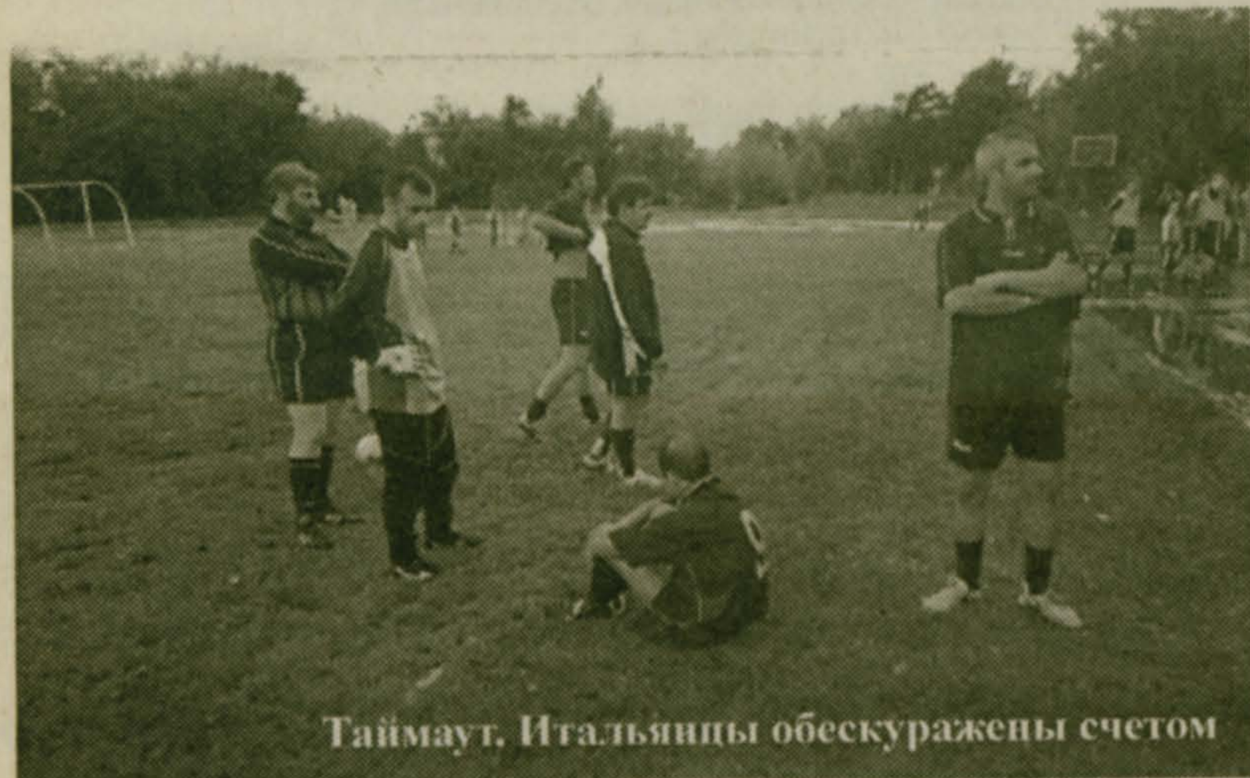
Таймаут. Итальянцы обескуражены счетом