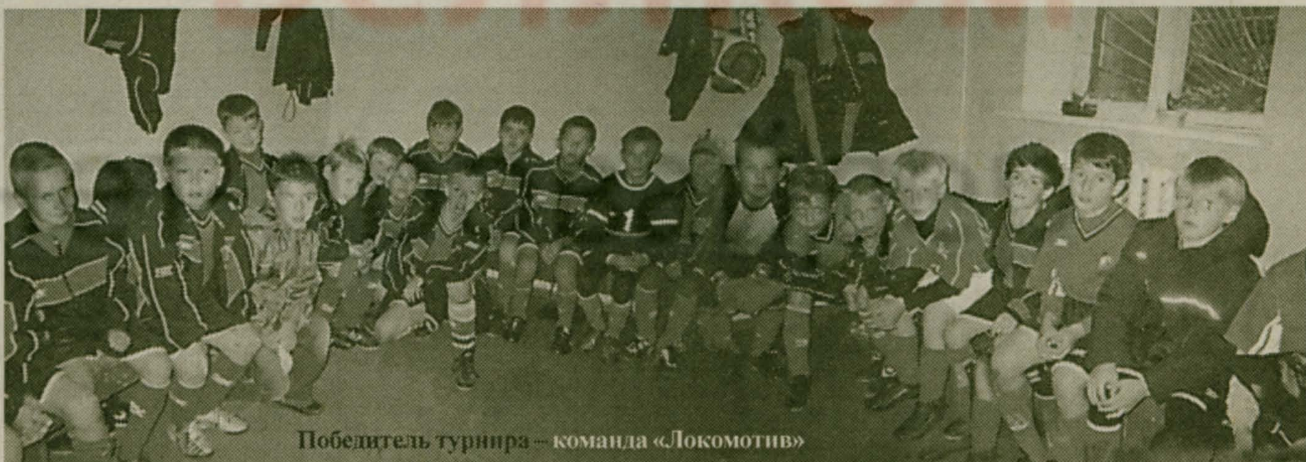
Победитель турнира – команда «Локомотив»