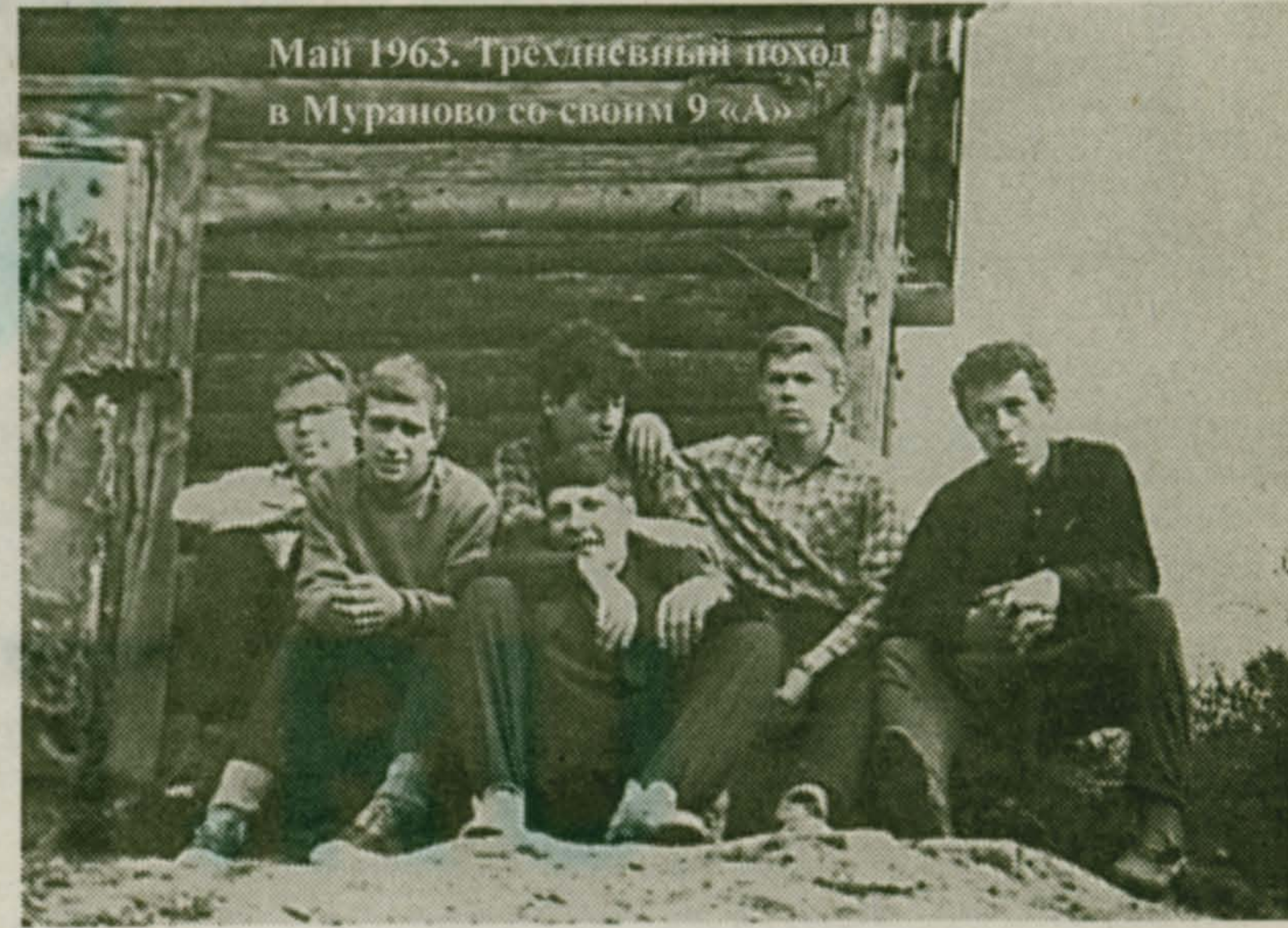
Май 1963. Трехдневный поход в Мураново со своим 9 «А»