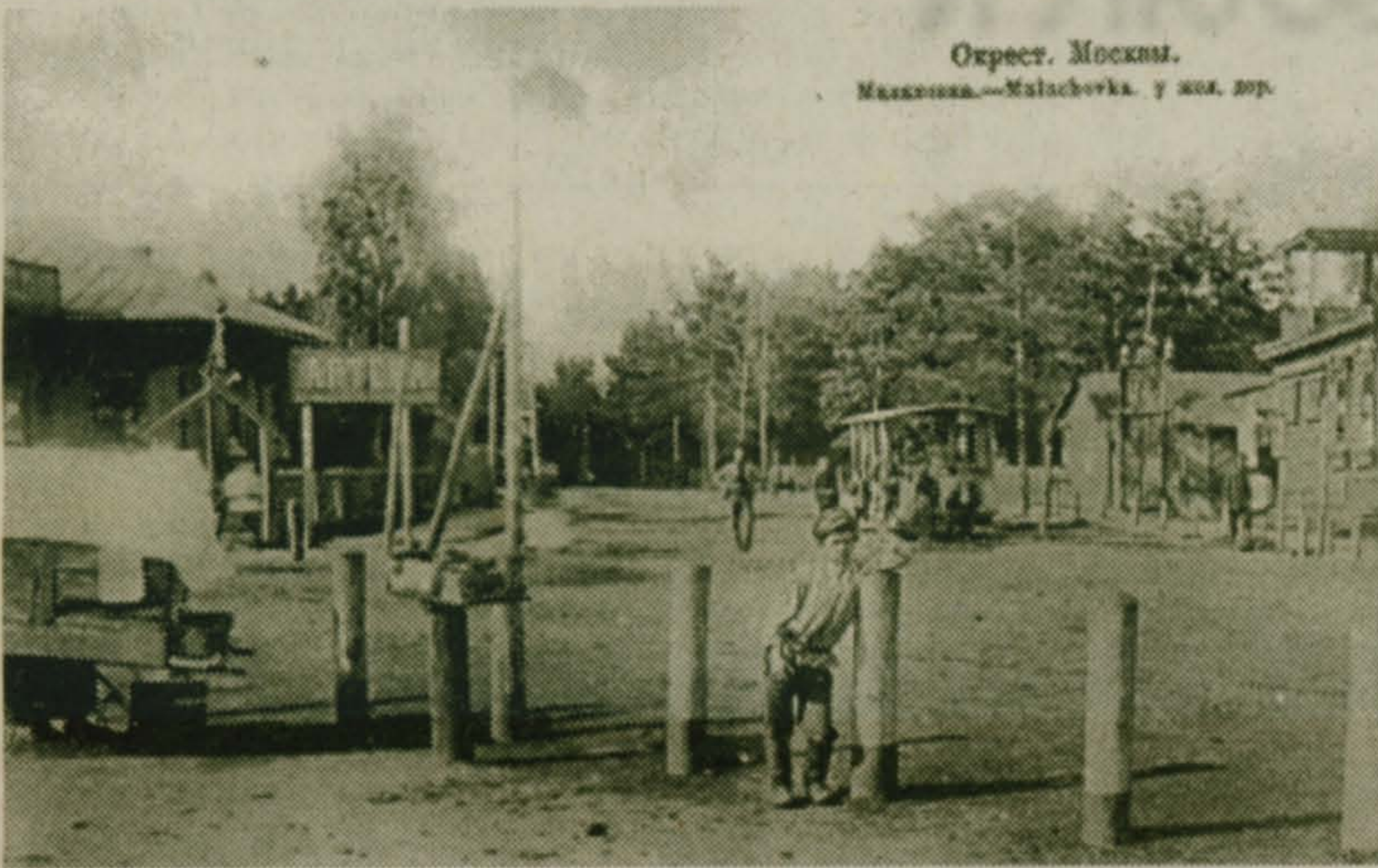
Окрест. Москвы. Малаховка — Малаховка. у хол. зор.