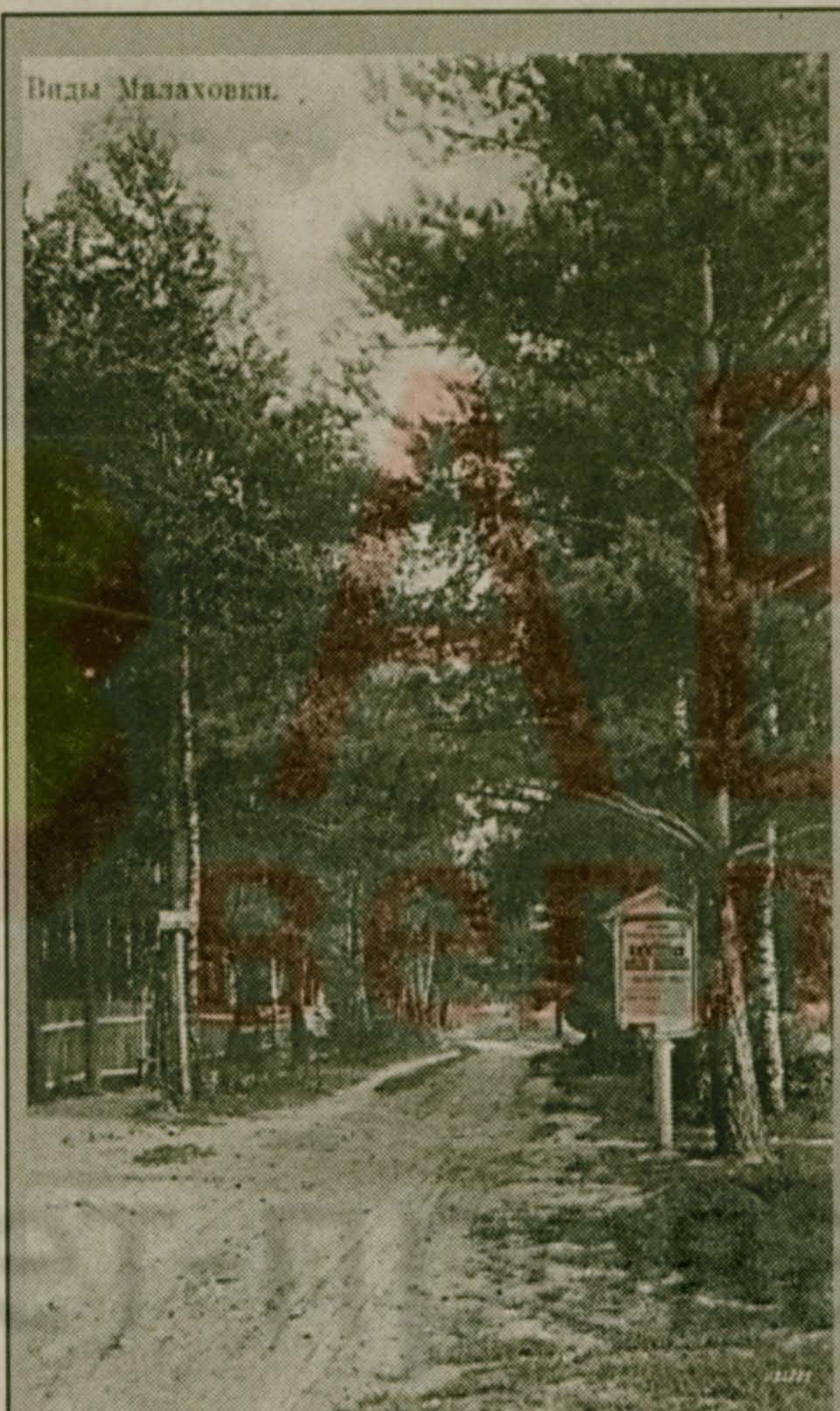
Телешовское шоссе – так называлась 100 лет назад улица Шоссейная. И вот такой вид она имела. Материал об ушедших малаховских реалиях – на стр. 2.