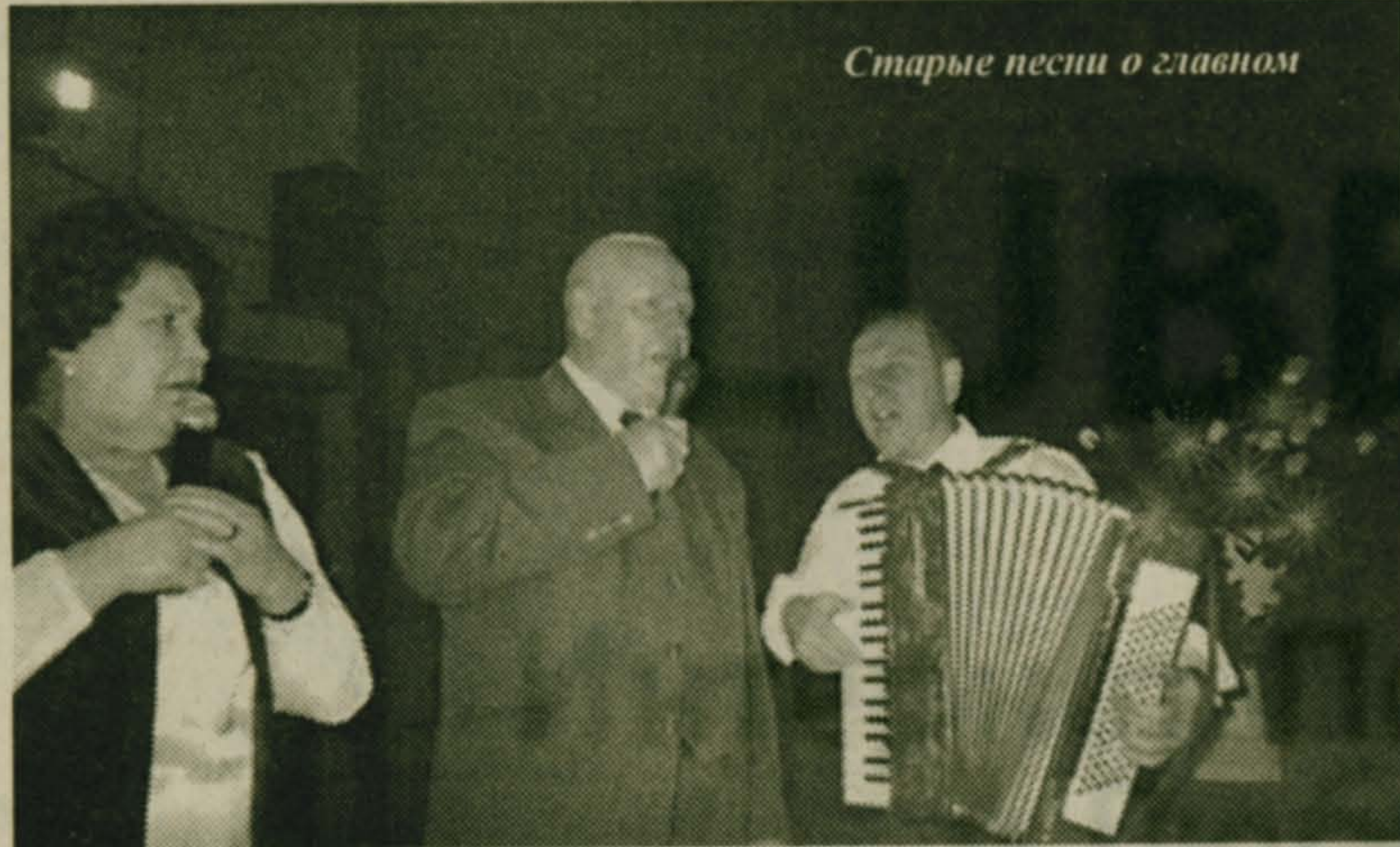
Старые песни о главном