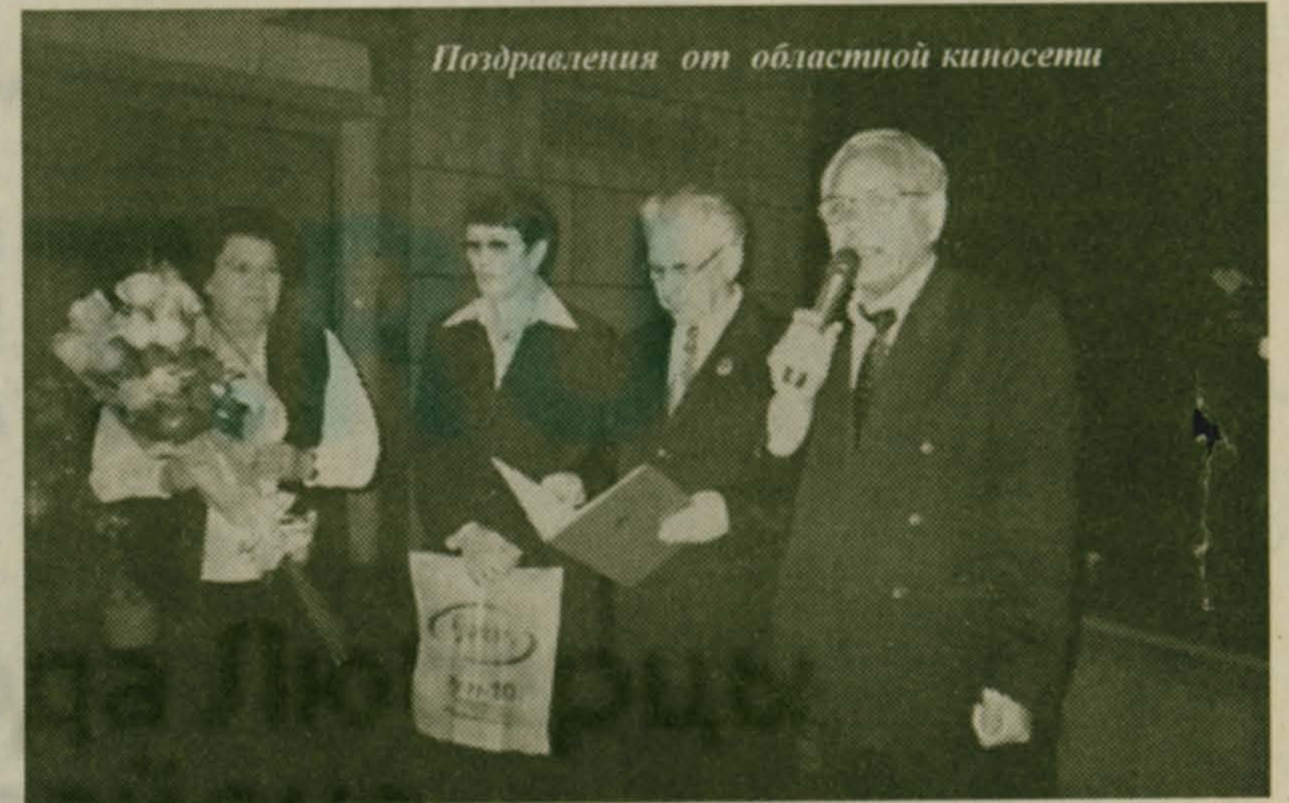
Поздравления от областной киносети