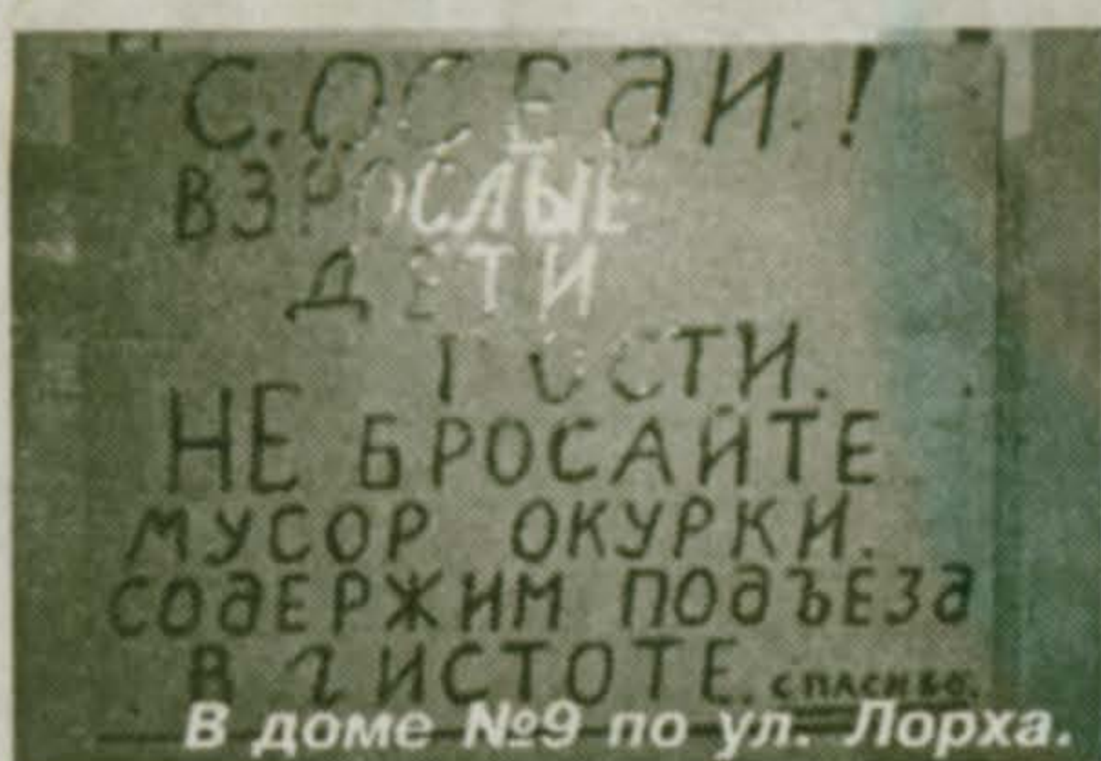
Соседи! Взрослые! Дети! Гости! Не бросайте мусор и окурки в лифтовые коллекторы! В доме №9 по ул. Лорха.

реди стоит тот самый знаменитый «красавец», д. 2/1 на улице Школьная, которому еще и 10 лет не исполнилось. В нем, как сообщил газете В.В.Жабин, главный инженер МУП «ЖКХиБ», подъезды вообще никуда не годны. Да и как им быть в порядке, если за все эти годы ремонт здесь не производили ни разу. Как не делали его и в домах, построенных в 70-80-е годы, а им, как нетрудно догадаться, по четверти века.