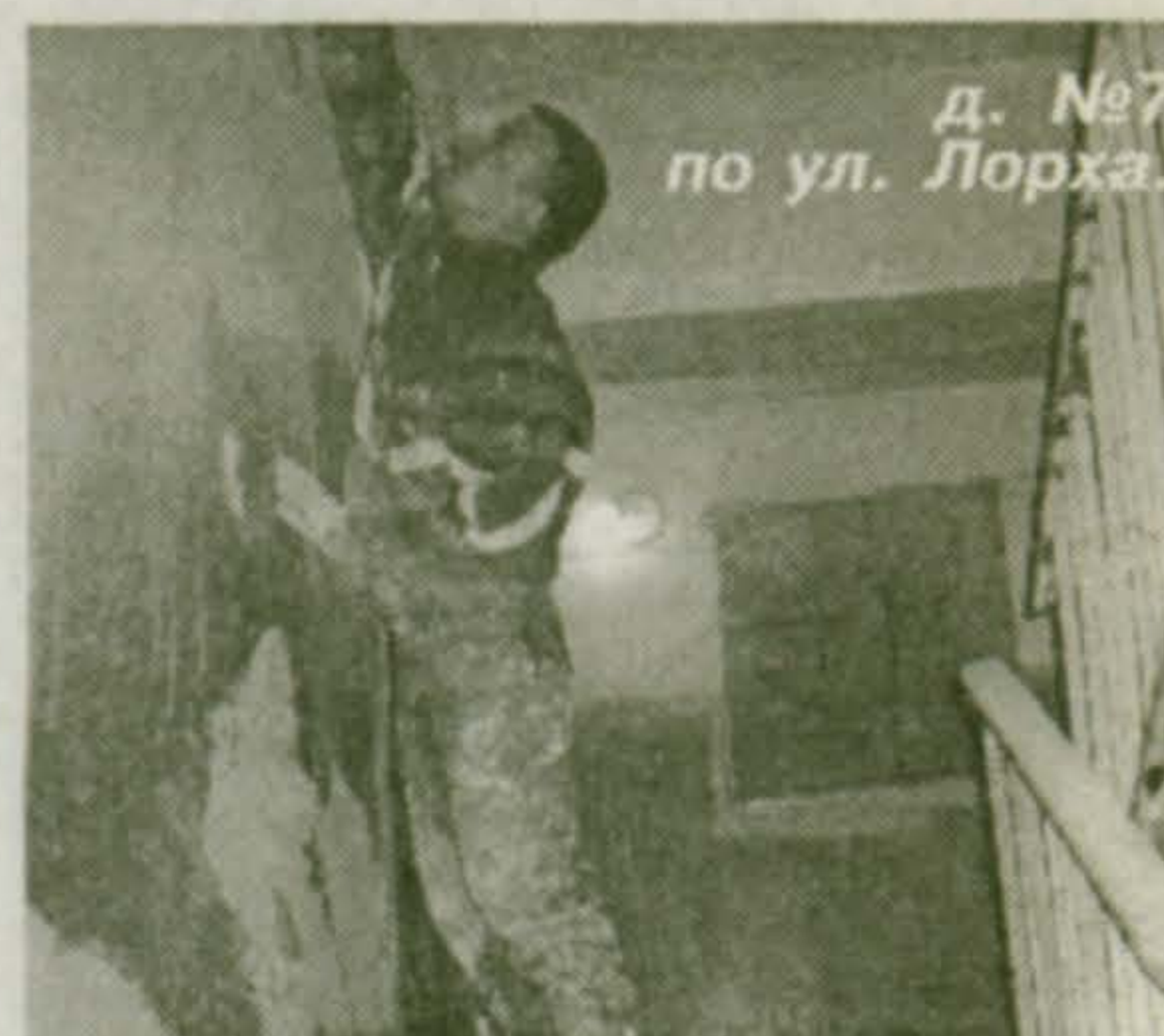
д. №7 по ул. Лорха.