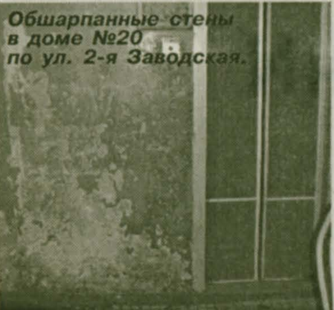
Обшарпанные стены в доме №20 по ул. 2-я Заводская.

Постановление от 27 сентября 2003 г. N 170 «Об утверждении правил и норм технической эксплуатации жилищного фонда», пункт 3.2.9.