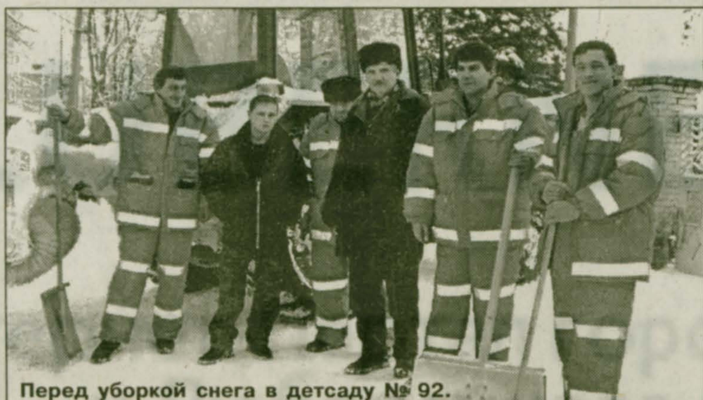
Перед уборкой снега в детсаду № 92.