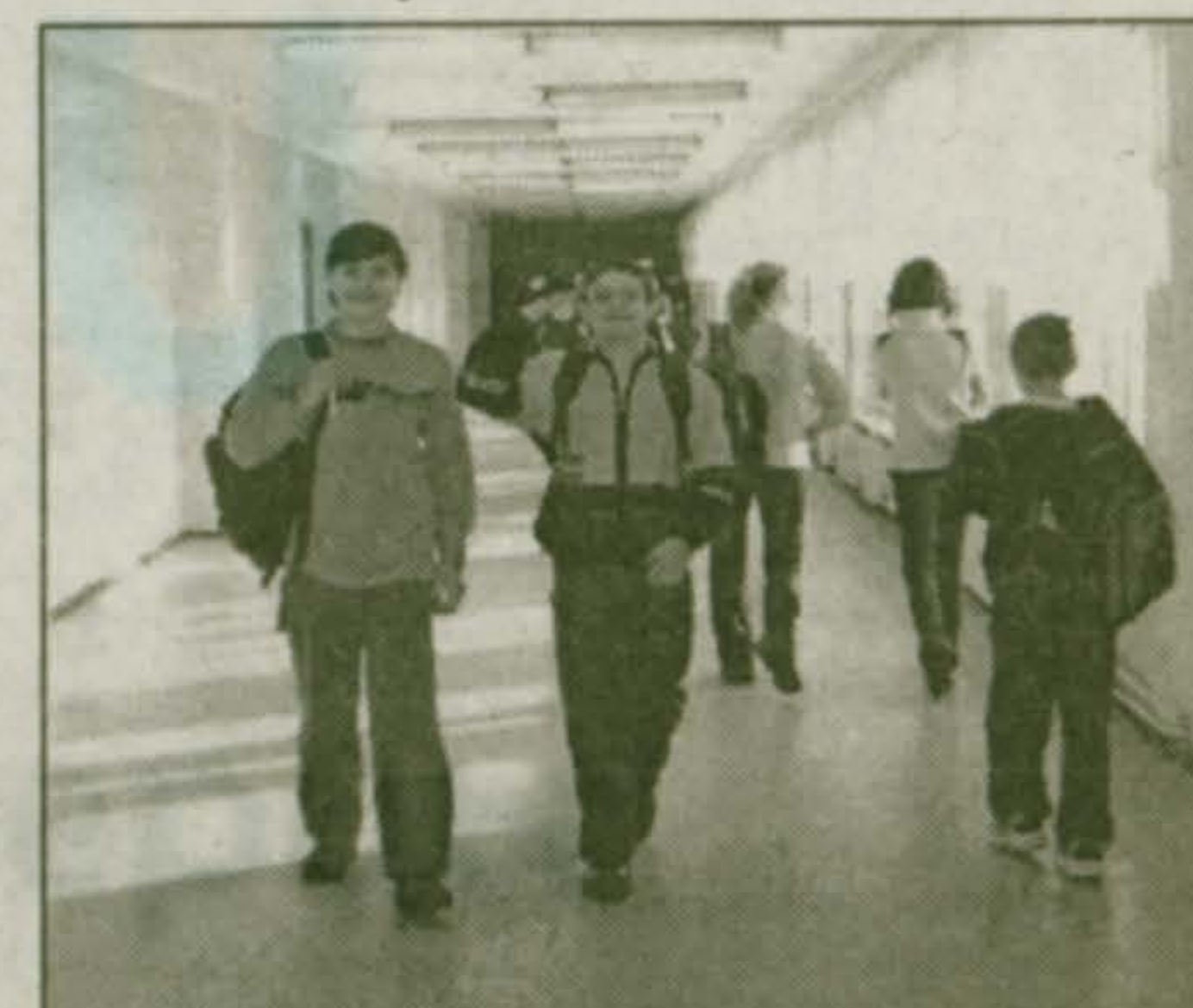
На перемене в гимназии № 56.