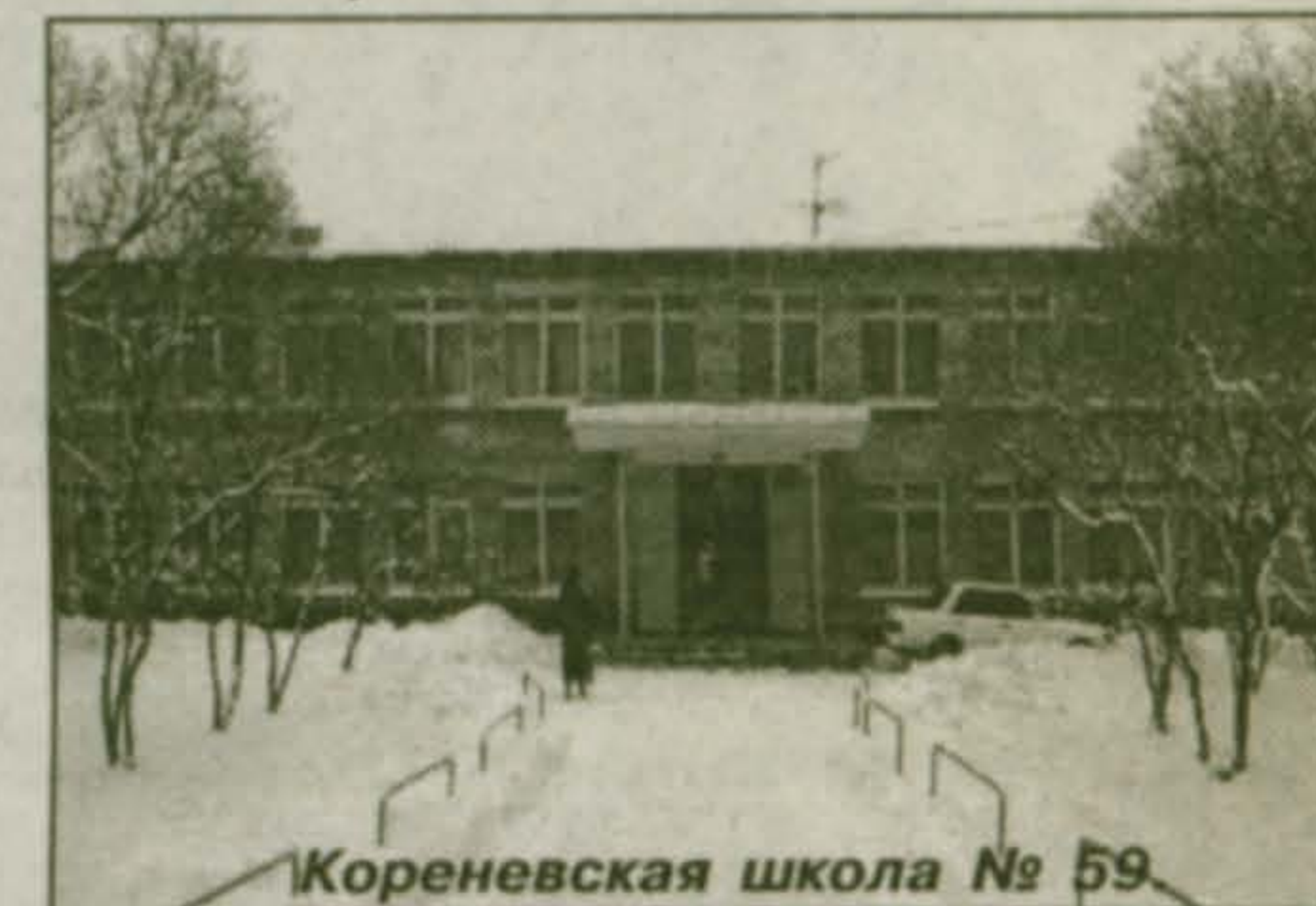
Корневская школа № 59.