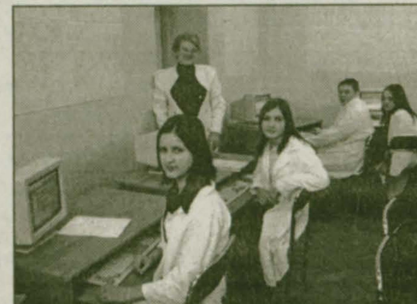
В компьютерном классе школы № 55.