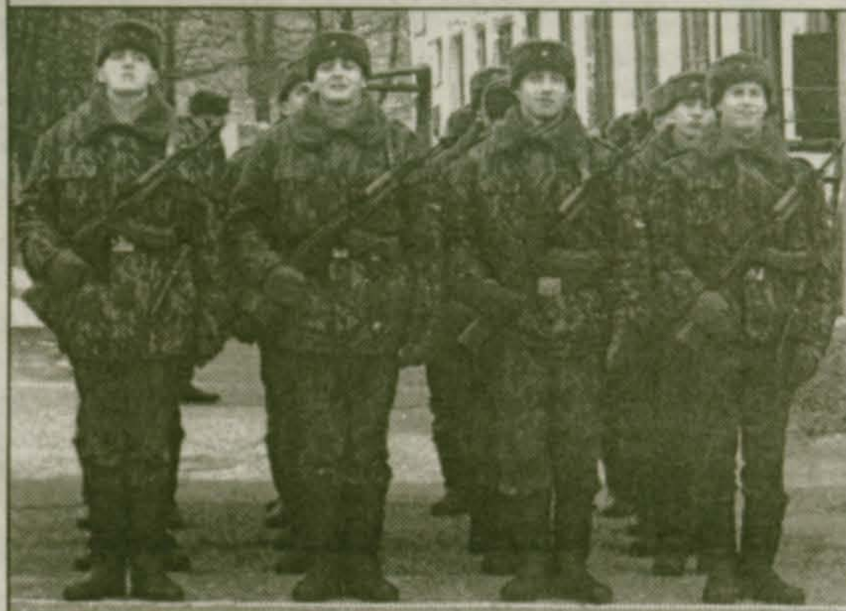
Призывники осени 2003 года из поселка Красково и Коренево принимают присягу.

Работники военно-учетного бюро постоянно следят за прохождением службы гражданами муниципального образования поселок Красково. Через командование воинских частей администрация поселка получает информацию о том, как выполняют воинский долг наши призывники. На основе этих данных военно-учетное бюро строит свою работу с населением.