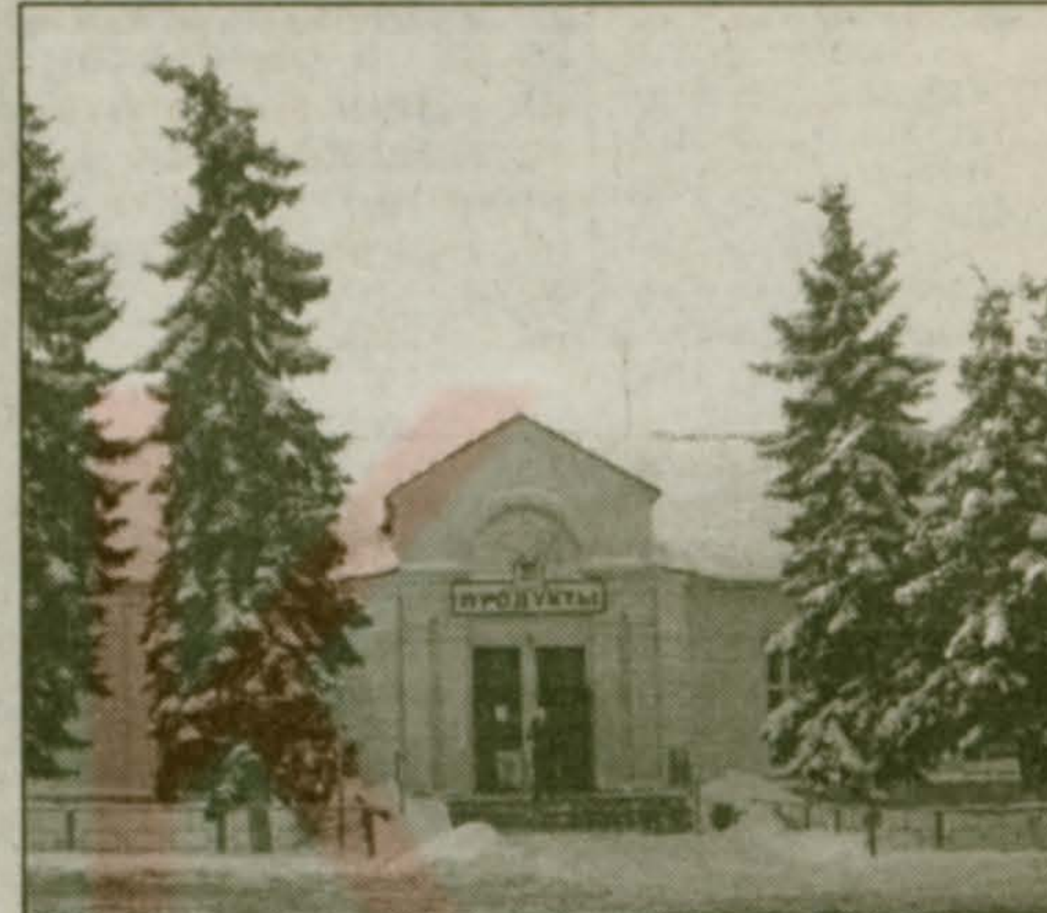
Все жалобы рассматривались в кратчайший срок, до полного устранения причин их возникновения.

Постоянно осуществляется работа по соблюдению законодательства о защите прав потребителя, а также контролю за наличием сертификатов качества и безопасности товаров и продуктов питания. Проводится работа по выяснению и устранению причин жалоб населения. За прошедший год были защищены интересы 24 граждан нашего поселка, обратившихся в отдел как письменно, так и устно. Большинство жалоб вызвано ненадлежащим качеством продуктов питания и низким уровнем обслуживания в предприятиях торговли.