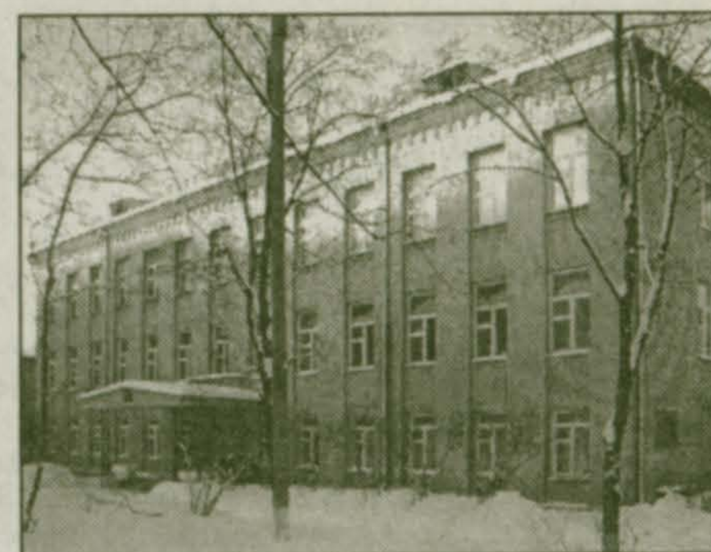
Школа № 55 после ремонта.

В муниципальном образовании поселок Красково 96 детей проживают в деревнях Марусино, Машково, Мотяково и обучаются в школе №430 п. Некрасовка. Администрация заключила со школой договор и ежегодно оказывает финансовую помощь для укрепления ее материально-технической базы. Для доставки детей в школу организован школьный рейс, который обеспечивает автоколонна №1787. Финансовые средства изысканы администрацией п. Красково.