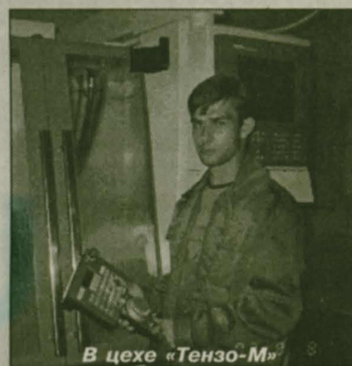
В цехе «Тензо-М»

В 2003 году, когда поселок Красково перешел на межбюджетные отношения с Московской областью, обошлись без единого банковского кредита. Имея межбюджетные отношения с Люберецким районом, на протяжении последних 10 лет мы не вылезали из кредитной ямы. Это было экономически невыгодно.