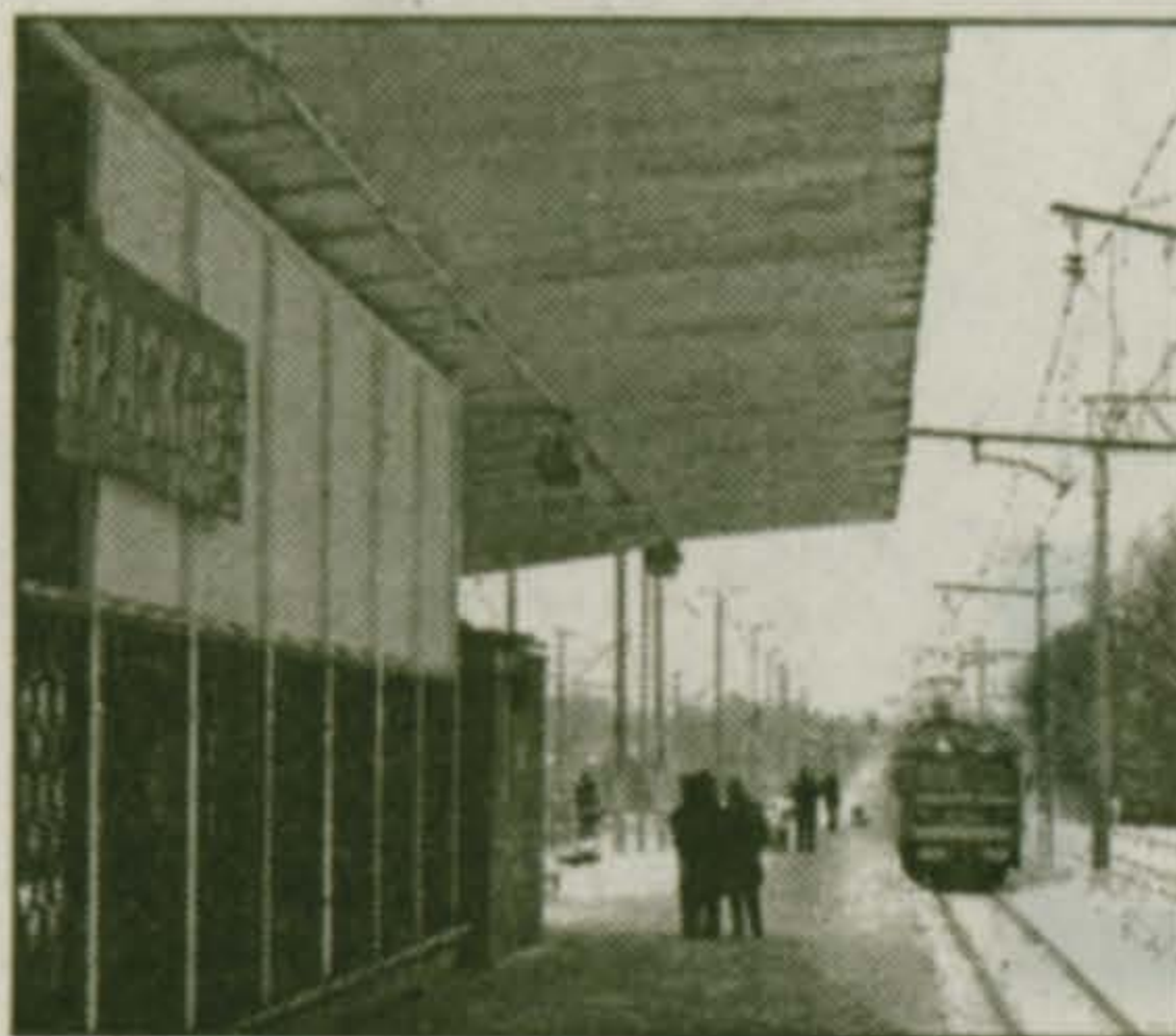
ОТ СТАНЦИИ КРАСКОВО