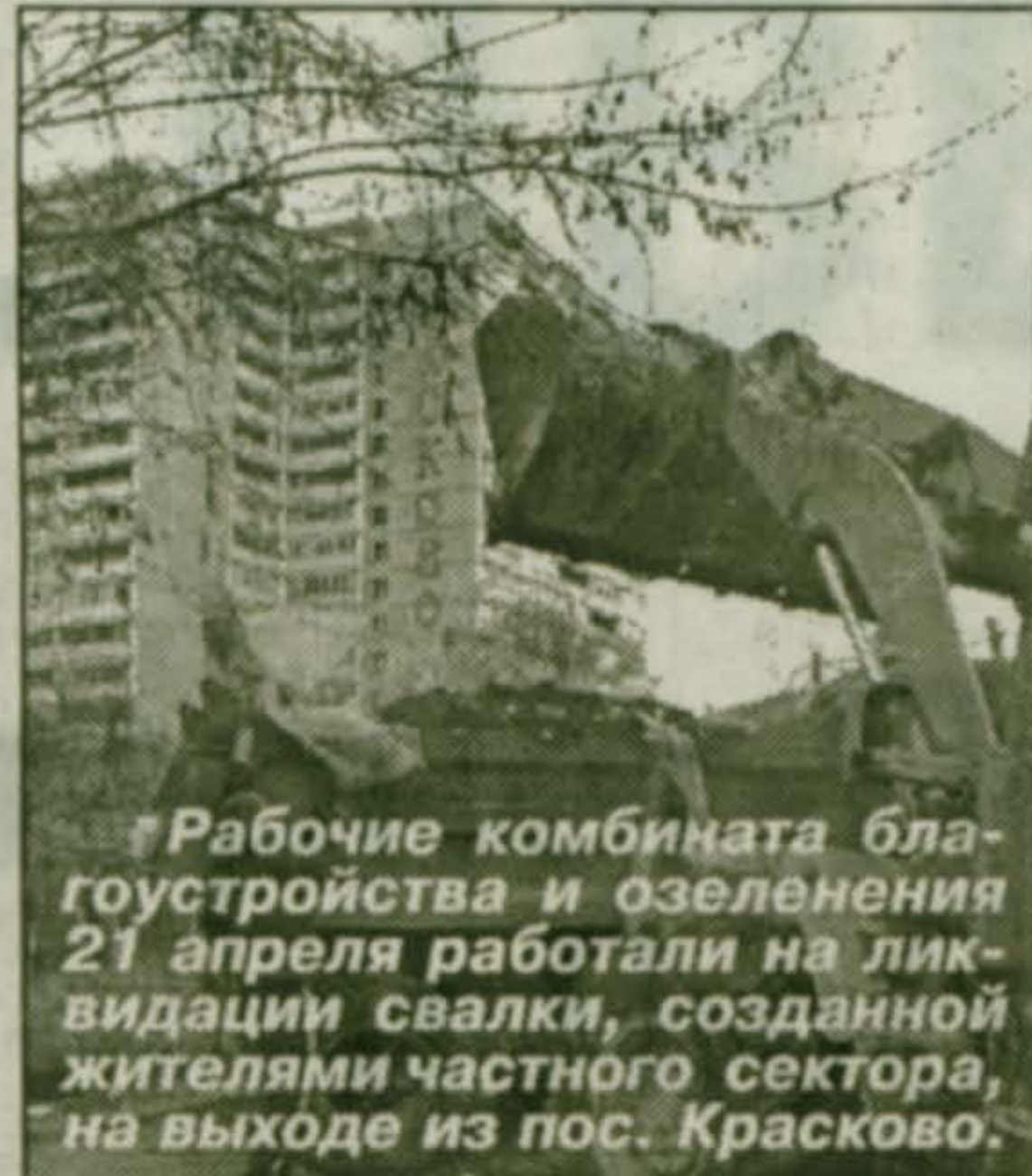
Рабочие комбината благоустройства и озеленения 21 апреля работали на ликвидации свалки, созданной жителями частного сектора, на выходе из пос. Красково.