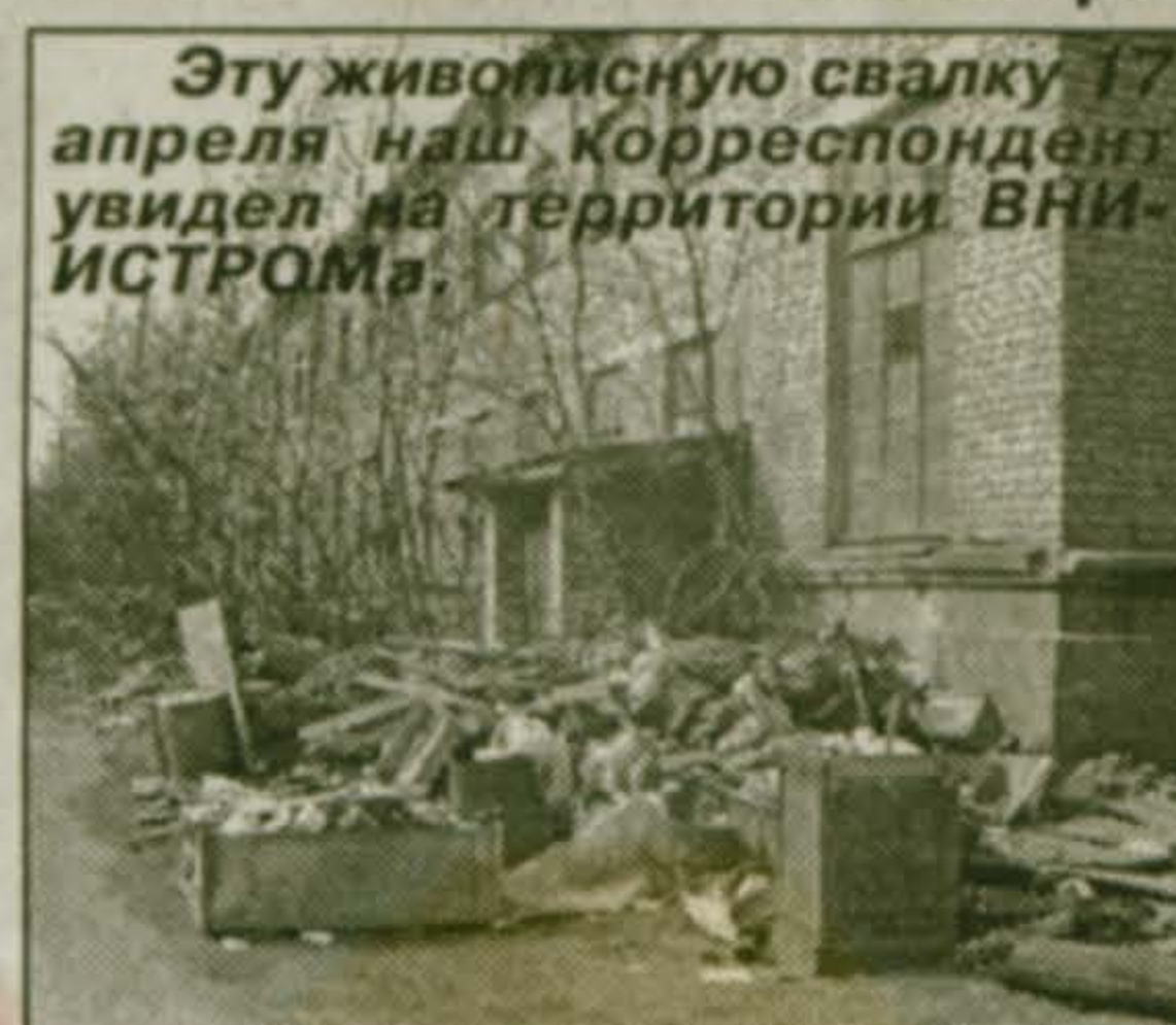
Эту живописную свалку 17 апреля наш корреспондент увидел на территории ВНИИСТРОМА.