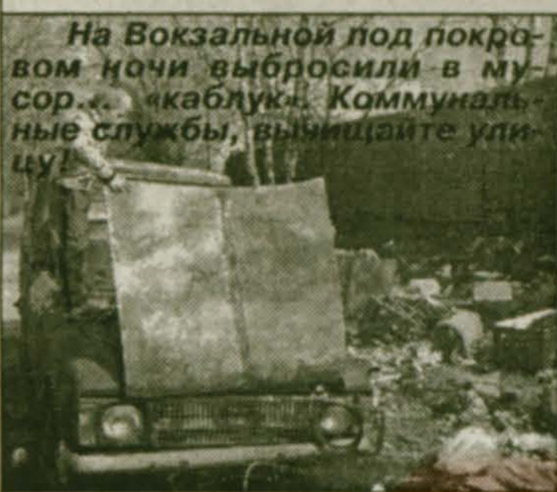
На Вокзальной под покровом ночи выбросили в мусор... «каблук». Коммунальные службы, вычищайте улицы!