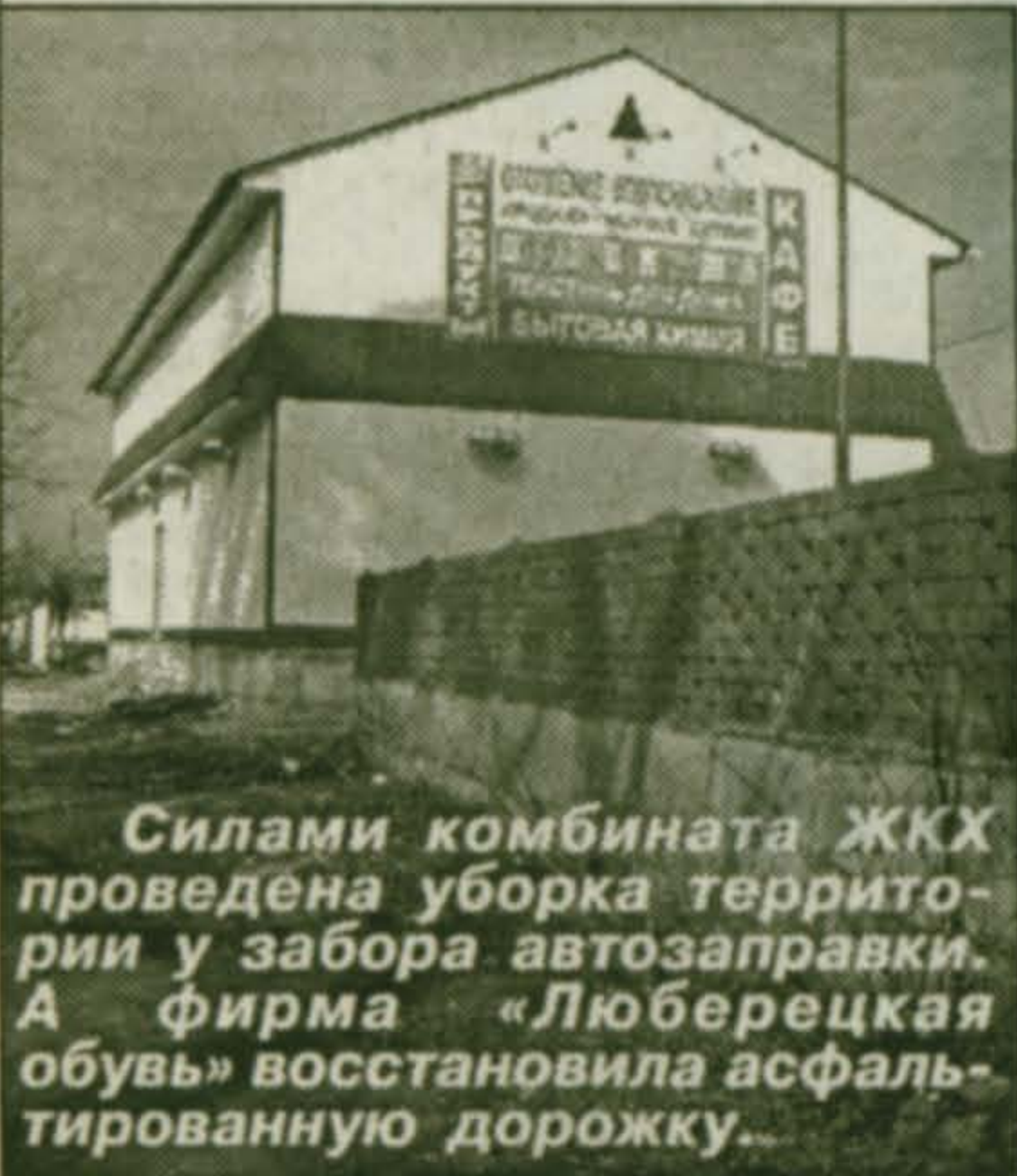
Силами комбината ЖКХ проведена уборка территории у забора автозаправки. А фирма «Люберецкая обувь» восстановила асфальтированную дорожку.