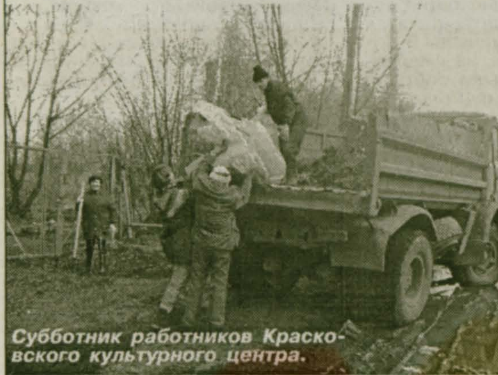
Субботник работников Красковского культурного центра.

За время проведения субботников работниками МУП «КЖКХ и Б», МУП «Благоустройство и озеленение» пос. Красково, учащимися и педагогическими коллективами гимназии № 56, школ №№ 55, 59, сотрудниками детских садов №№ 92, 93, 94 и 95, работниками стадиона «Электрон», культурного центра была проделана огромная работа: приведены в порядок прилегающие территории, убран лес за больницей, от мусора очищены терри-