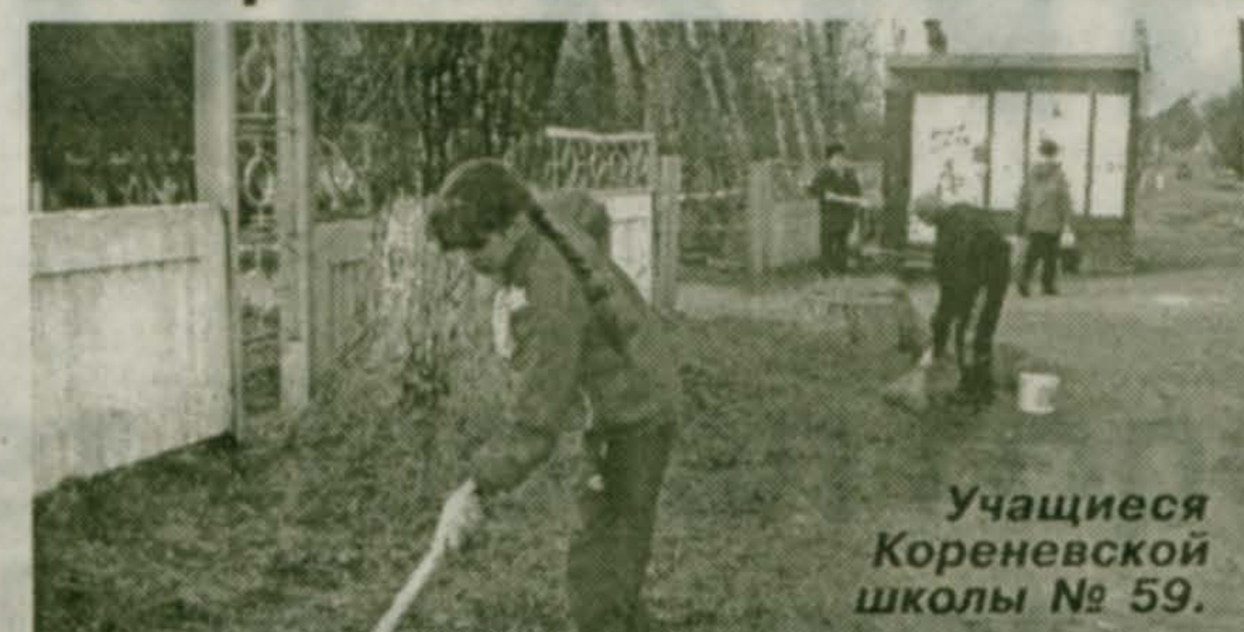
Учащиеся Кореневской школы № 59.

Днями наведения чистоты и благоустройства поселков Красково, Коренево, деревень Машково, Марусино, Мотяково и Торбеево были названы в нашем муниципальном образовании 17 и 24 апреля.