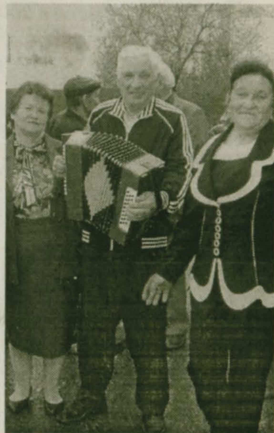
9 мая в пос. Красково