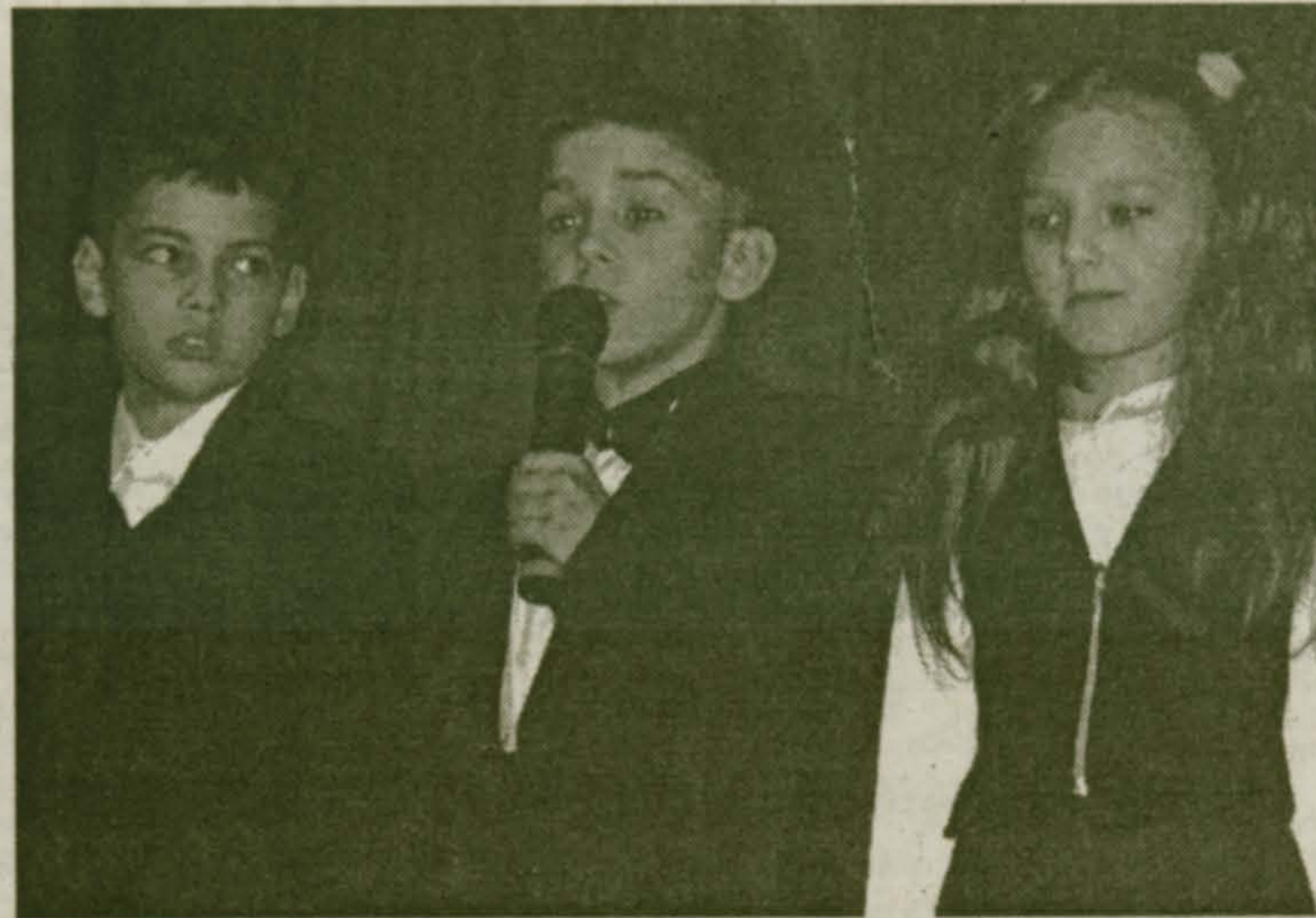
Выступают учащиеся 3 «в» класса.