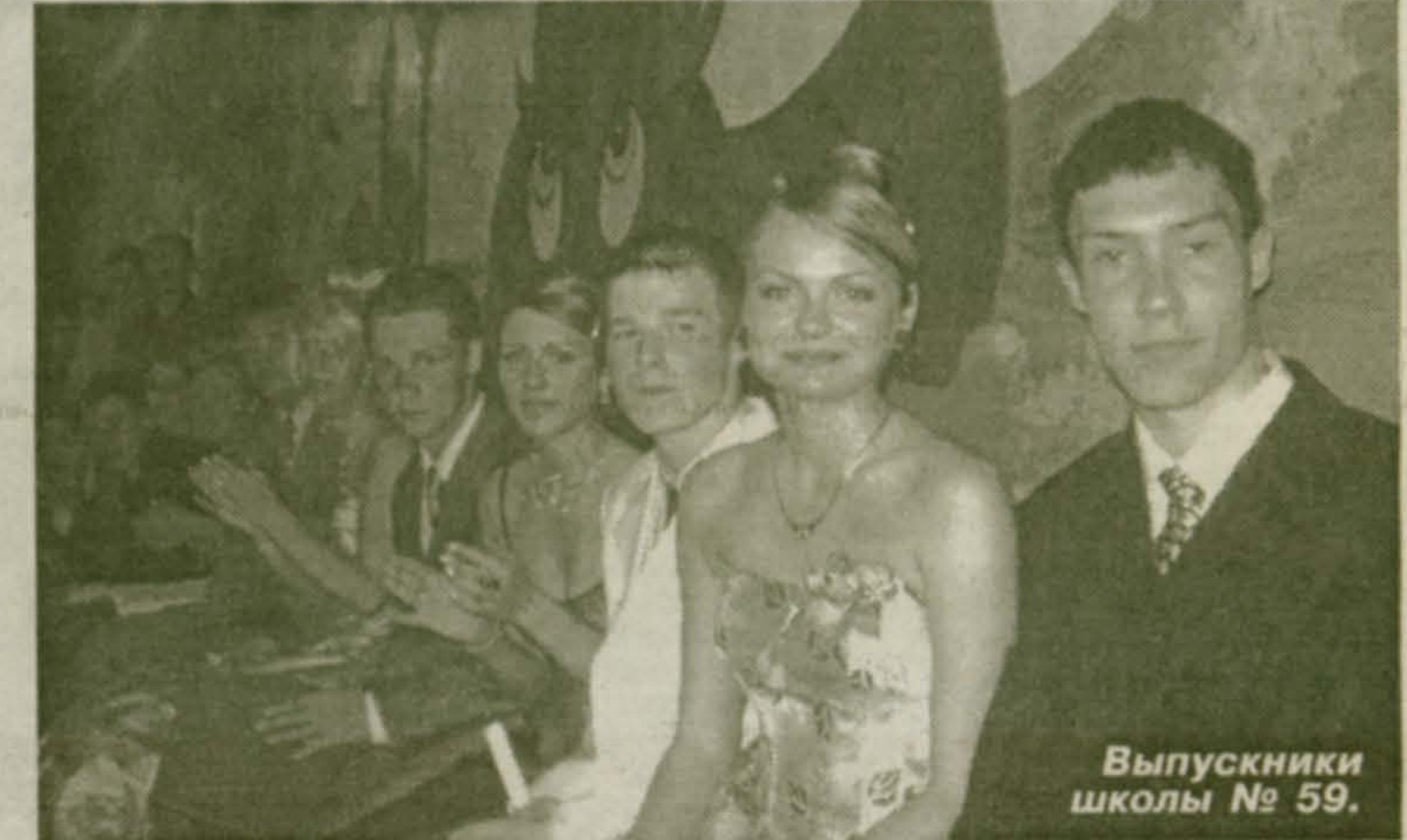
Выпускники школы № 59.

Приступая к написанию данной статьи, я невольно вспомнила слова известной песни, где говорится, что за круговертью разных дел – важных и не очень – «некогда нам оглянуться назад». И тем не менее я попросила своего собеседника «оглянуться». Это нужно всем нам – ныне здравствующим – узнать из уст очевидца правду о событиях давно минувших лет.