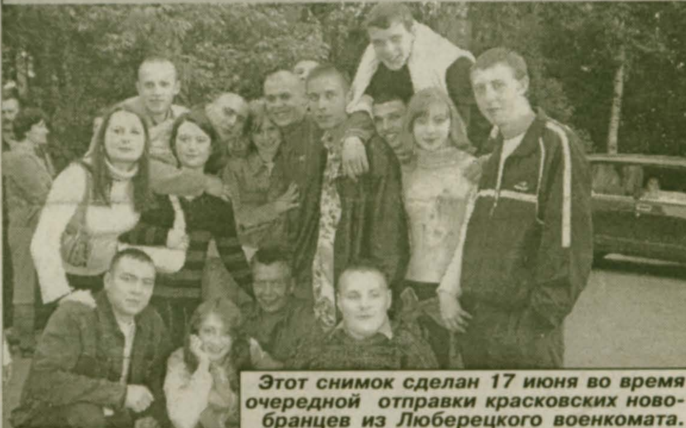
Этот снимок сделан 17 июня во время очередной отправки красковских новобранцев из Люберецкого военкомата.