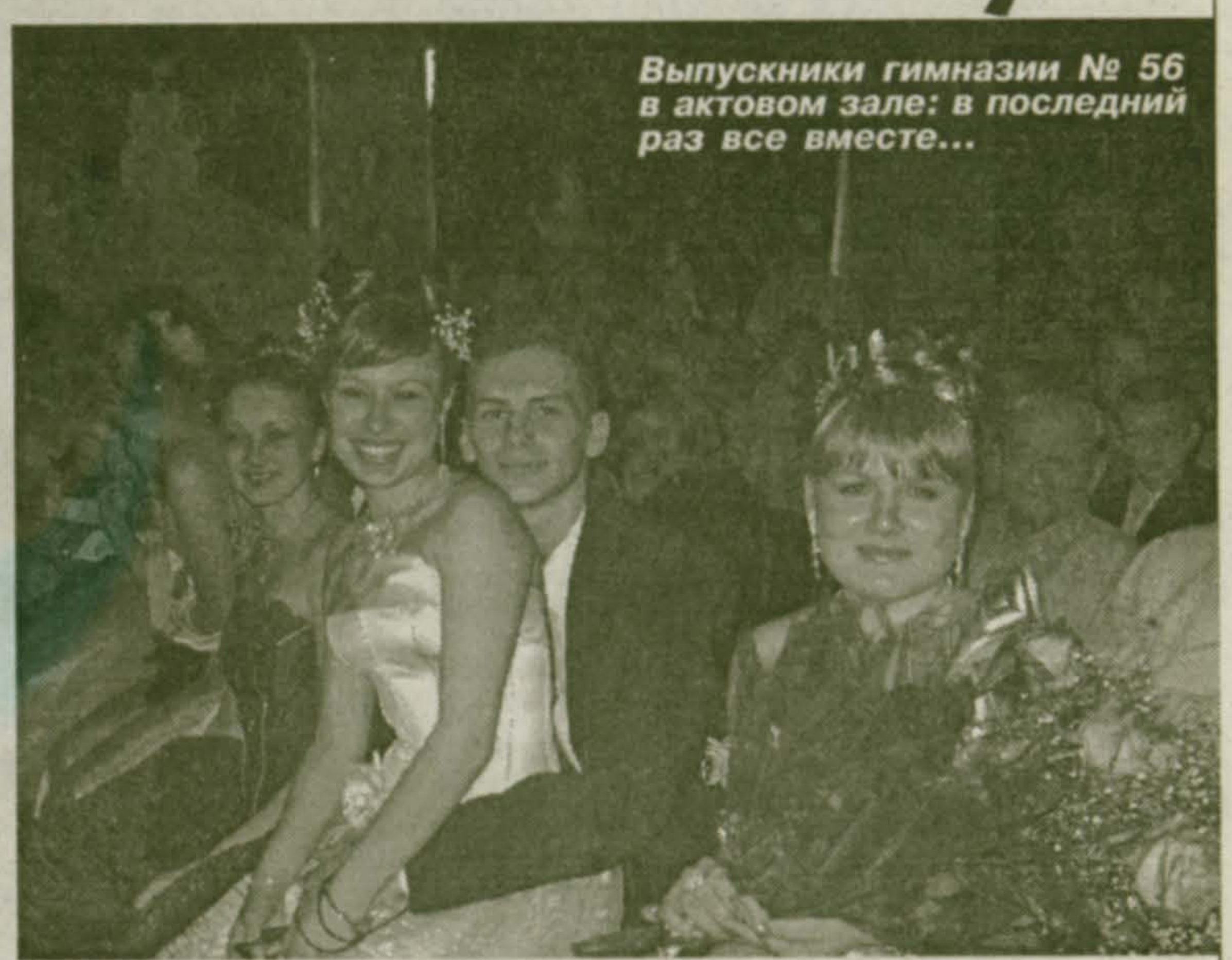
Выпускники гимназии № 56 в актовом зале: в последний раз все вместе...