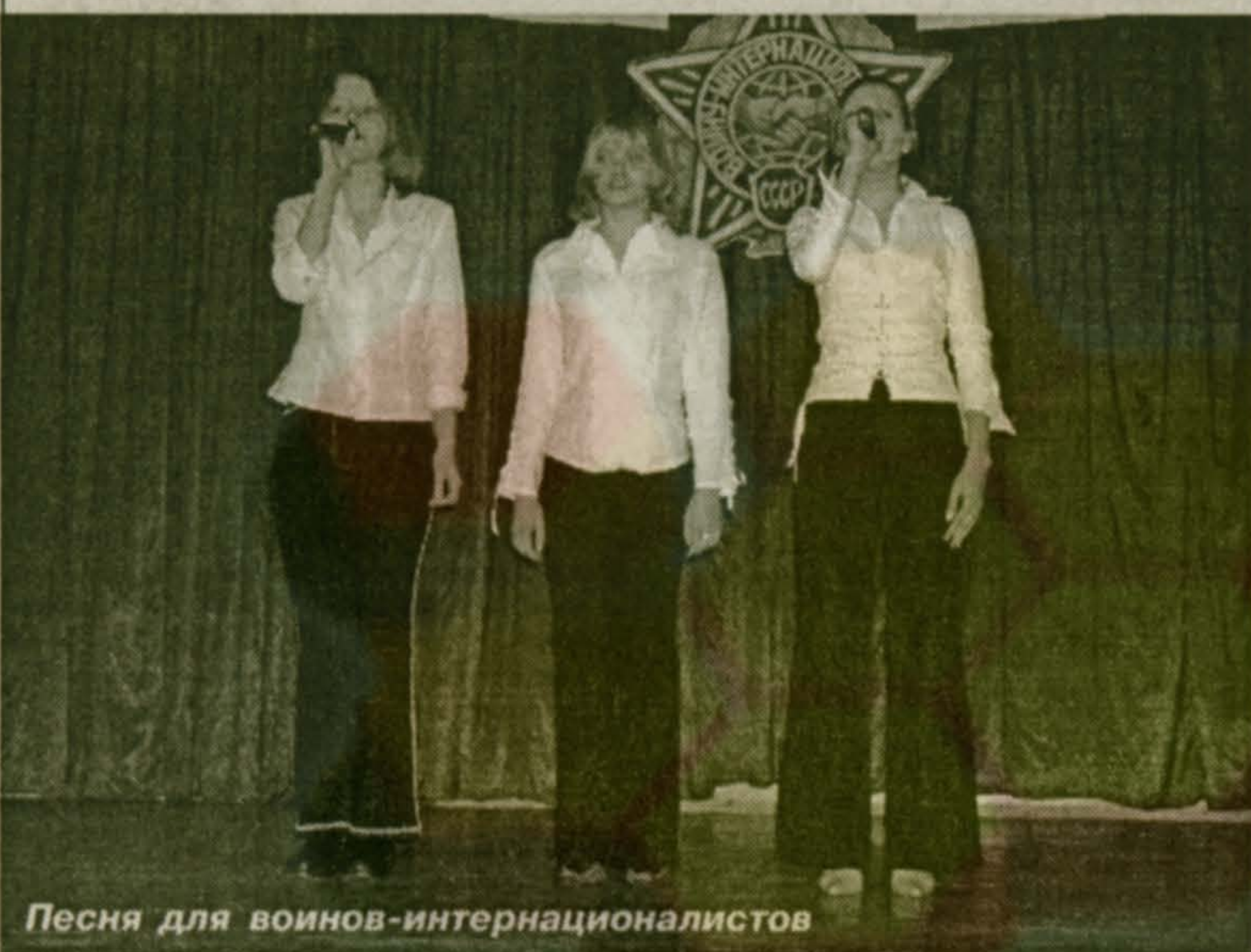
Песня для воинов-интернационалистов

Педагогический коллектив гимназии состоит из творческих, инициативных, высококвалифицированных учителей, которые постоянно работают над совершенствованием своего уровня. В 2003-2004 учебном году в МОУ «Гимназия № 56» прошли аттестацию и повысили свою квалификацию 14 человек.