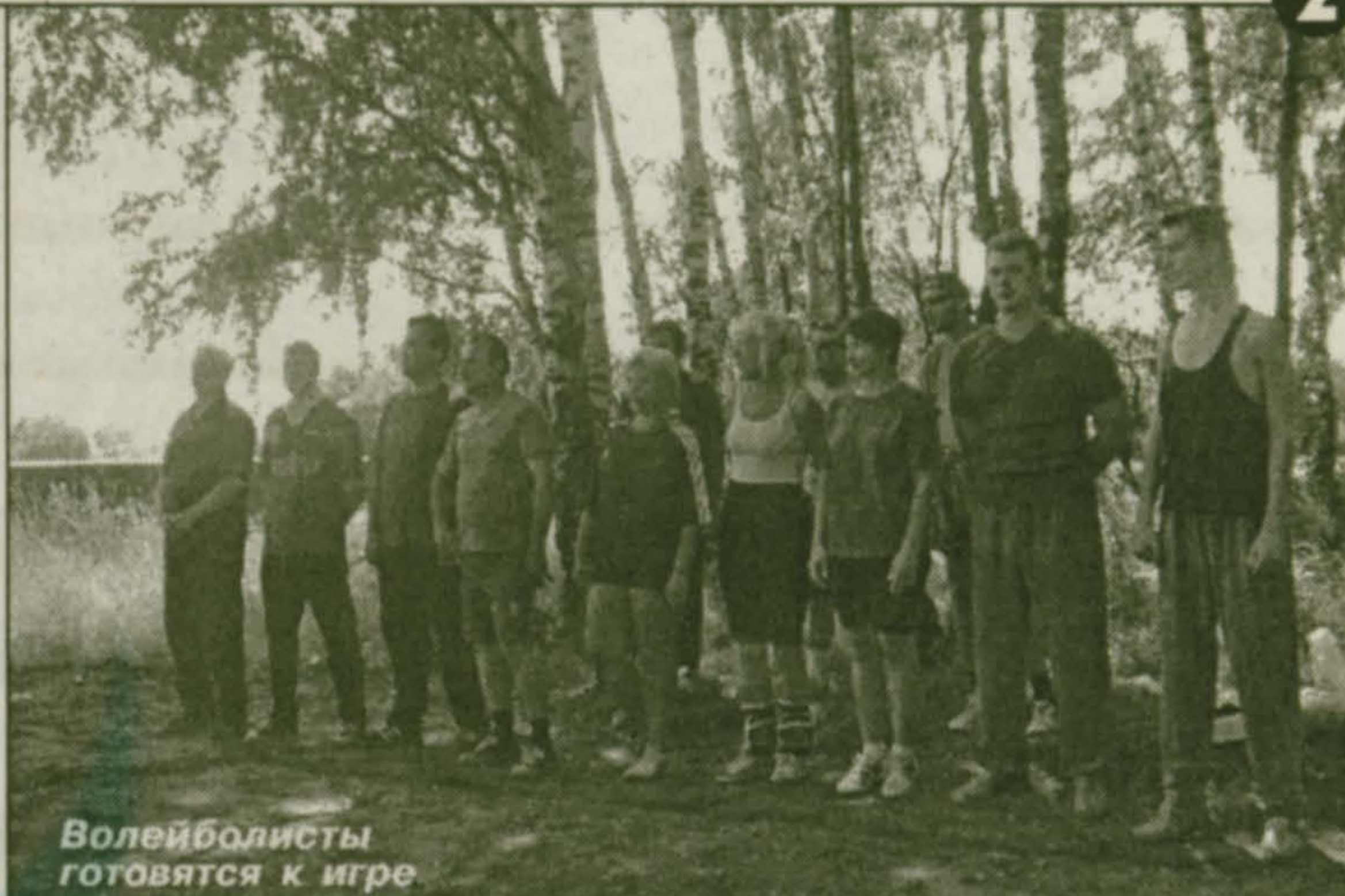
Волейболисты готовятся к игре

- Начем с подготовительных работ. Основная нагрузка легла на волейбольную команду. Нужно было найти подходящую по размерам площадку, сделать разметку и многое другое.