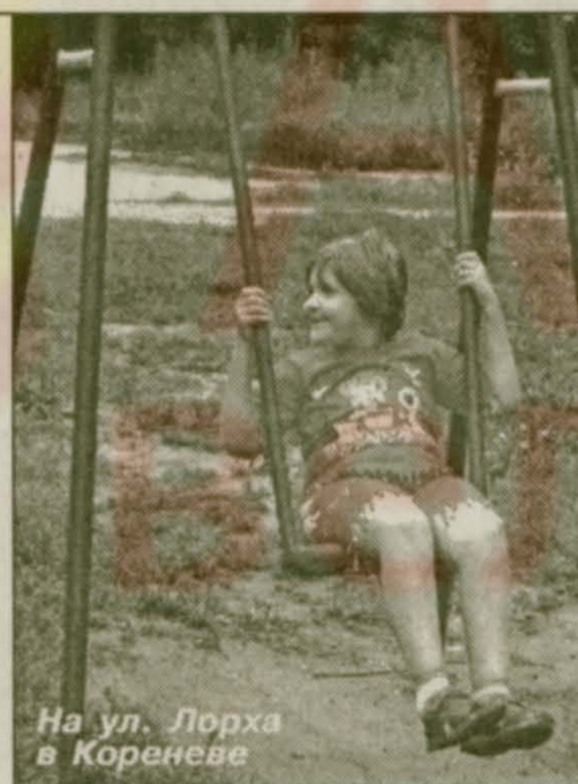
На ул. Лорха в Коренево

Лорха, 8; ул. 2-я Заводская, 17, 24. На днях появилась площадка для игр детей в сквере у овощного магазина, где любят гулять молодые мамы с малышами.