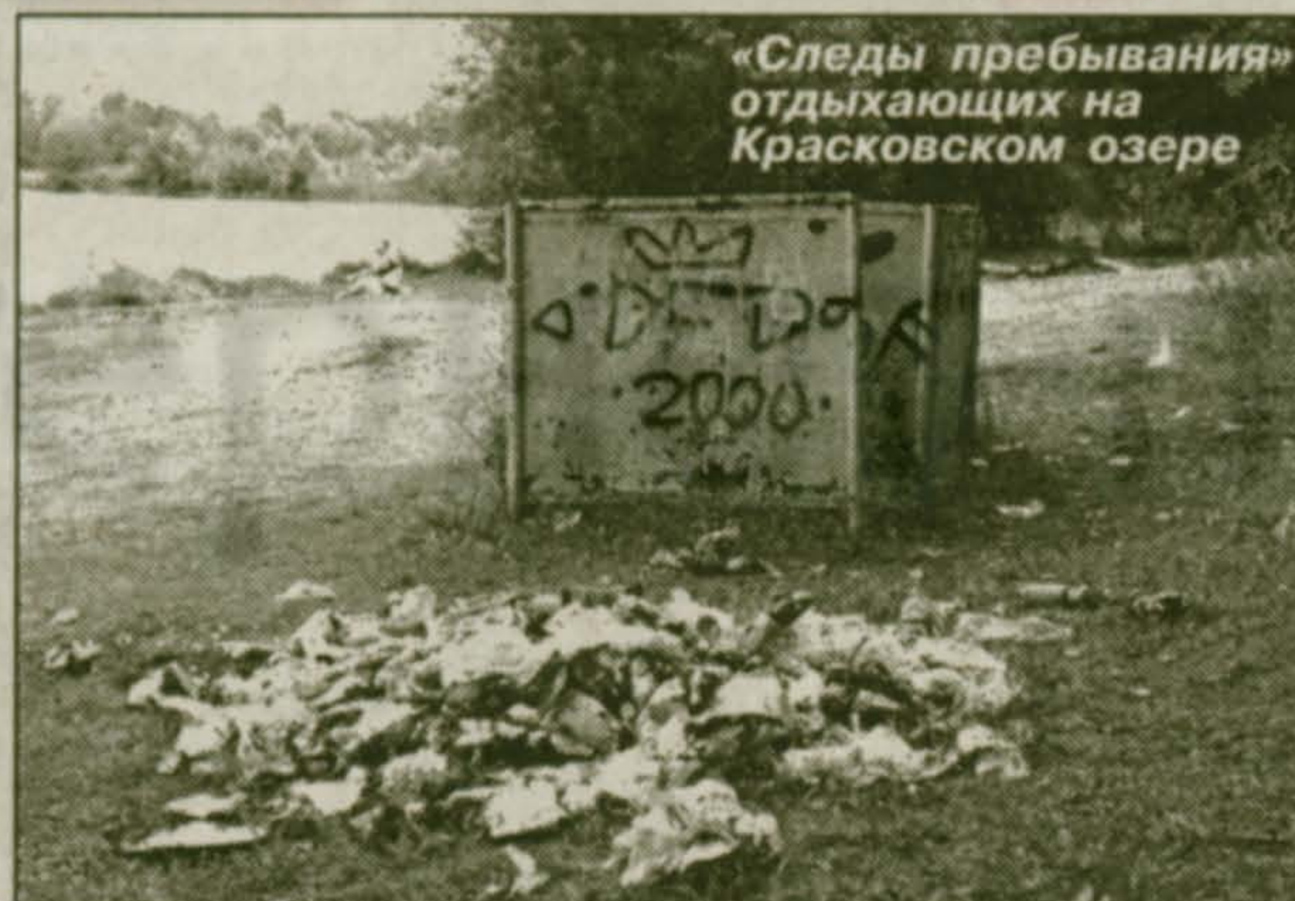
«Следы пребывания» отдыхающих на Красковском озере