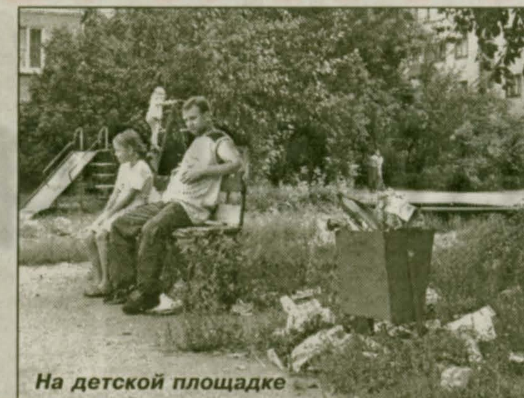
На детской площадке