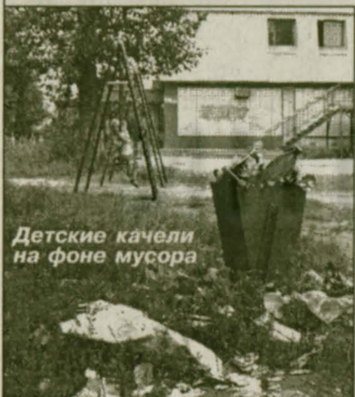
Детские качели на фоне мусора

«ЧИСТО НЕ ТАМ, ГДЕ ПОДМЕТАЮТ, А ТАМ, ГДЕ НЕ СОРЯТ»