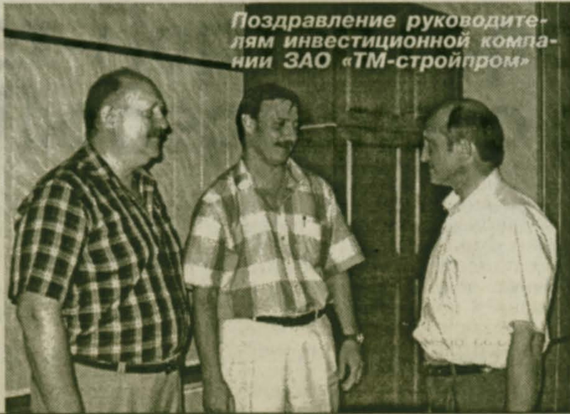
Поздравление руководителям инвестиционной компании ЗАО «ТМ-стройпром»