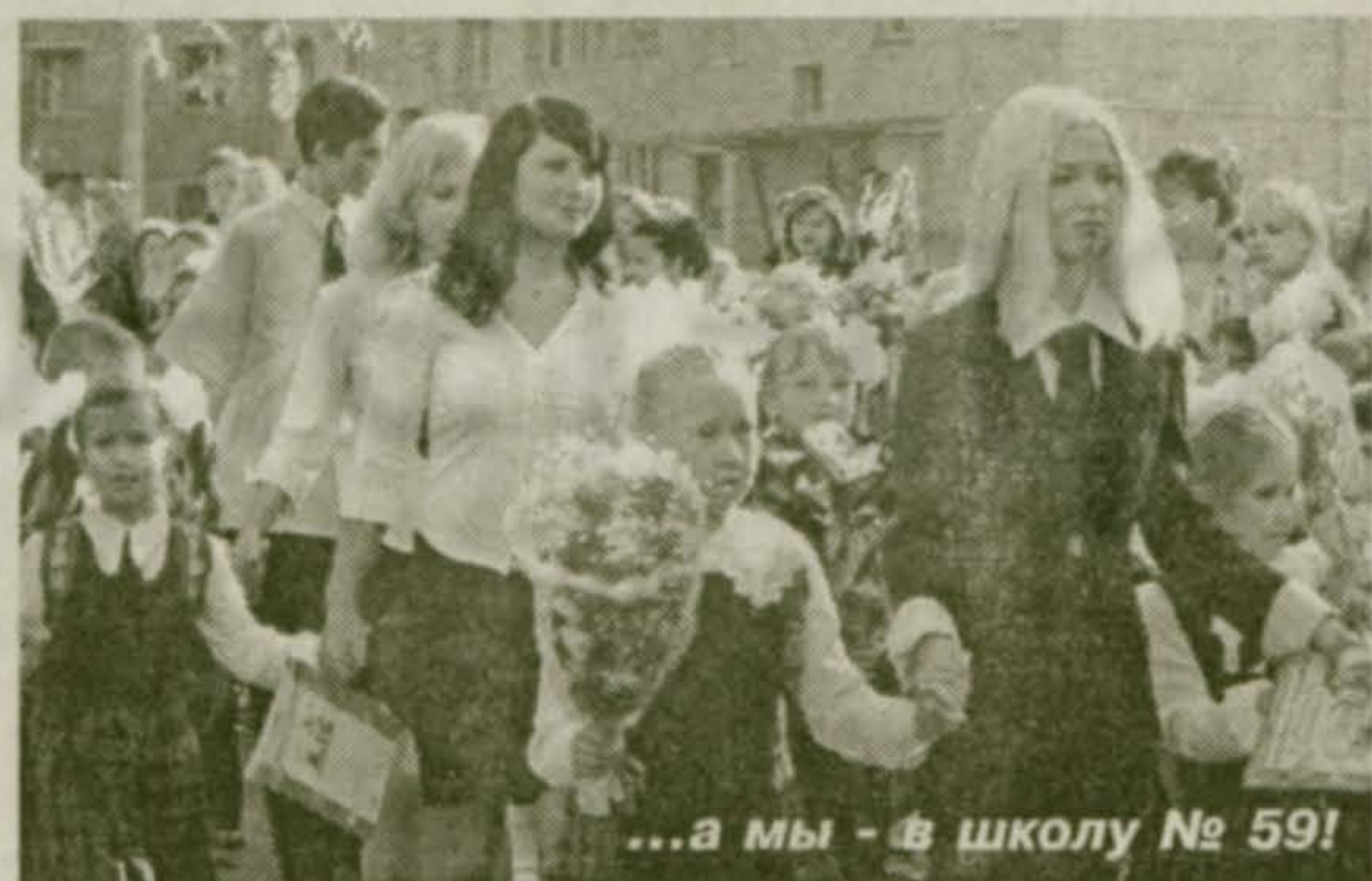
...а мы - в школу № 59!