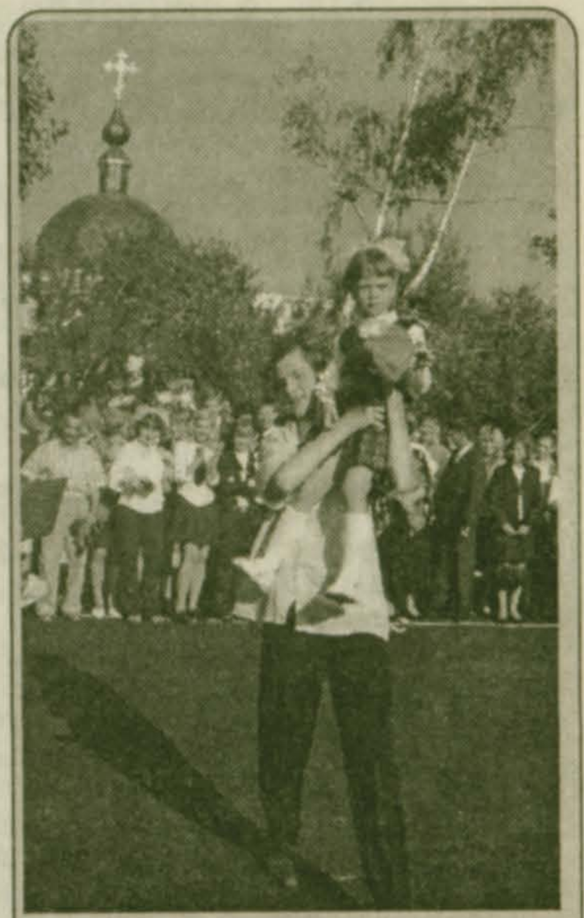
Первый звонок звенит в Корневской школе № 59.