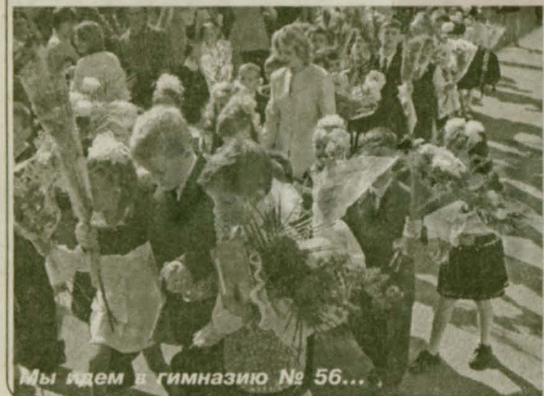
Мы идем в гимназию № 56...