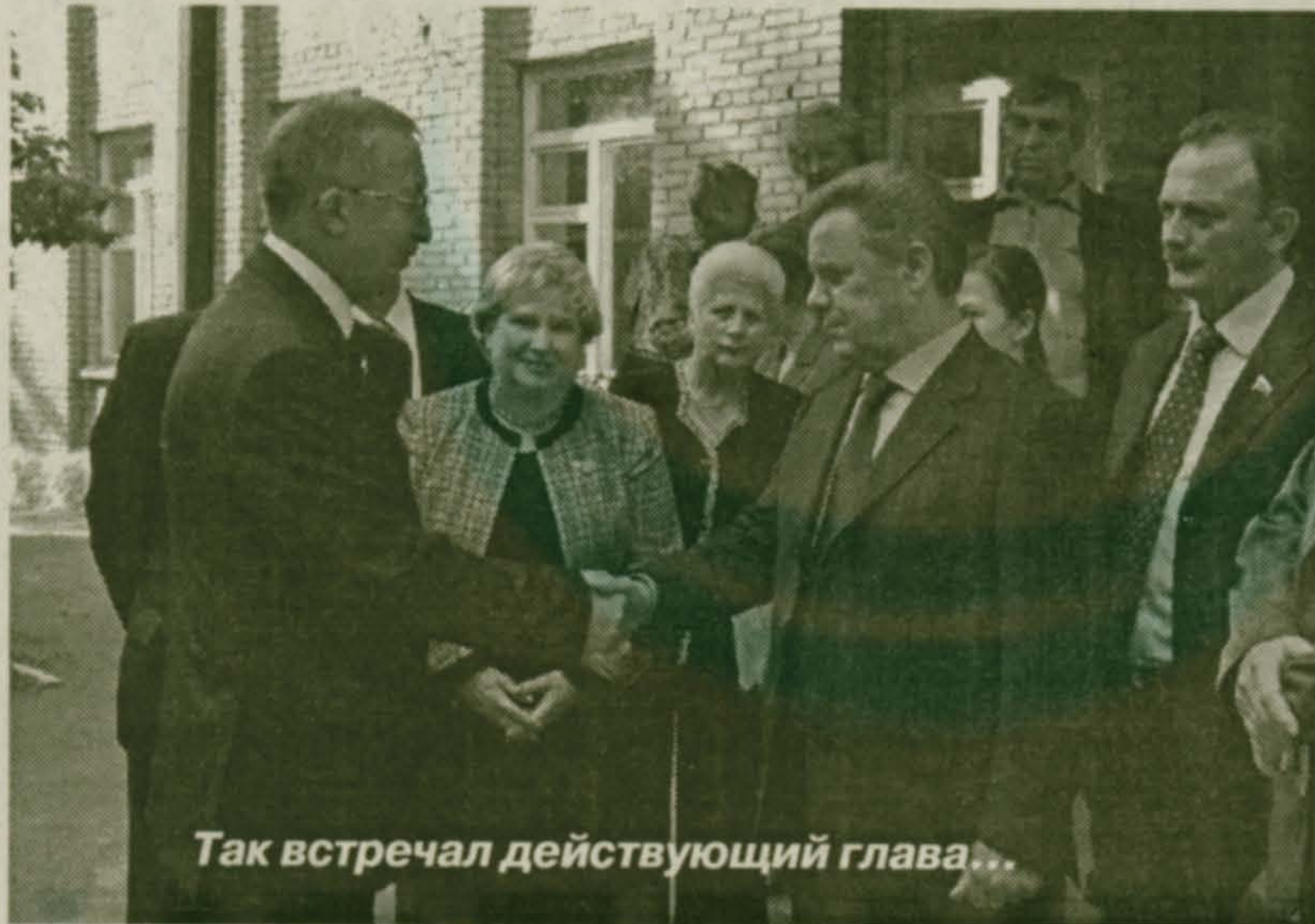
Так встречал действующий глава...