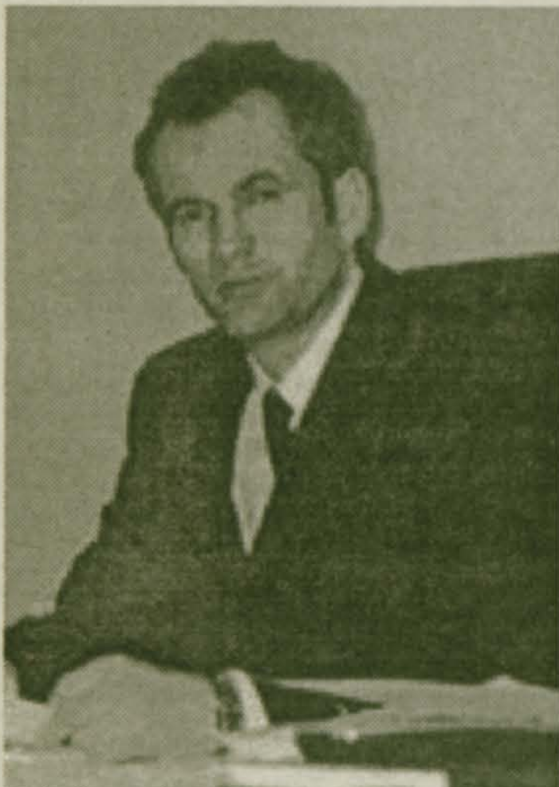
Министр строительства Е.В. СЕРЕГИН