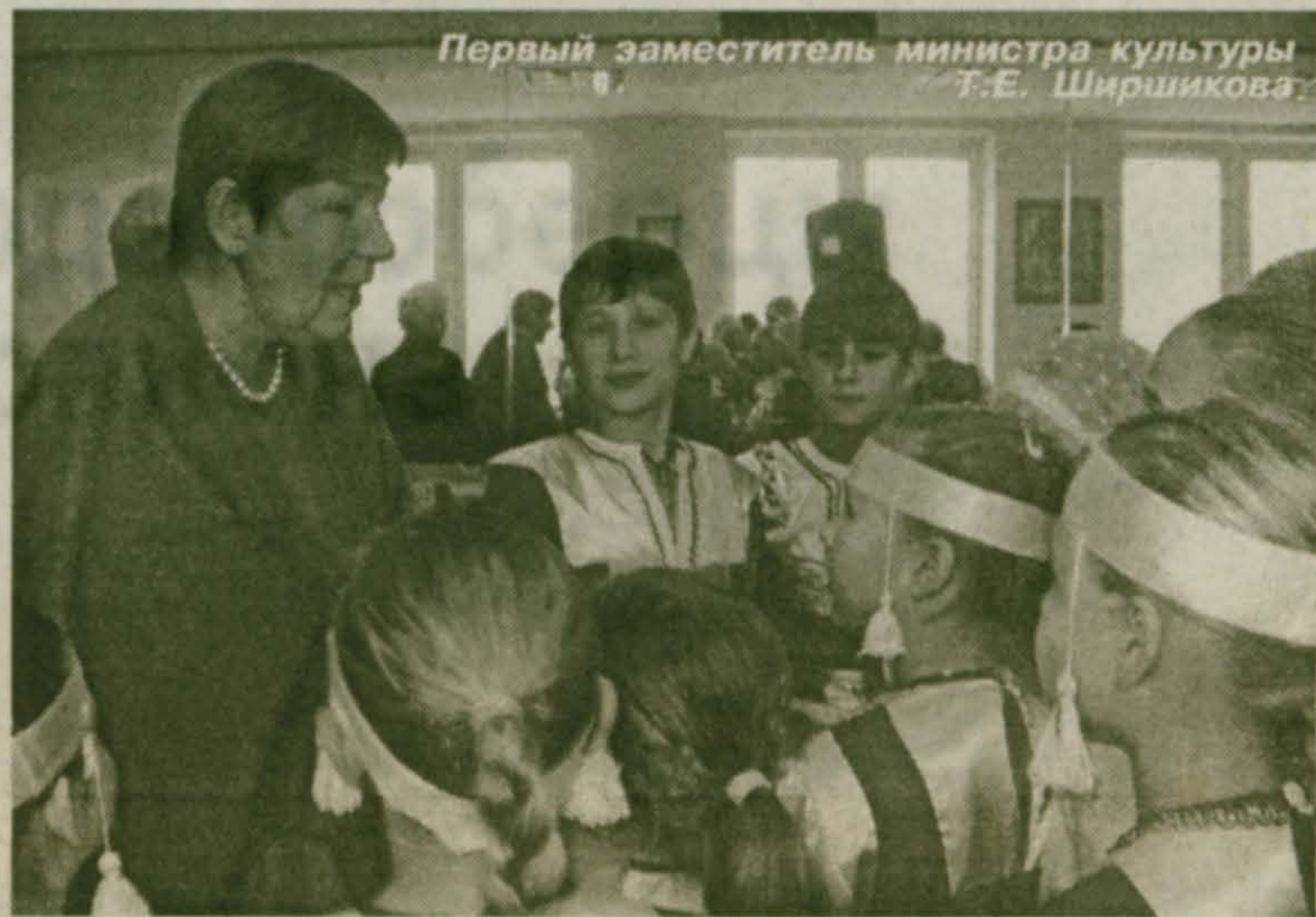
Первый заместитель министра культуры Т.Е. Ширшикова