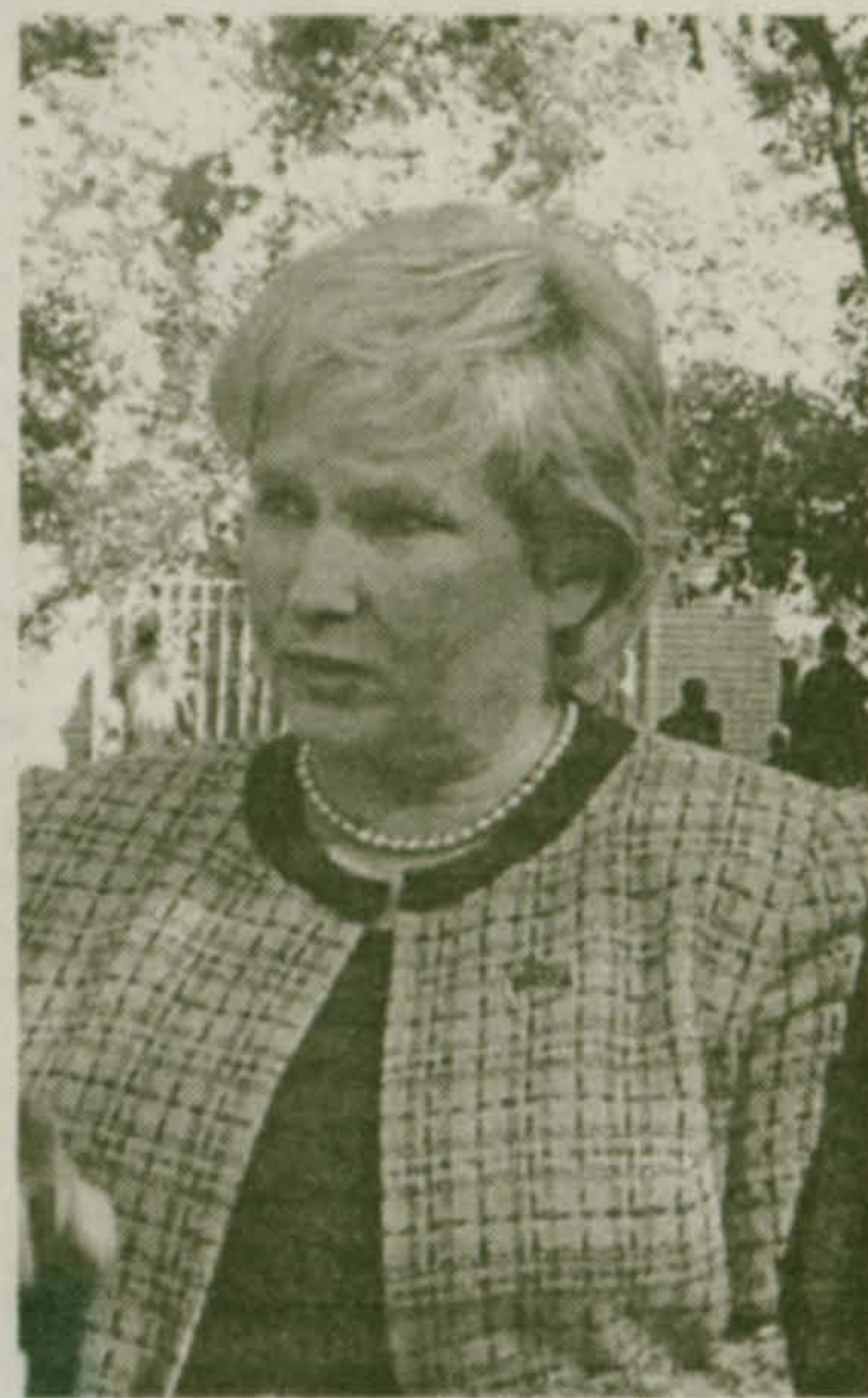
Министр образования Московской области Л.Н. АНТОНОВА