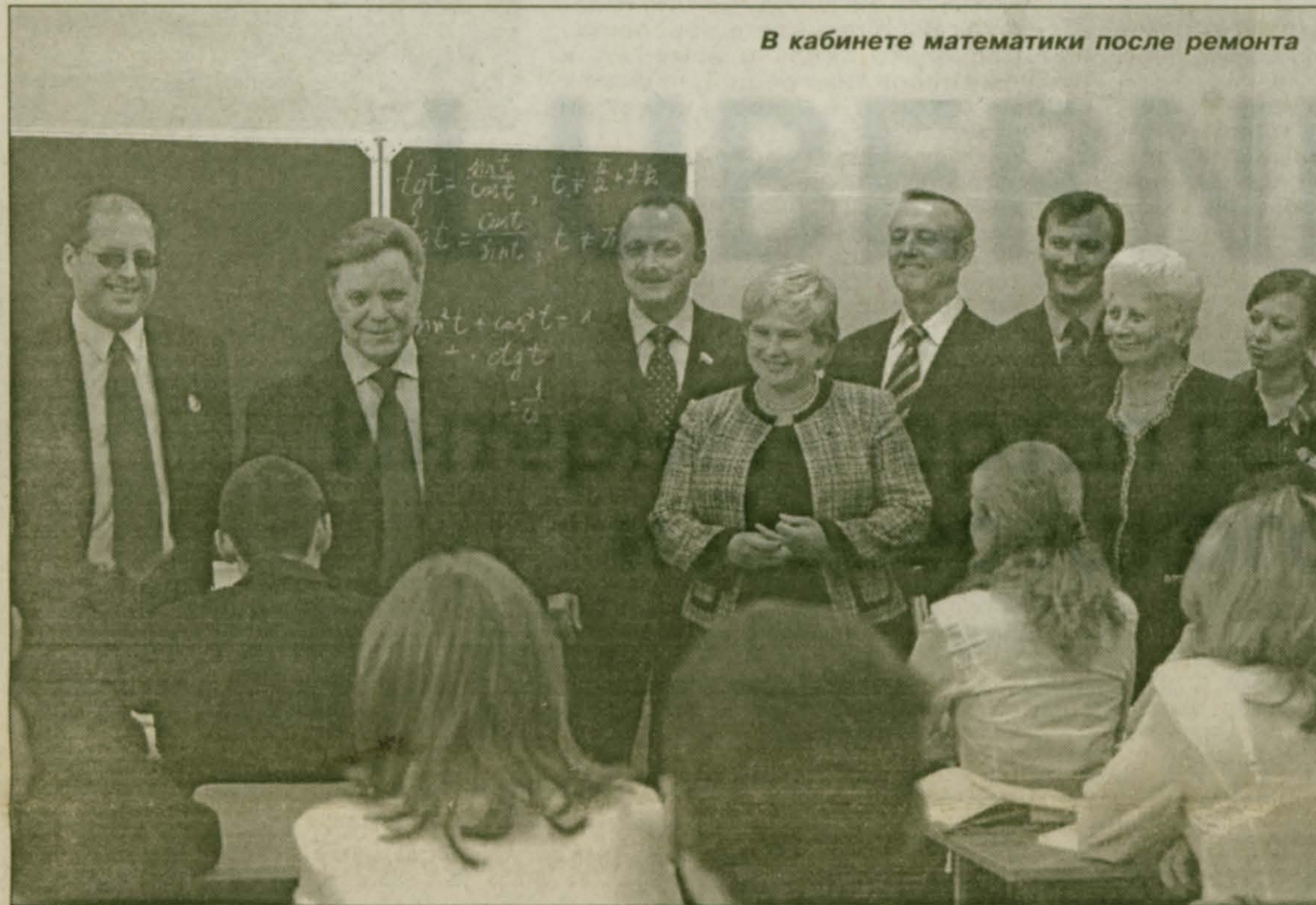
В кабинете математики после ремонта

Приезд губернатора Б.В. Громова в Красковскую школу № 55 - знаковое событие накануне выборов главы муниципального образования поселок Красково. Губернатор выразил свою заинтересованность в сохранении у нас стабильной обстановки в интересах успешного развития поселка.