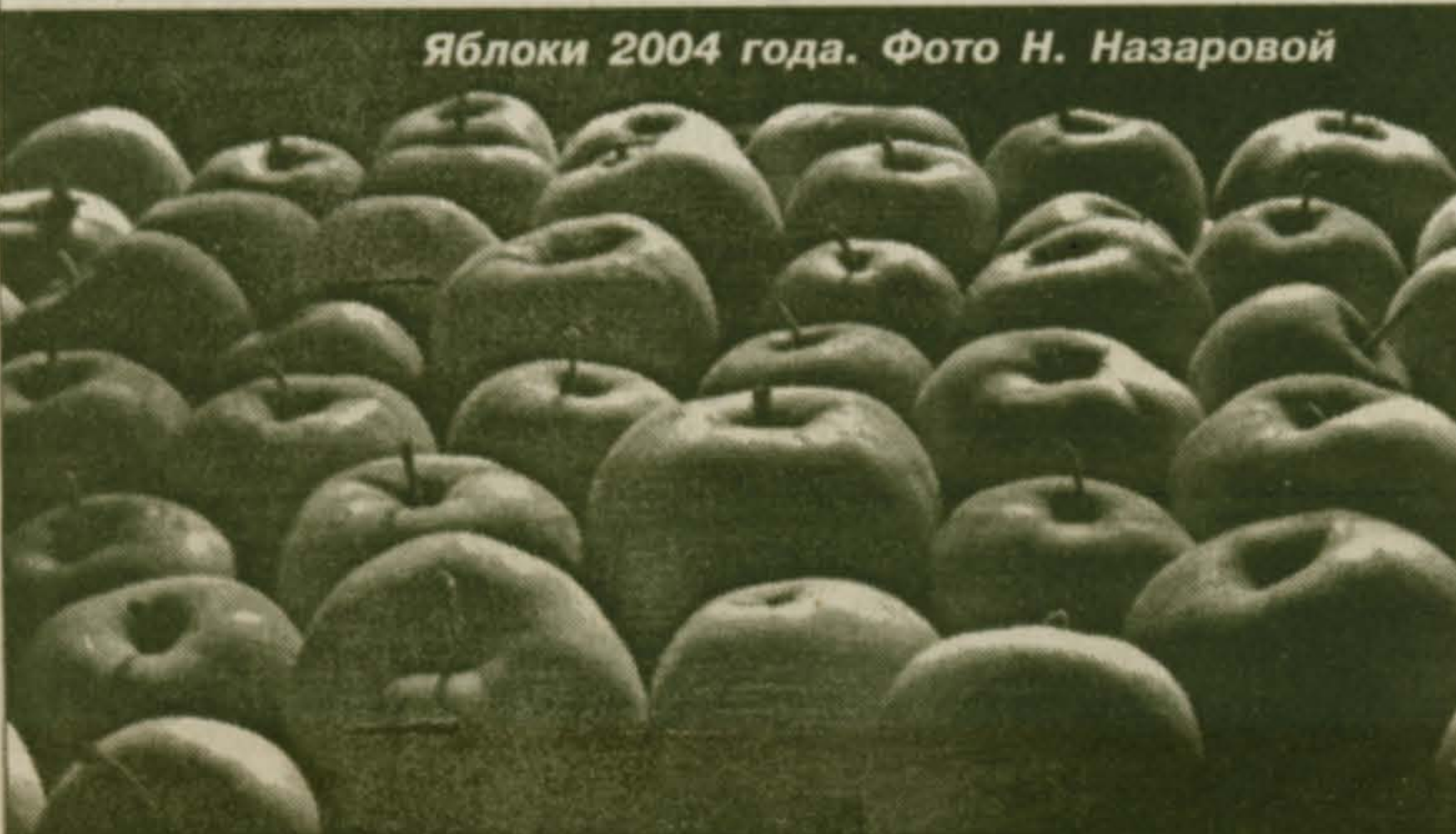
Яблоки 2004 года.

В Красковской библиотеке до конца октября работает выставка фоторабот красковчанки Нины Назаровой . Выпускница Гжельского художественно-промышленного колледжа занимается авторской керамикой, преподает в Люберецкой детской художественной школе.