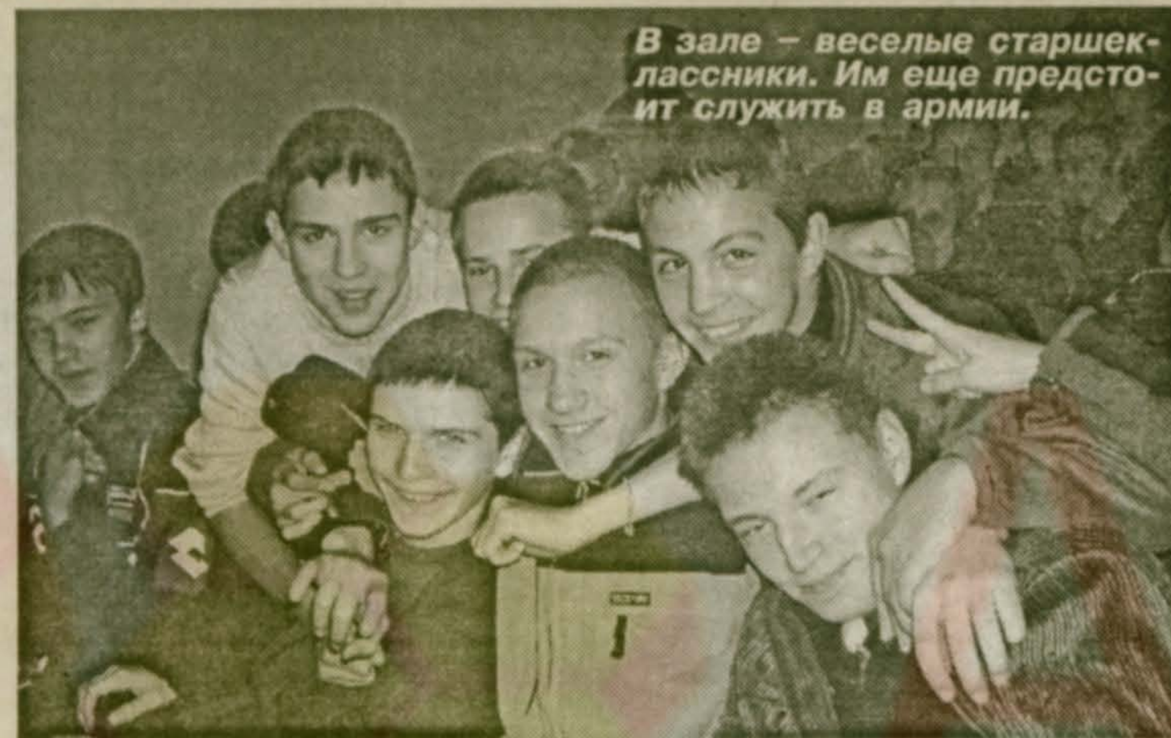
В зале – веселые старшеклассники. Им еще предстоит служить в армии.