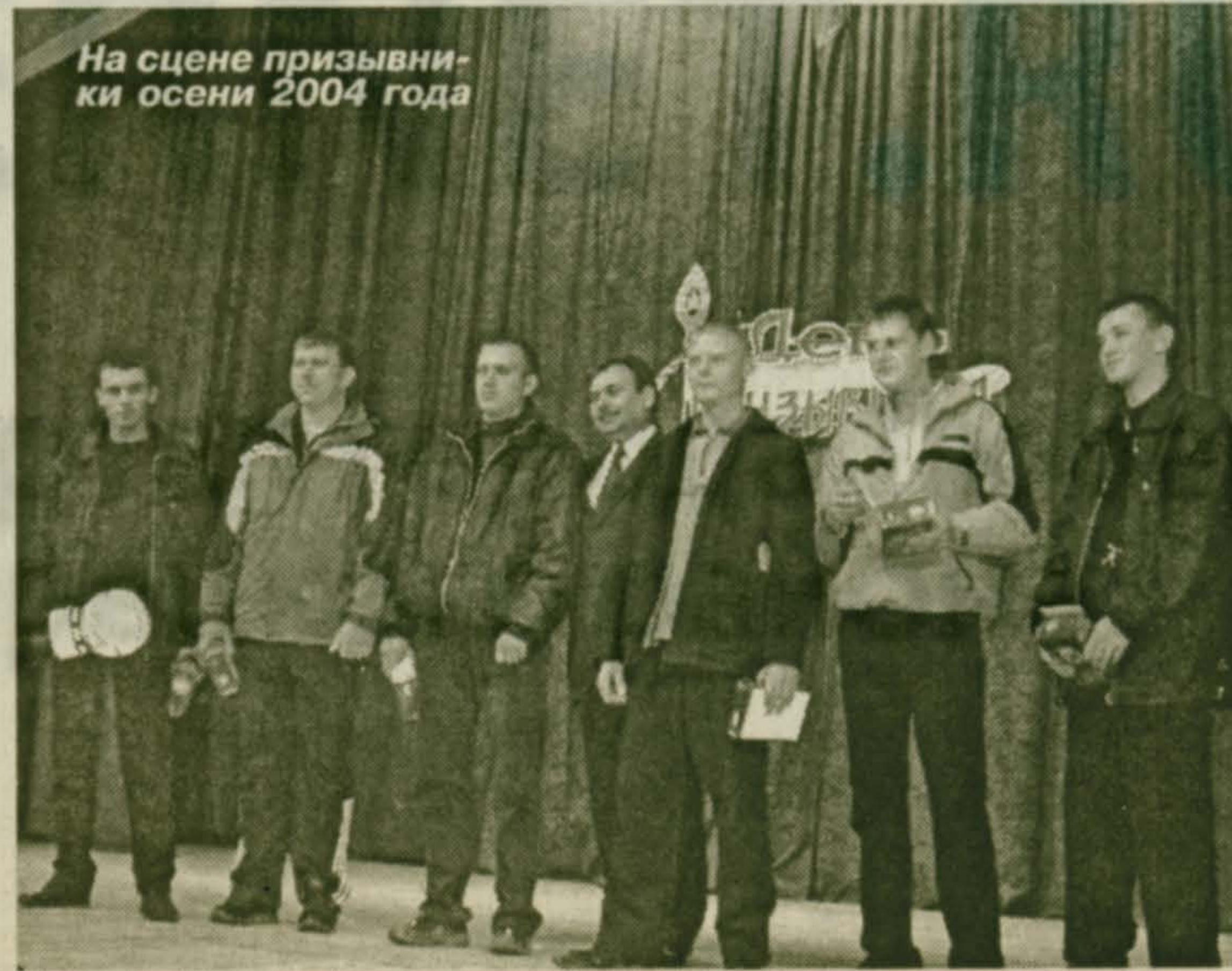
На сцене призывники осени 2004 года