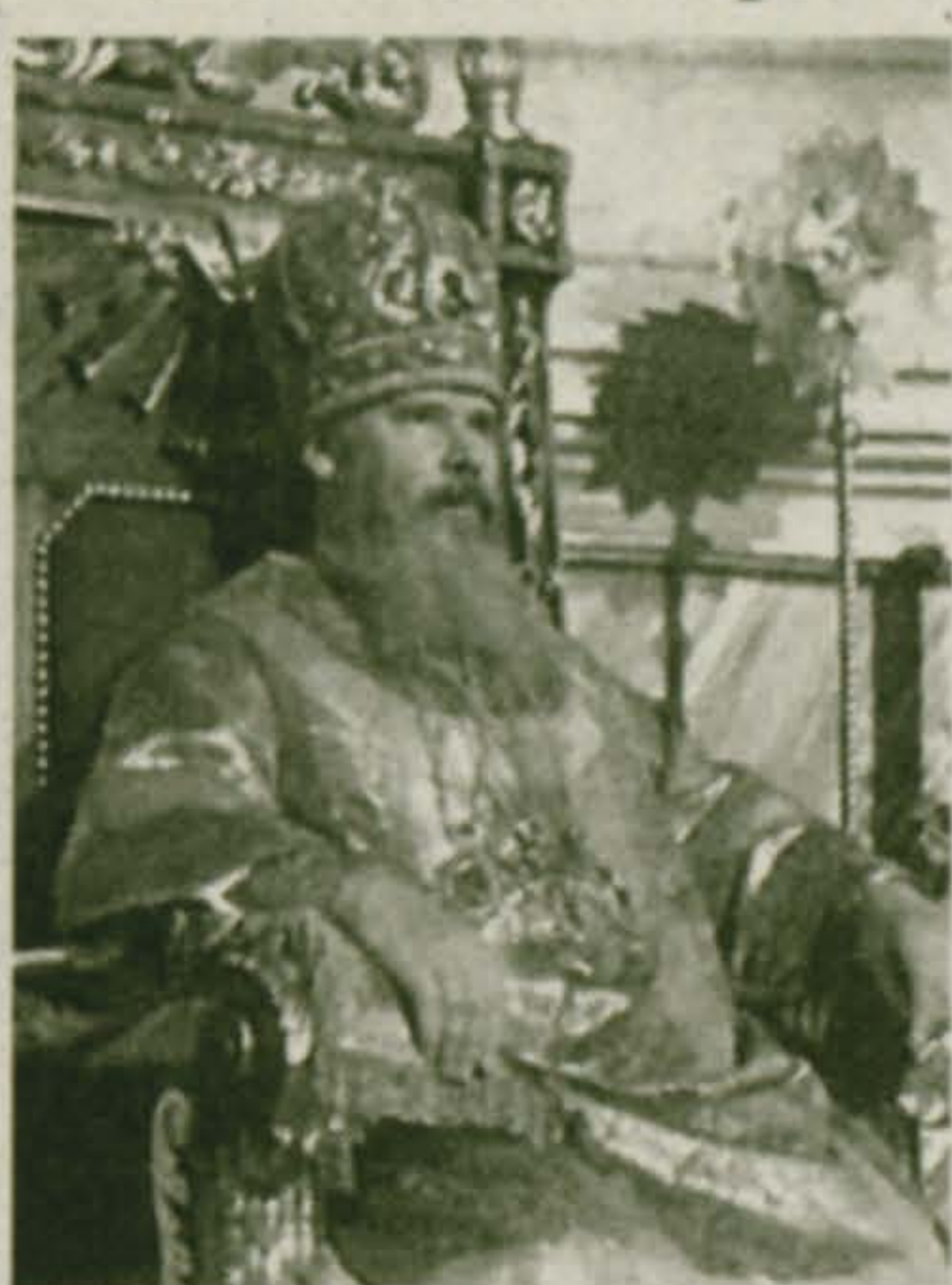
Уважаемые жители Подмосковья!

С праздником Пасхи! Мира и благоволения в каждом доме!