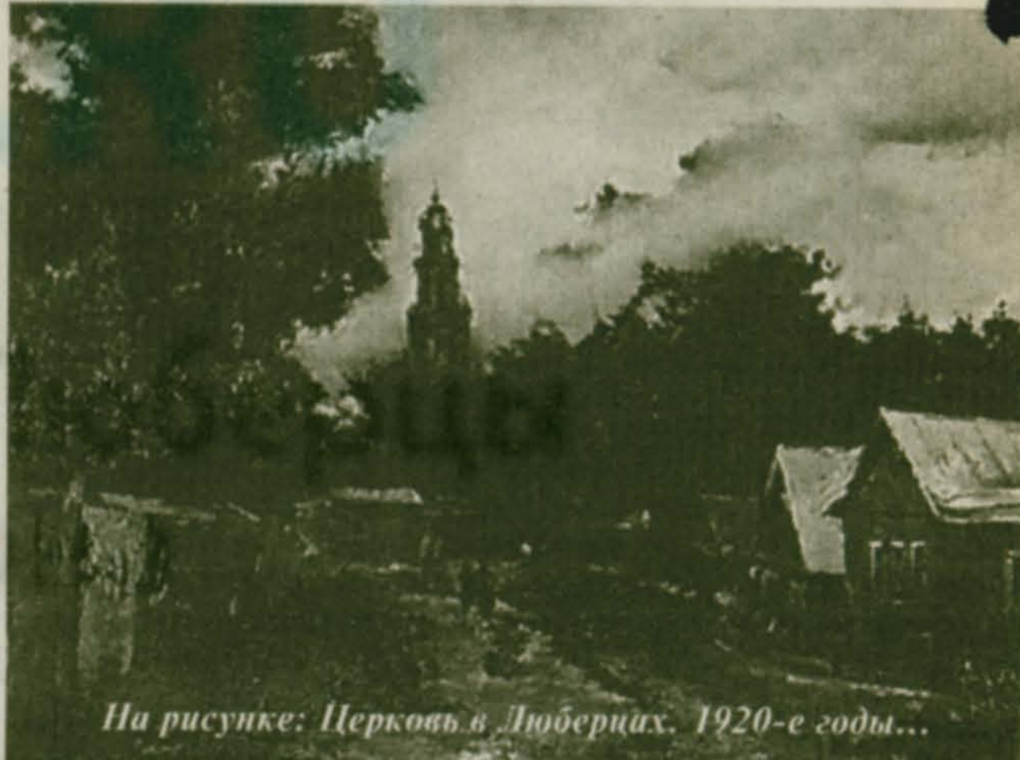
На рисунке: Церковь в Люберцах. 1920-е годы...