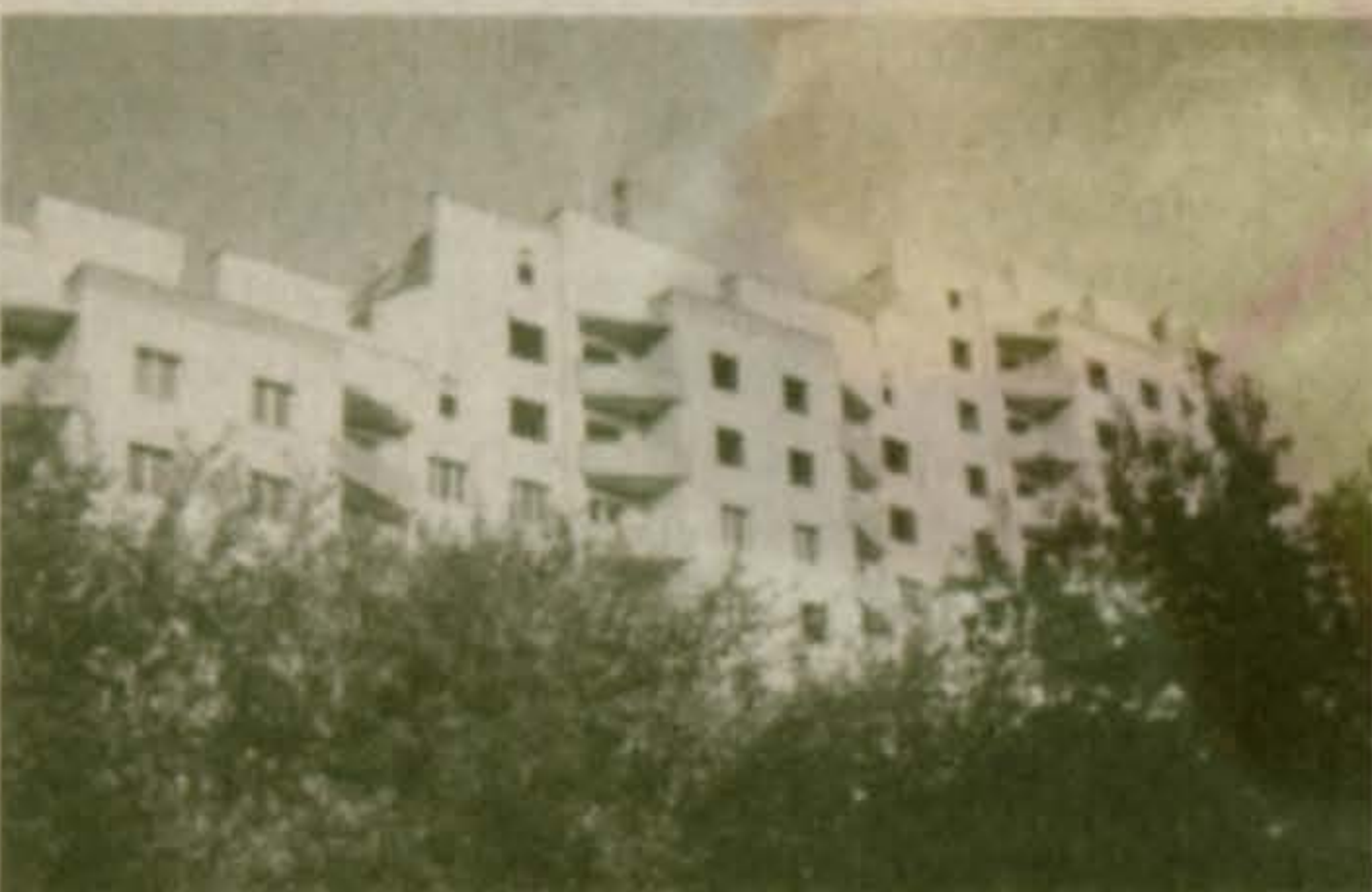
Наши новостройки в 2003 году: ул. Коммунистическая, жилой многоэтажный корпус № 17. Оригинальная планировка подъездов, кирпичная отделка. Ансамбль удачно смотрится в тени зелени у Наташинских прудов

тня Московской области, Правительство Московской области постановляет: