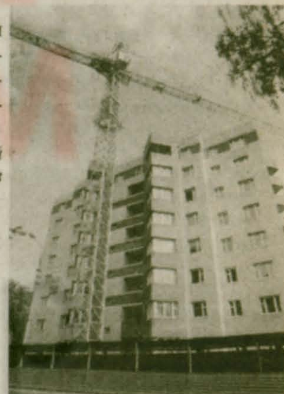
Наши новостройки в 2003 году: одно из самых оригинальных проектных решений — выносные эркеры, нестандартные лоджии и балконы, так называемые смещенные плоскости... Ул. 8 Марта, 28, корп. 12