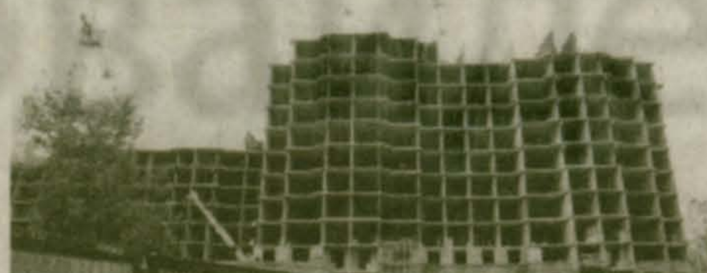
Наши новостройки в 2003 году: 115-й квартал города; фирма «МАННИ» возводит жилые корпуса № 40 и 40-а улучшенной планировки по самым современным технологиям стройиндустрии