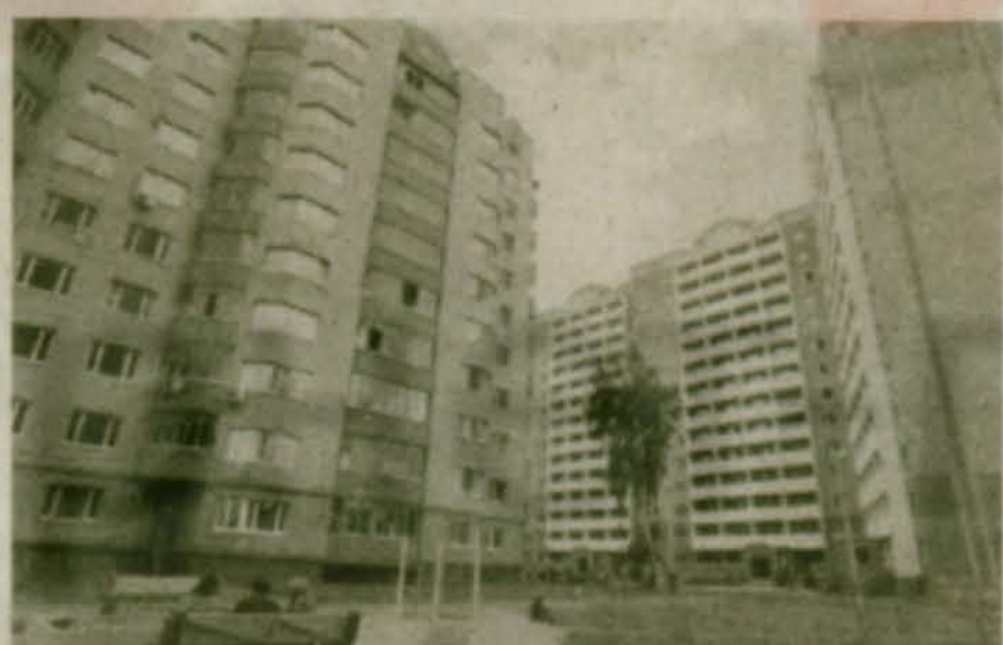
Наши новостройки в 2003 году: основной объект жилищного строительства нынешнего года — микрорайон «Октябрьские проезды». Новые дома имеют совершенный московский вид и комфортность, продолжая стиливое единство с микрорайоном «Жулебино»