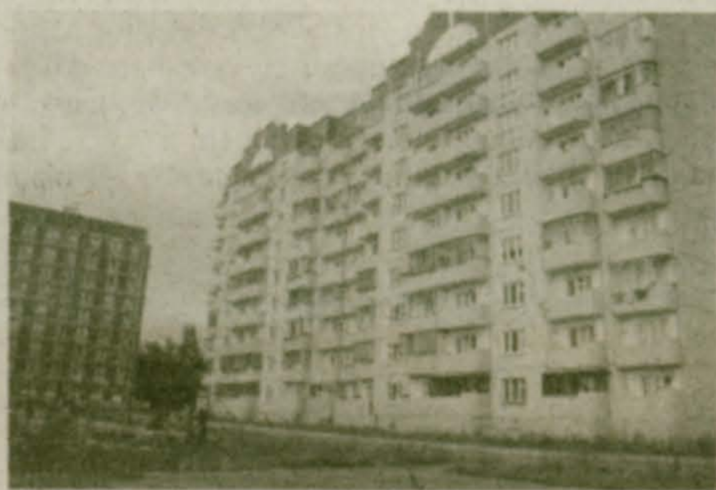
Наши новостройки в 2003 году: ул. Володарского, 76. Одна из красивейших новостроек в северной части города