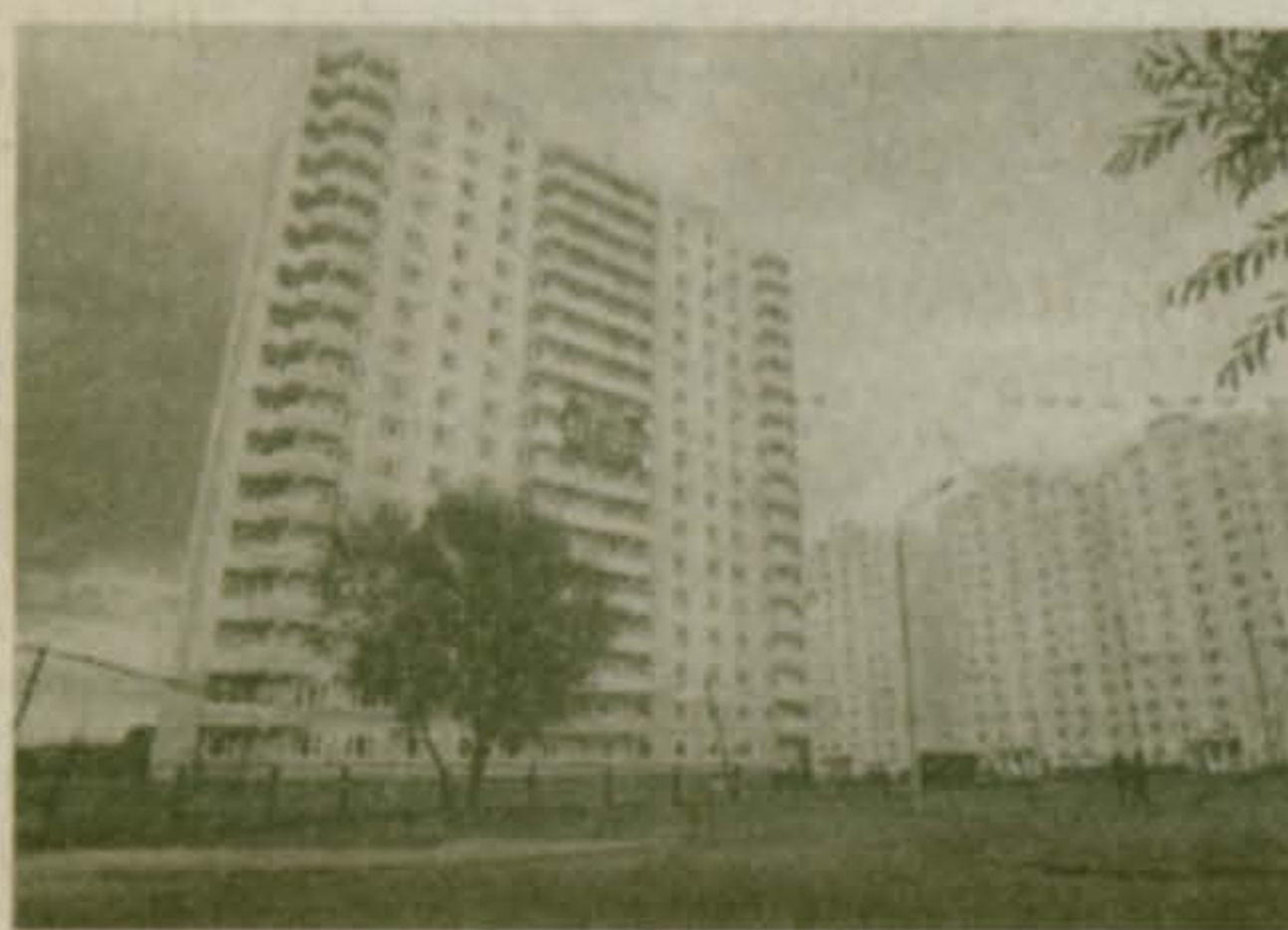
Наши новостройки в 2003 году: по районной программе сноса ветхого жилья возведены корпуса № 26, 27, 28 в шестом микрорайоне Люберцы

Районная жилищная программа — это комплекс мероприятий по строительству объектов жилищного строительства в Московской области в 2004-2008 годах, внедрения и дальнейшего распространения новых строительных, организационных и фи-